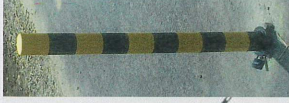
sloupek uzamykatelný reflexní

Dne 26.8.2020 DOPORUČUJI KRPM-92724-1/ČJ-2020-140506