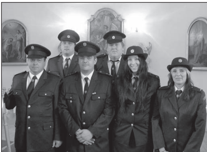
Čestná stráž SDH na zářijových oslavách

V loňském roce byla prováděna anketa mezi občany Lutína a Třebčína, zda by měli zájem o kompostér, který by využili na svých zahradách. Proto byli osloveni především občané, kteří mají rodinný dům se zahradou. Na základě vyplněných dotazníků se Obec Lutín zapojila do projektu „Vybavení obcí Mikroregionu Kosířsko kompostéry na rozložitelný odpad“ , který byl vyhlášen v červnu loňského roku. Do projektu se zapojily ještě obce Drahanovice, Slatinice, Těšetice, Slatinky, Luběnice a Ústín. Projekt byl schválen koncem roku 2011 a na jaře 2012 proběhlo zadávací řízení na dodavatele kompostérů. Po opakovaném zadávacím řízení byly kompostéry dodány koncem měsíce srpna obchodní firmou Elkoplast CZ ze Zlína, výrobcem kompostérů je firma Container Trading WFW z rakouského Pettenbachu. Dodané kompostéry byly během měsíce září a října zapůjčeny na pět let občanům a poté budou bezplatně převedeny do jejich vlastnictví na základě smlouvy o výpůjčce. Každý, kdo obdržel kompostér, hradil formou peněžního daru na údržbu zeleně naší obce částku 10% z jeho celkové ceny. Tyto peněžní prostředky se tak vrátily obci do rozpočtu, ze kterého byla hrazena deseti-procentní účast Obce Lutín na výše uvedeném projektu.