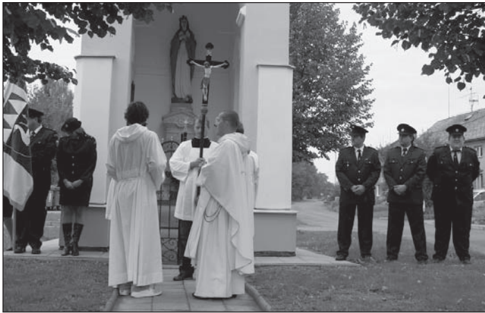
Svěcení „horní“ kapličky