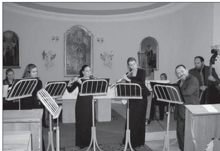
Koncert Black Ladies