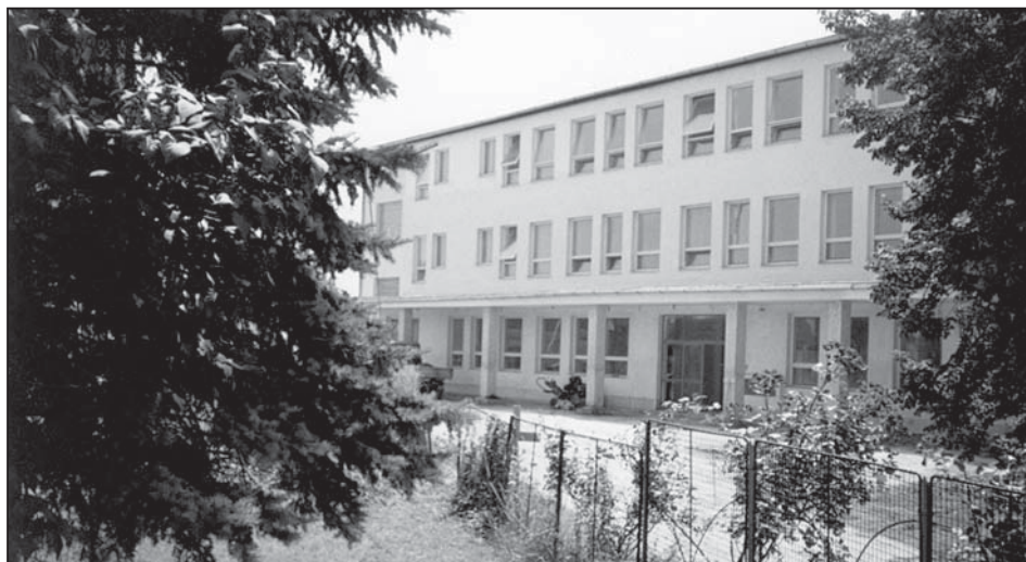
Pavilon v provozu - rok 1994