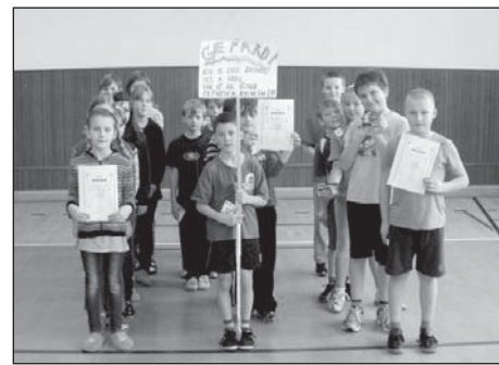
1. – 3. místo

V únoru proběhlo mezitřídní kolo ve florbalu mladších žáků - chlapců a děvčat z 3. a 4. tříd. Nejdříve se hrály zápasy v rámci jednotlivých ročníků, vítěz postoupil do finále. O první a druhé místo se pak utkalo vítězné družstvo 3. tříd – Gepardi (3.A) a vítěz 4. tříd – Bílí tygři (4. B). Každý zápas se hrál naplno za mohutného povzbuzování fandů a třídních roztleskávaček.