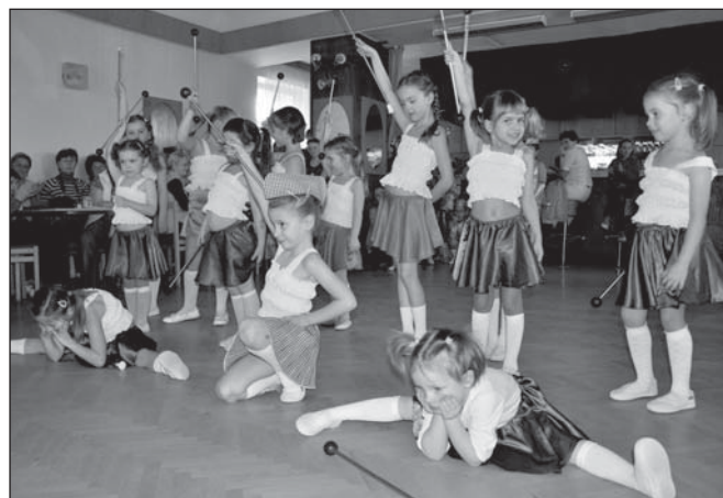
Z vystoupení mažoretek

Bc. Vladka Kolářová kulturní komise Třebčín