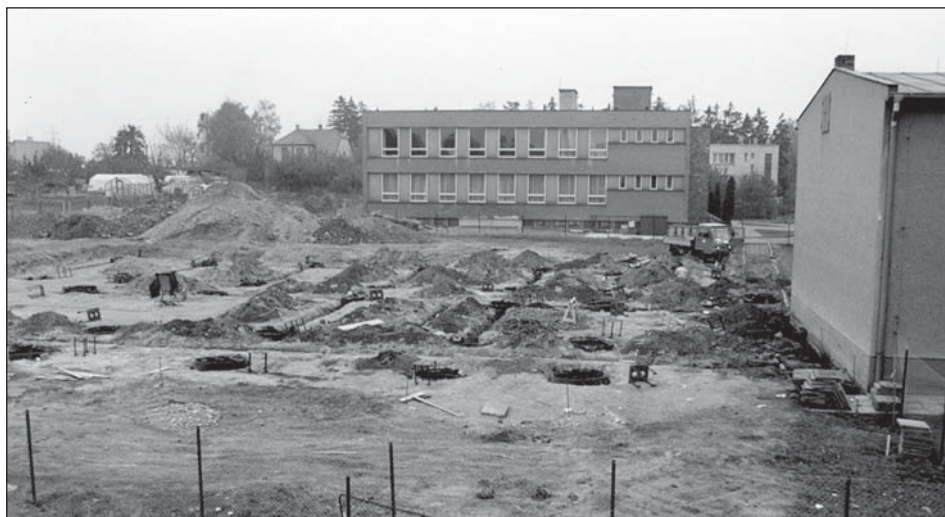
Nový pavilon ZŠ Lutín - zahájení stavby v roce 1992

Před obecní zastupitelstvo byly v roce 1994 postaveny dva velké úkoly, se kterými bylo nutno se vypořádat. Měly se uskutečnit přeložka potoků a rozšíření ZŠ o nový pavilon včetně rekonstrukce staré školy.