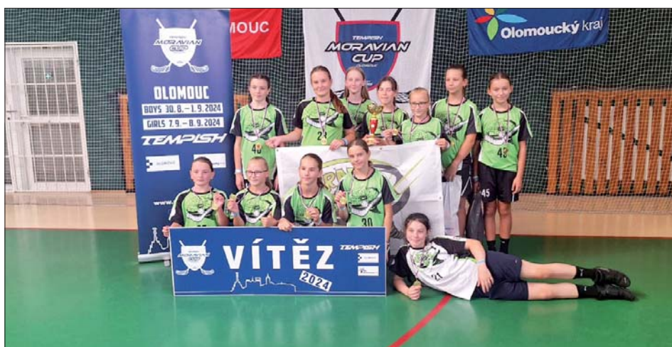
Vítězství a radost z něj byly zasloužené.