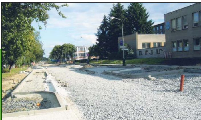
Sigmundova ulice při rekonstrukci.