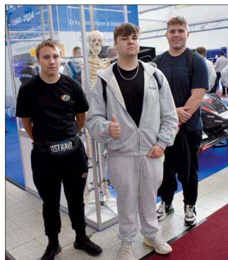
Studenty zajímaly všechny technické novinky.