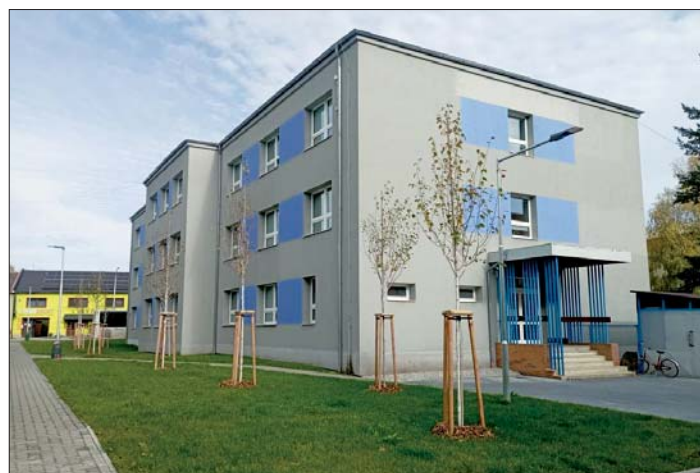
Nové břízy u chodníku z Břízové na Olomouckou ulici.