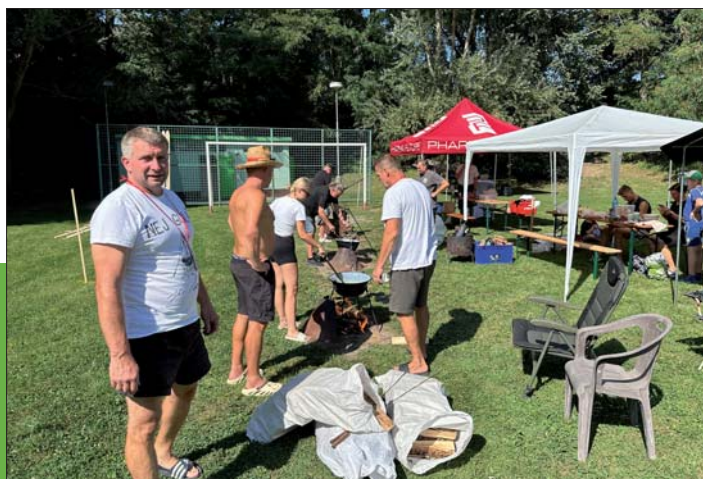
Hasiči předvedli své umění kuchařské i fyzickou zdatnost v soutěži.