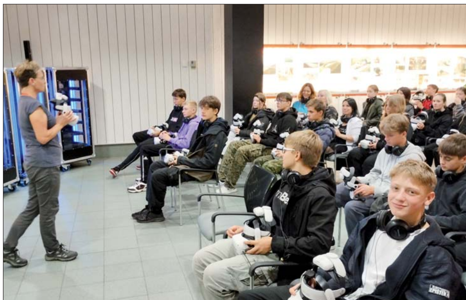
V promítacím sále se žáci seznámili s chodem celé elektrárny.

„Pak jsme s průvodcem vešli do komunikační štol, kde jsou zalité koleje. Kdyby bylo zapotřebí manipulovat s rozměrným a těžkým transformátorem, jen se vyškrábne zálivka a koleje jsou připraveny k transportu. Tunelem jsme došli do kaverny, ve které je strojovna. Na zdech byly podivné kresby, které mají pracovníkům zvednout náladu, aby podzemí nepůsobilo depresivně. Od průvodce jsme se do-