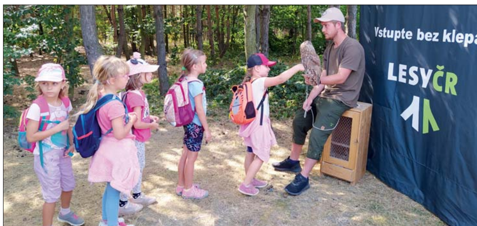
Živou sovu si každý den nepohládíte!