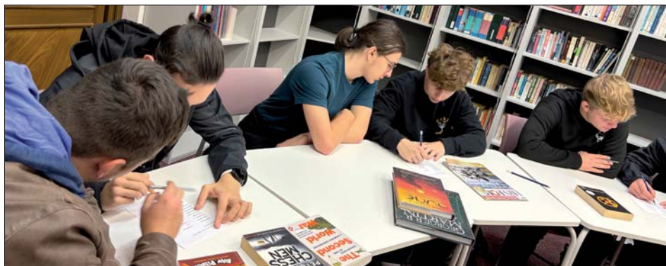
Britské centrum nabízí k zapůjčení knihy a učebnice v angličtině.