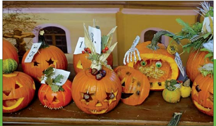
Řezbářské umění předvedli malí i velcí umělci.