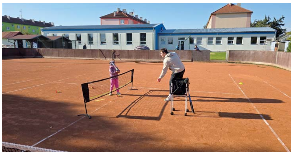
Dokud je hezké počasí, trénujeme na kurtech.

Tréninky probíhají na tenisových kurtech v areálu TJ Sigma Lutín (vchod z ulice K Sídlišti), v zimě se přesunou do tělocvičny TJ. Za pronájem kurtů ani tělocvičny se neplatí, potřebné pomůcky nakoupil spolek TJ Sigma Lutín z.s. a částečně sponzorsky dodal prodejce sportovního vybavení DECATHLON. Uhradit je třeba pouze instruk-