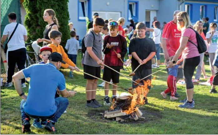
Voňavá svačinka přišla vhod.

té i pohoštění pro děti ve formě balíčku, ve kterém se skrýval špekáček k opékání na připraveném ohýnku. Odpoledne se