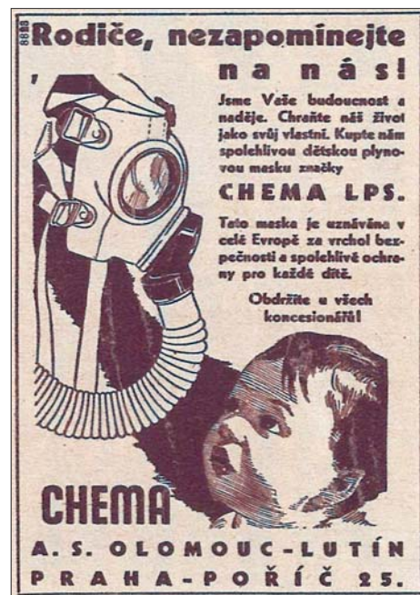
Reklama z čísla 37.

1939-1941 to bylo takto pouze jednou. Je sice docela unikátní, ale zřejmě nešlo zrovna o dobrý marketinkový tah, protože jinak se reklamy Sigmy i Chemy poměrně často