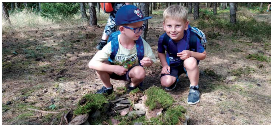
Tenhle úkol hladce zvládneme.