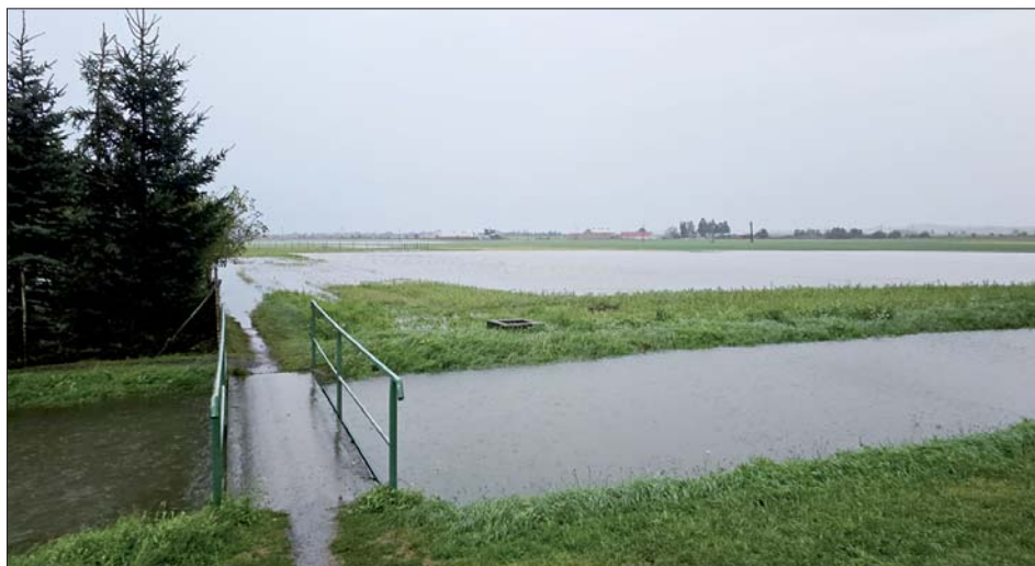
Vodoteč za lutínským sídlištěm se vylila do pole a záhradek.

V minulém vydání Obecního zpravodaje jsme se v rámci rubriky „Starosto, jak to teda je?“ zabývali problematikou čištění koryt vodních toků v katastrech naší obce. Jako bychom to přivolali, protože velkou část Moravy zasáhly v polovině září povodně.