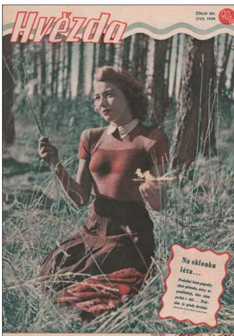
Titulní strana Hvězdy z roku 1939.

Ve Hvězdě číslo 37 z roku 1939 byla uvedena reklama, kterou vidíte na obrázku. Vybízela rodiče ke koupi dětské plynové masky jako dobré ochrany pro případ plynového útoku. Nevím, zda byla uveřejněna ještě v některém dalším čísle, ale v letech