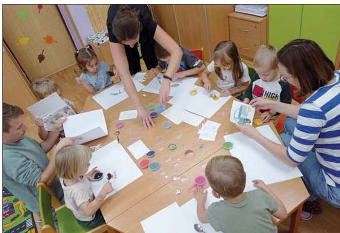
Oblíbené tvořivé dílničky pro děti i rodiče.