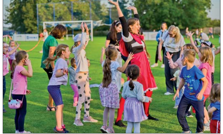
Pohybem proti lenosti a obezitě!

náramně vydařilo, draci nakonec vzletli a nám nezbyvá než se těšit na další ročník!