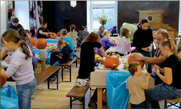
Dlabal každý, kdo měl ruce (a dýni).