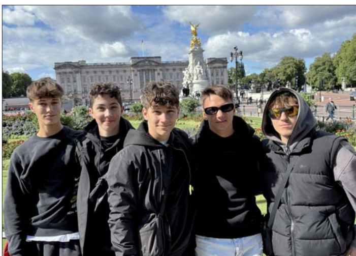
V pozadí Buckinghamský palác – sídlo krále.

Stonehenge – komplex kamenných kruhů, největší britský monument a nejznámější pozůstatek doby bronzové – pozn. red.)