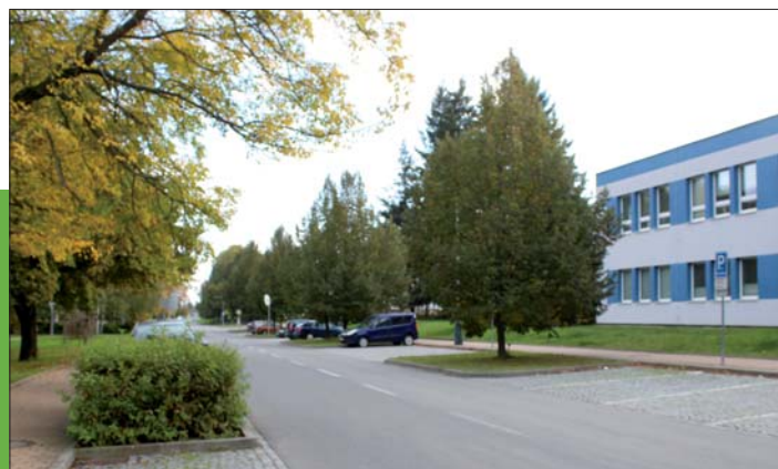
Současný pohled – přibily stromy mezi parkovišti.