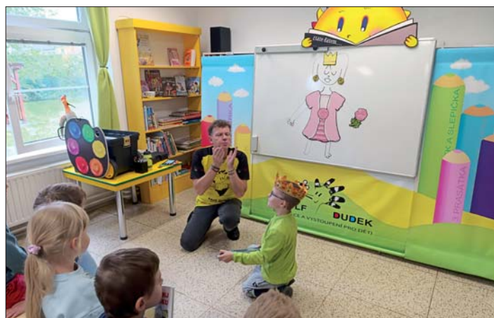
Tak se v knihovně budily princezny.