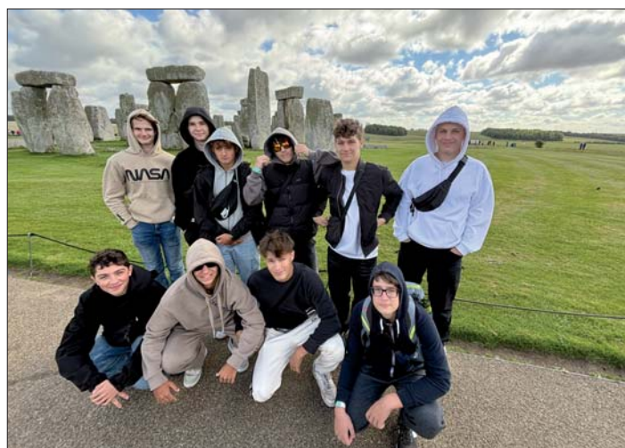
Stonehenge na Salisburské pláni – nejstarší známý „kalendář“.