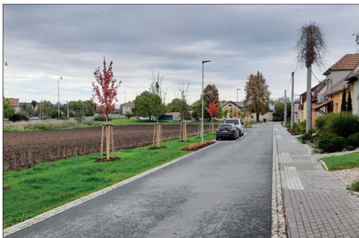
Nová zeleň na Kaplické ulici.