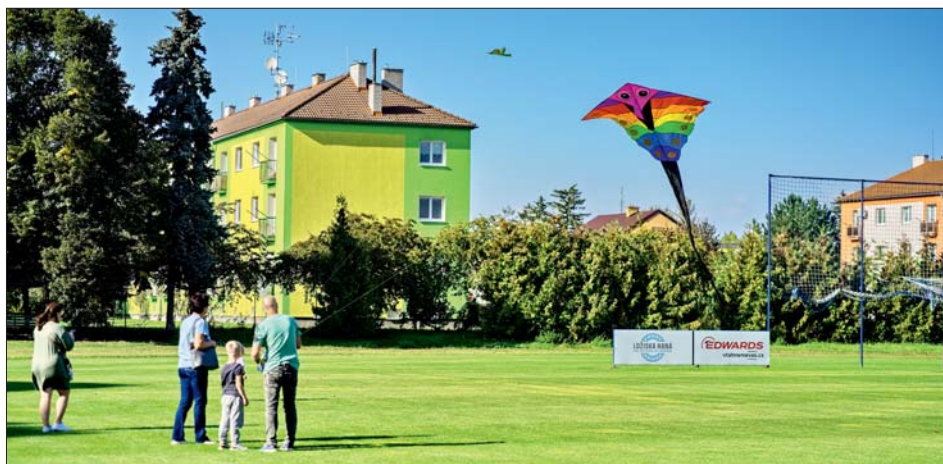
Nakonec se přece létalo.

V pátek 20. září bylo krásné, slunečné a teplé odpoledne jako stvořené pro soutěž, dovádění „na hradě“, malování na obličej, tvoření a pouštění draků. Pravda je, že vítr moc nefoukal, ale ani to nebyla překážka a odpoledne si všichni pořádně užili. Vhod přišlo zajis-