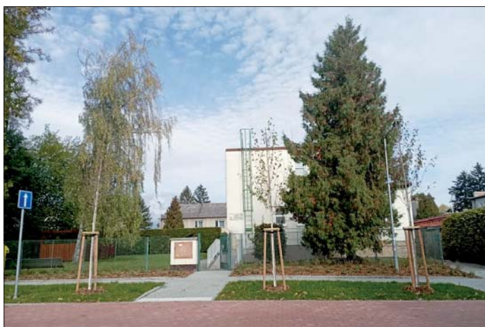
Břízová ulice u knihovny.

Na Kaplické v Třebčíně pak přibylo 16 javorů babyka, 5 javorů