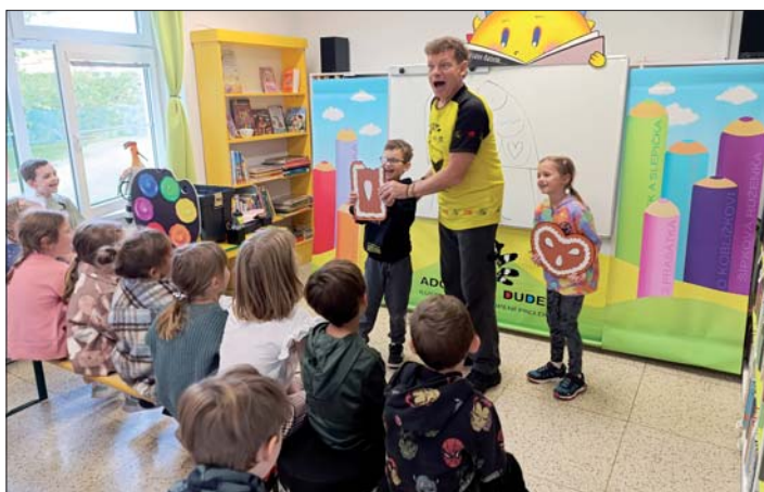
Stačila chvilka a ježibaba přišla o perník.

Těto vskutku akční besedy se zúčastnili žáci prvních tříd naší základní školy. Nejen děti, ale i my učitelky jsme zažily hodinu legrace, poučení, skvělé zábavy a příjemné atmosféry.