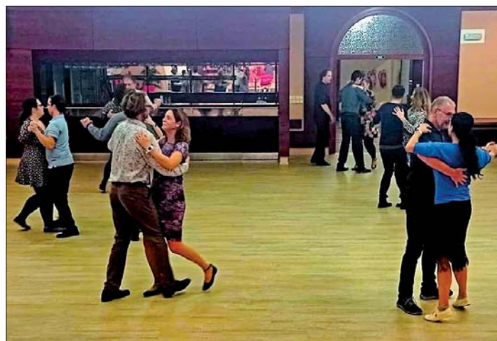
Tanec pro radost i dobrou kondici.