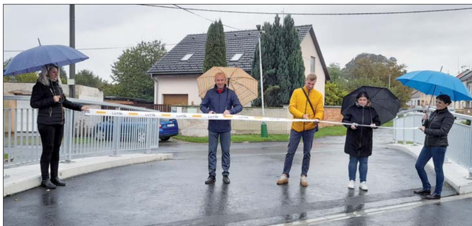
Ani déšť nepokazil radost z hotového díla.