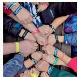
Na nudu v našem oddílu nemáme čas.