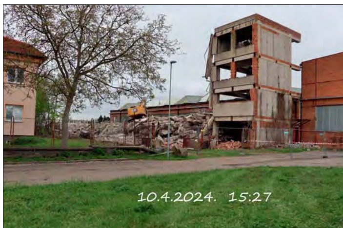
Ohavný „skelet“ konečně uvolnil místo pro budoucí odpočinkovou zónu. Demolice proběhla letos 10. dubna.