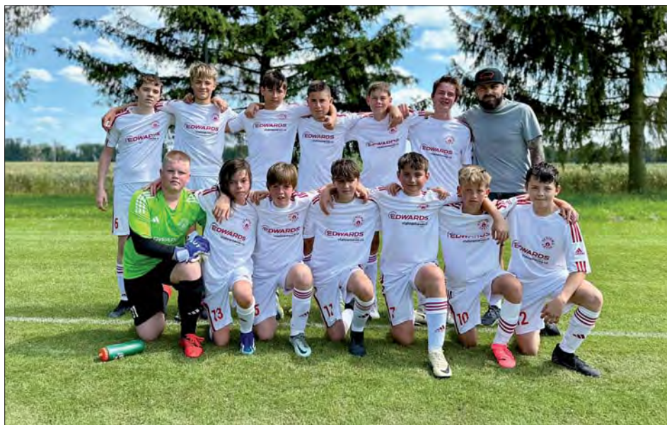
Starší žáci (sdružení s Těšeticemi).