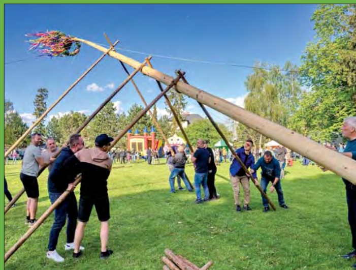
Silní chlapi si poradili.