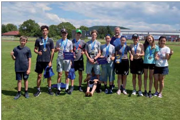
Soutěžní tým pro krajské kolo v Hranicích.