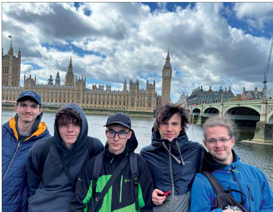
Radost z bohatých zážitků nám nepokazilo ani náladové počasí.

První den jsme strávili v přímořském městě Brighton. Když jsme se dostatečně vydováděli na oblázkové pláži, nově zkon-