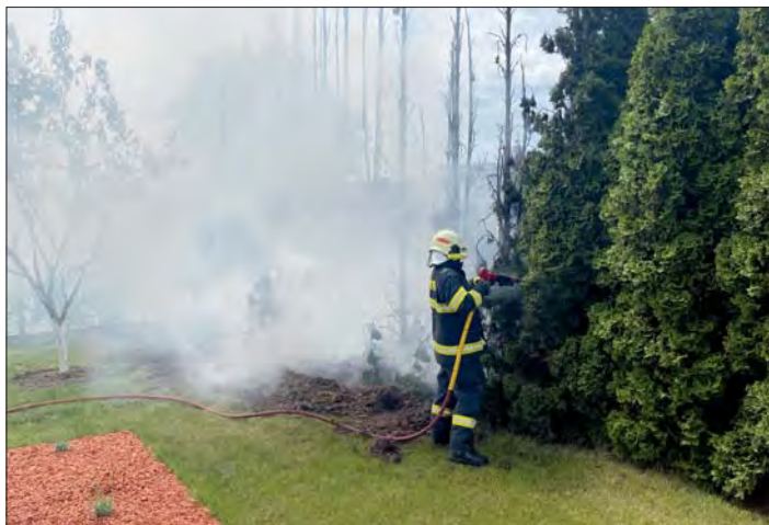
Nebezpečí je zažehnáno.

Největším pracovním záprahem spolku hasičů jsou tradičně třebčinské hody, o kterých přinášíme samostatný článek.