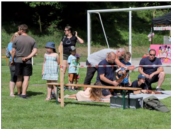
Soutěž ve střelbě ze vzduchovky.