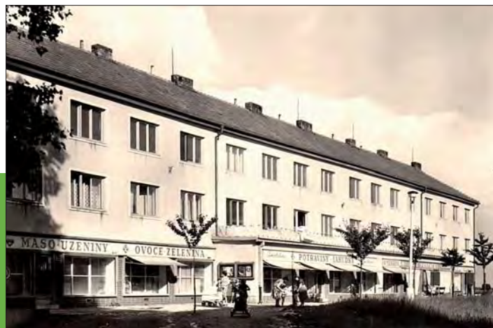
Obchody v dnešní Růžové ulici v šedesátých letech.