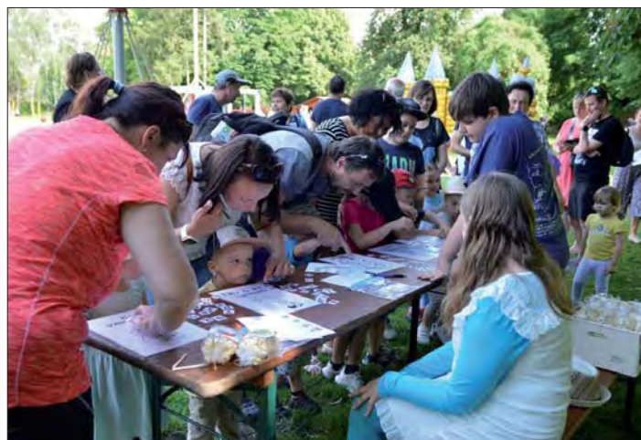
Pexeso skládali malí i velcí.