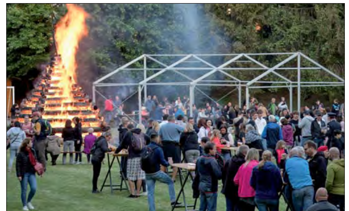
Páteční oslavy v Ohradě.

Večerem nás provázela kapela ROXY a k dispozici byla spousta dobrot na chuť, hlad i žízeň.