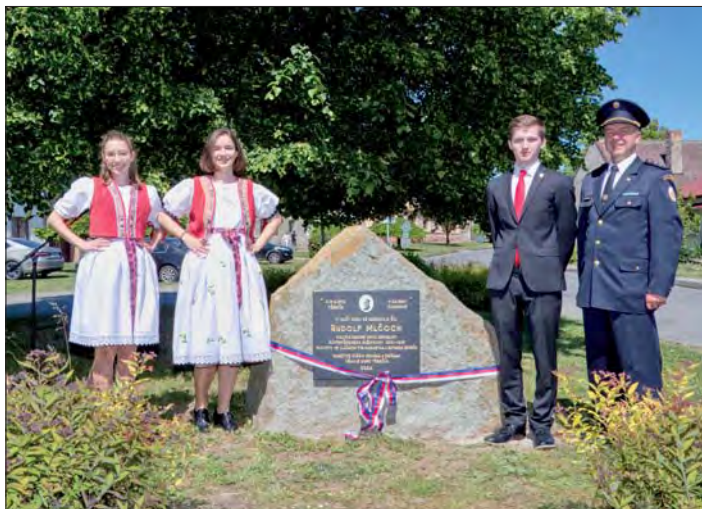
Odhalení pamětní desky významnému rodákovi.