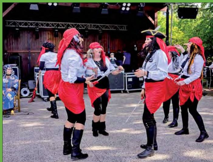
Pirátský tanec o soudek rumu.