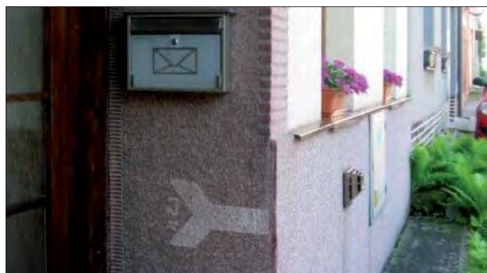
Třebčínská připomínka války.