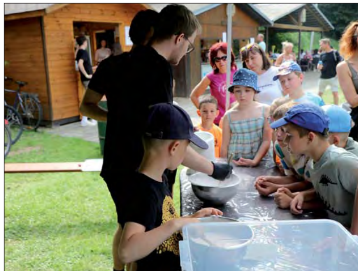
S mladými vědci z Pevnosti poznání.