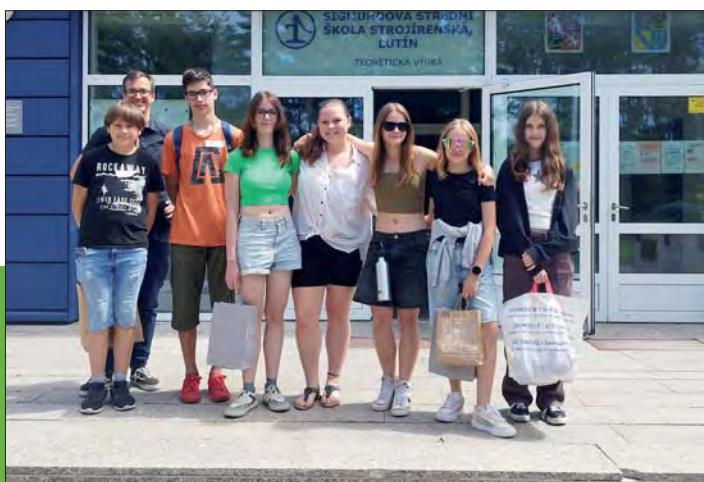
Náš „robotický“ soutěžní tým.