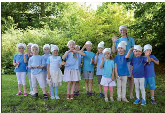
„Šmouli“ dětský den na Rybníčku.