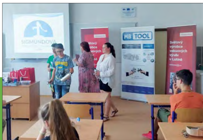
Pro cenu jsme si šli pětkrát.