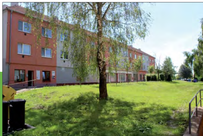
Dům má zateplení a novou fasádu, část bývalých obchodů má nové využití.