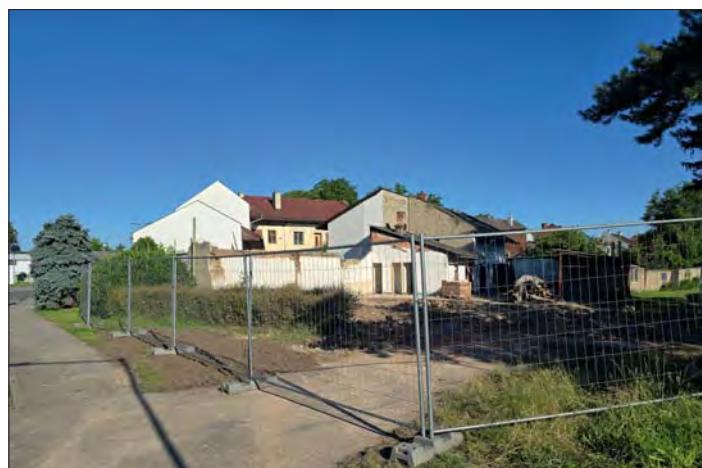
Prostor po zbouraném domě č.p. 49 rozšíří zázemí Technických služeb.