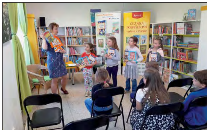
A nakonec autogramiáda.