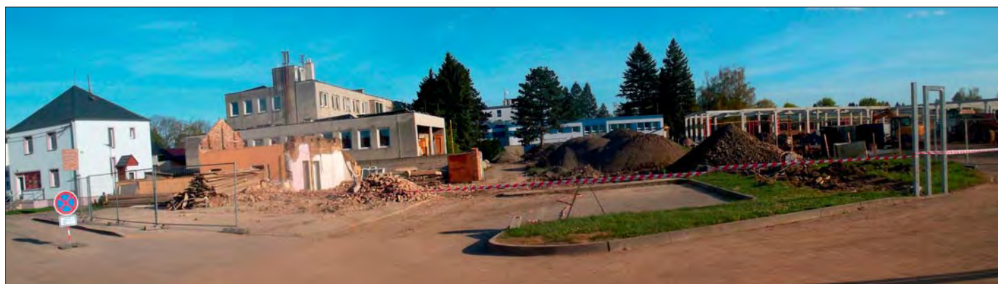
Na prostranství před BILLOU vznikne nové centrum obce.