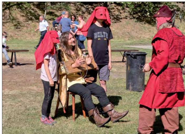
Odpoledne v Ohradě „úřadoval“ také kat.