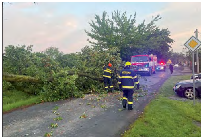
Úklid stromů spadlých na silnici.