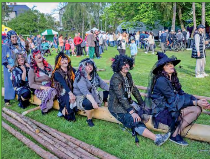
„Osedlaná“ májka před vztyčením.