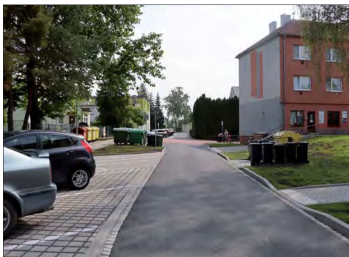
Nová Břízová slouží jejím obyvatelům.