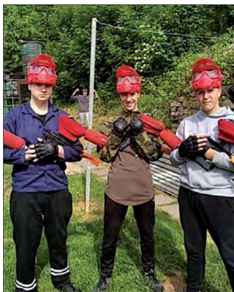
K boji připravení!

Pod vedením zkušeného instruktora byla naše třída včetně pana učitele rozdělena na dva týmy. Po objasnění pravidel boje byly rozděleny speciální značkovací paintballové zbraně. Jsou to pistole, které vystřelují želatinové kuličky napl-