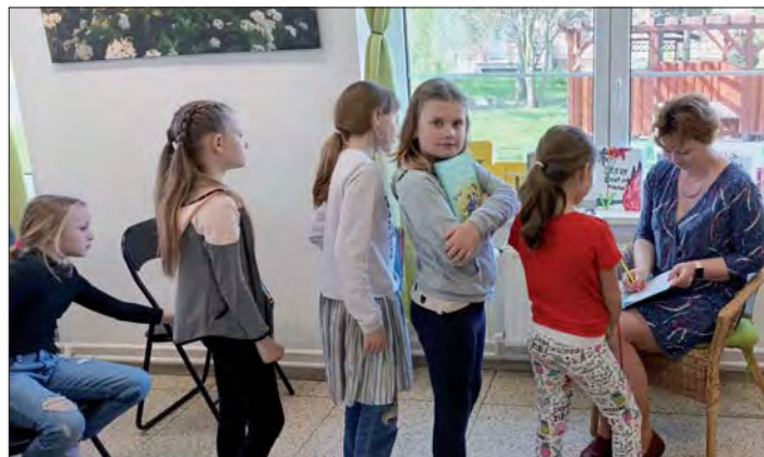
Na závěr se rozdávaly podpisy na památku.