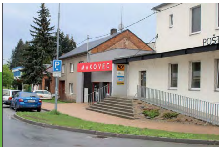
Stejně místo s novou prodejnou a poštou dnes.