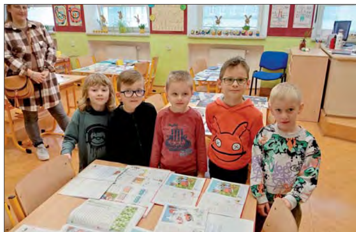
Do oslav se zapojili i naši „předškoláci“.