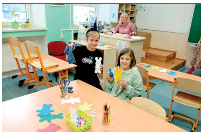
Děti nabídly návštěvníkům suvenýry na památku.