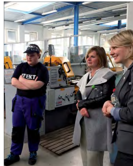
Prohlídka učňovských dílen.