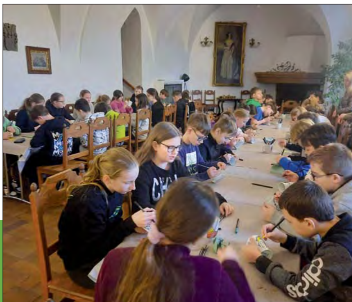
Tvořivé dílny na hradech a zámcích jsou stále oblíbenější.