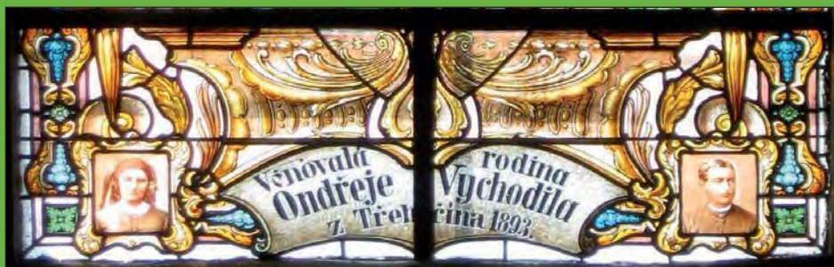
Dedikace v dolní části vitráže.

Proč zmiňuji v této souvislosti Noc kostelů, která se koná každý rok na přelomu