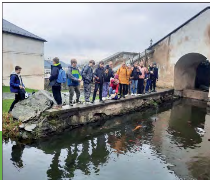
Prohlídka exteriéru hracu.