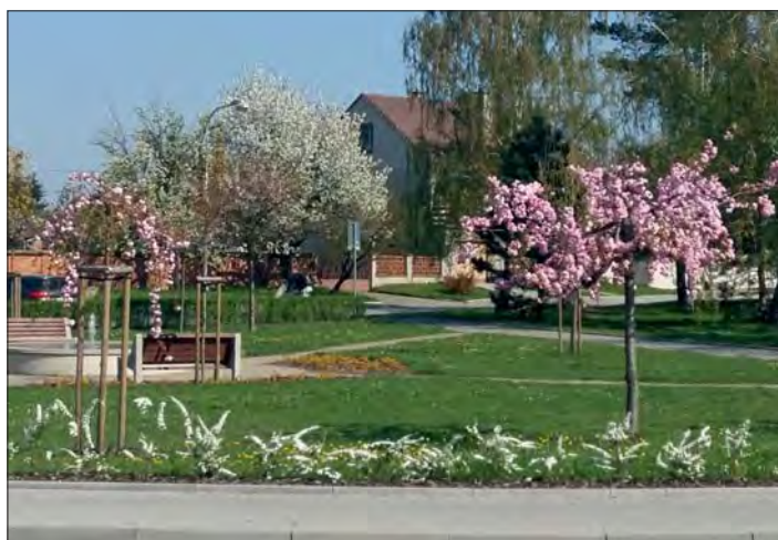
Prostranství před obecním úřadem rozkvetlo...