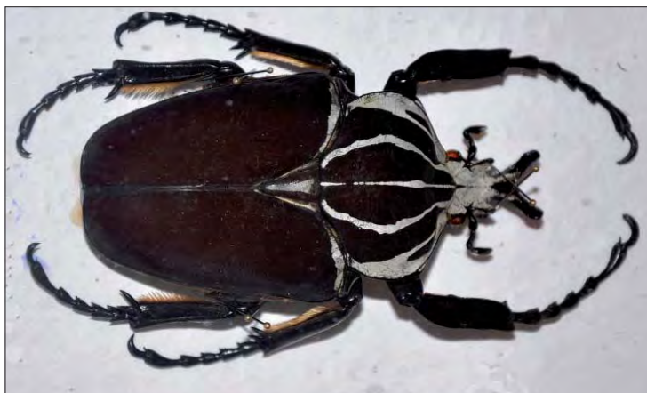
Brouk Goliáš (Goliathus obrovský) patří k největším broukům žijícím na naší planetě. Ilustrační foto