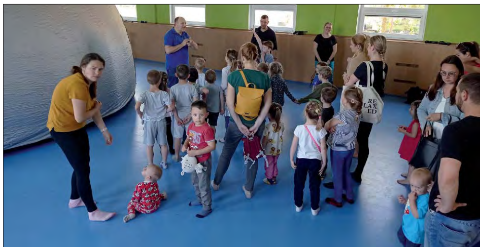
„Vesmírné odpoledne“ v tělocvičně (herně) TJ.