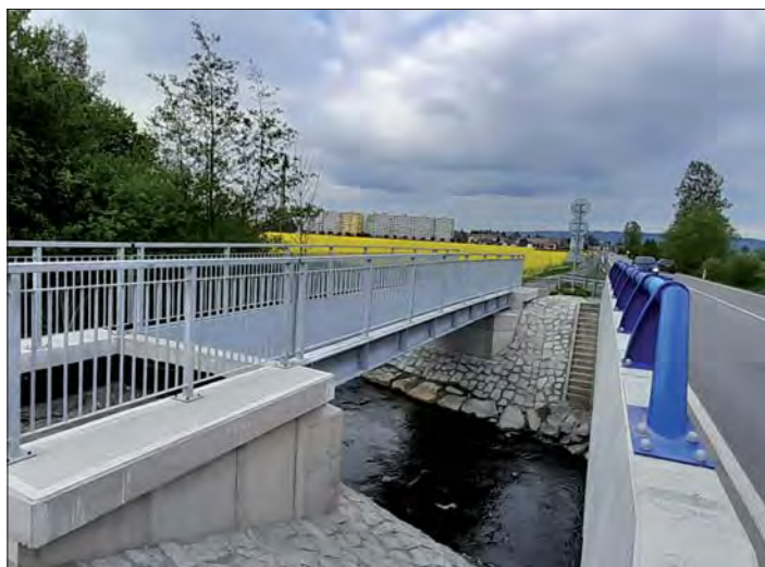
Cyklostezku na levém a pravém břehu Blaty spojuje nová bytelná lávka.

Je však třeba říct, že cyklostezka byla budována přesně podle projektu, který zahrnoval toto velmi netypicky zvlněné řešení podélného profilu stezky. Projektant trval na navrženém řešení s argumenty řádného odvodnění v rovinatém terénu a úsporami na zemních pracích.