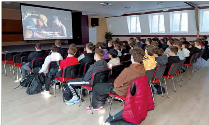
Po zhlédnutí filmů s lidskoprávní tematikou následovala náročná debata.

Festivalu „Jeden svět na školách 2024“, který je od roku 2021 vzdělávacím programem organizovaným společností Člověk v tísni, se ve středu 3. dubna zúčastnilo 148 studentů. Projekce tří filmů s lidskoprávní tematikou se konala výjimečně v naší režii, a to v aule ZŠ Lutín.