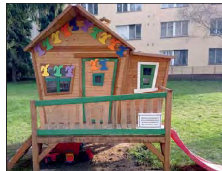
Domeček pro hry v zahradě.

Na své si přišli opět i malí knihomolové na „Večeru s Andersenem“. Děti si donesly svou oblíbenou knížku, dozvěděly se, odkud se knížky vlastně berou, vyro-