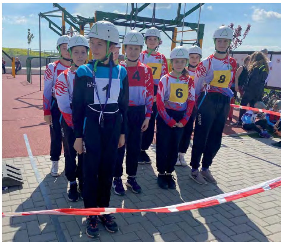
Pohárová soutěž v Doloplazech prověřila připravenost na hru „Plamen“.