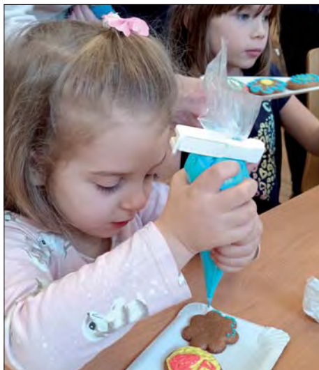
Velikonoční dílny zaměstnaly malé i velké návštěvníky.