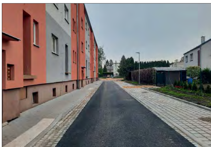
Nová cesta a parkování za obchody v „Růžovce“.