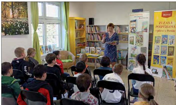
Při čtení děti ani nedutaly.