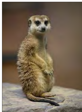
Pravým domovem surikat jsou pouště a travnaté oblasti jihozápadní Afriky. Ilustrační foto