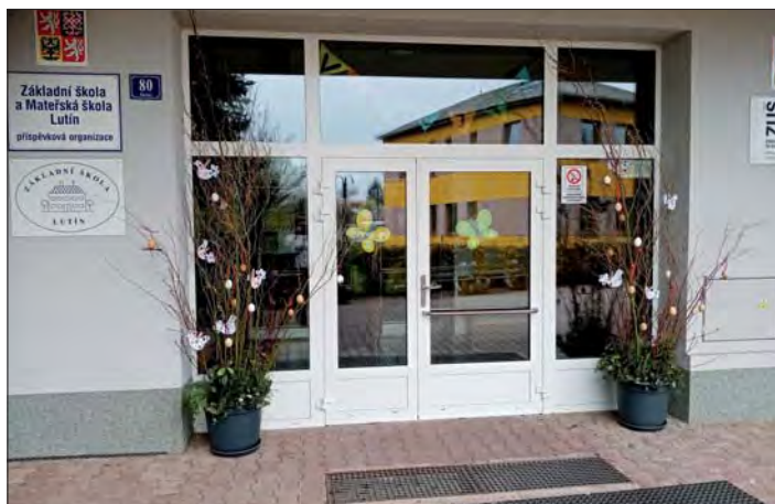
Hlavní vchod do budovy školy.