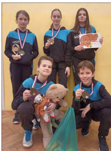
„Ratajsky soke“ přinesly zlato.

I letos jsme hned v úvodu února vyrazili na soutěž s názvem „Ratajsky soke“. Složili jsme jen jedno družstvo starších. Soutěžilo pět dětí, které musely uvázat těsně před startem náhodně vybraný uzel. Běželo se na dva pokusy a teprve po tom druhém nechal tým SDH Třebčín všech 39 dalších družstev za sebou s rekordním časem trati. Děti i trenéři měli