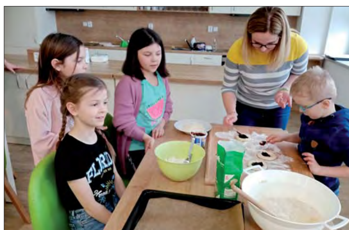
Malí „kulináři“ ve školní kuchyňce.