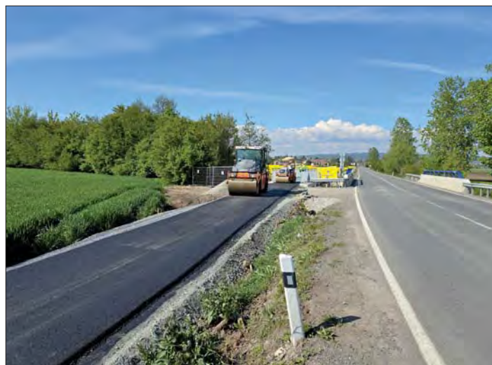
Práce na trase od Blaty do Hněvotína běží rychlým tempem.

O termínu slavnostního otevření, na které se všichni těšíme, budeme občany s předstihem informovat.