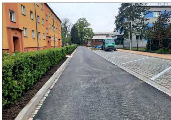
Práce v Břízové ulici vrcholí.