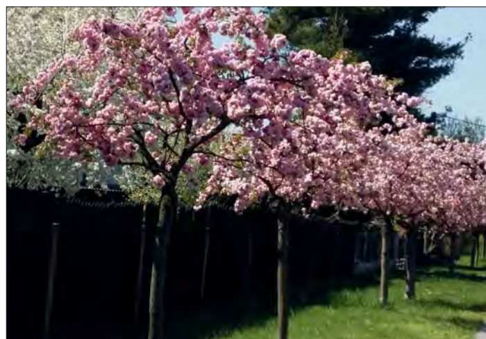
...stejně jako Slatinická ulice.