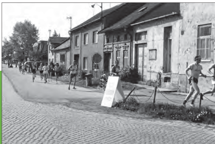
Běh Mánesovou stezkou v květnu 1988.