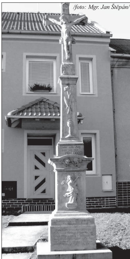
Kříž před č. p. 121

Je možné, že za zánikem původních božích muk stál postupný rozvoj Třebčina, neboť v jeho místě vyrostly již na počátku 19. století domky a možná tak jen ustoupil nové zástavbě. Nově postavený kříž byl kamenný a zajímavý hned v několika ohledech – vcelku bohatou výzdobou a také nápisy, které se k jeho výzdobě vztahují. Kříž se v podstatě skládá ze tří částí – podstavce, dvojitého pilíře a vlastního kříže s postavou Ukřižovaného a nápisem INRI (Iesus Nazarenus rex Iudeorum – Ježíš Nazaretský, král židovský). Patka kříže dosedající na pilíř nese drobnou plastiku zachycující obecně známou symbolikou utrpení Krista v zahradě Getsemanské na hoře Olivetské. Kristus zde klečí na úpatí hory s křížem a vztahuje ruce k oblakům, z nichž mu polopostava anděla vrací kalich hořkosti. Tuto scénu