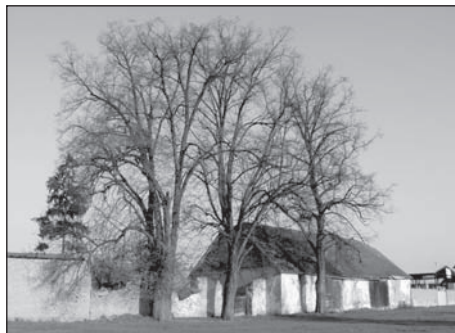
Prostor „pod lipami“

V Lutíně je všeobecně známý prostor „pod lipami“ (nebo lépe „pod lěpama“), který v minulosti sloužil a nadále slouží různým společenským i jiným akcím – jako cvičiště koní, lunapark při příležitosti lutínských hodů, stavění máje, za 2. světové války jako tábořiště německé armády, v době nedávné jako deponie hlíny apod.