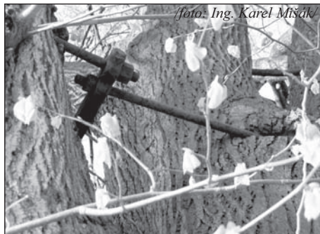
Detail ocelových třmenů

Trojúhelníkový prostor za stodolami velkých lutínských gruntů nese název podle tří obrovských lip, které byly vysázeny (bohužel nevíme kdy) za hospodářstvím č.p. 13. Údajně bylo těchto lip pět, ale dvě z nich musely ustoupit provozu v stále ještě zachované „Sedláčkově“ stodole.