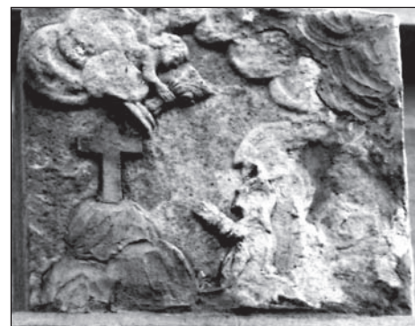
Detail Kristus v zahradě Getsemanské