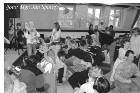
Děti z mateřinky se bavily i vzdělávaly