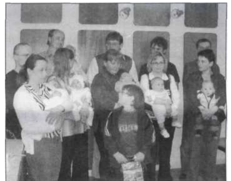
Sbor pro občanské záležitosti

V neděli dne 23. 4. 2006 v Třebčíně proběhlo slavnostní přivítání 5 dětí do svazku obce. Krásný doprovodný program si připravili žáci ZŠ Lutín.