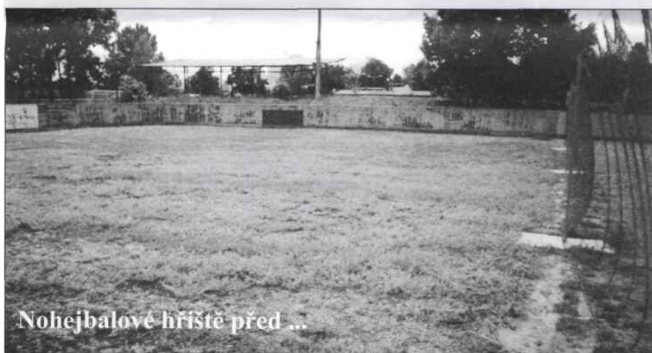
Nohejbalové hřiště před ...