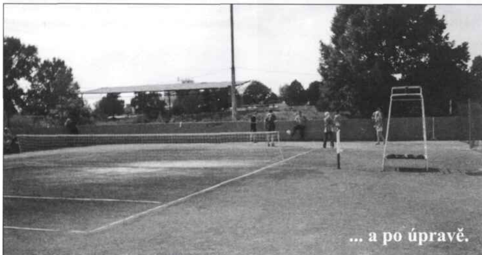
... a po úpravě.