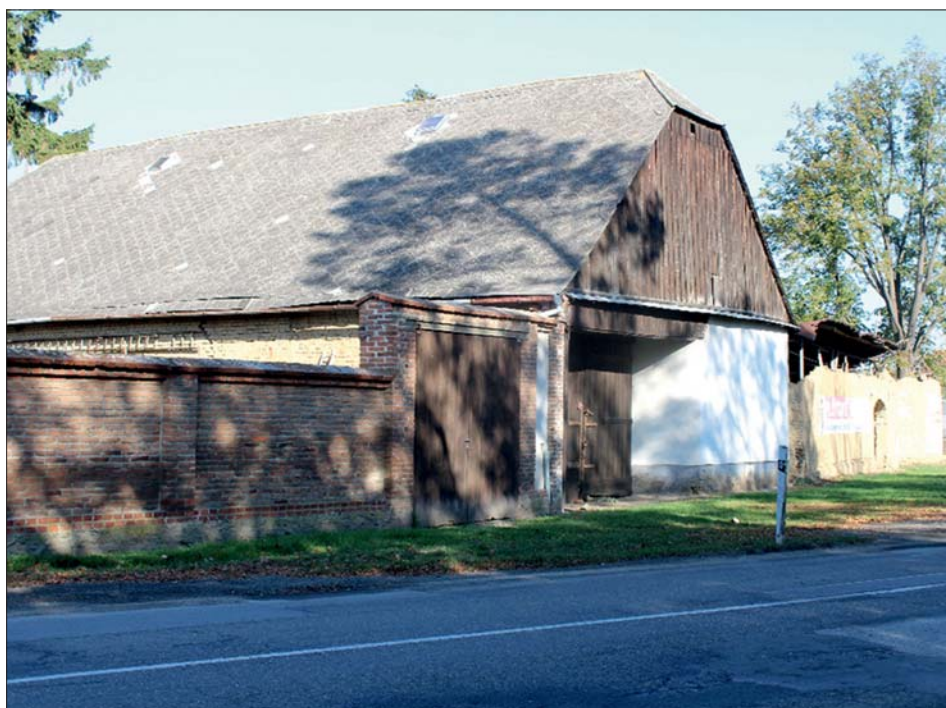
Stodola za statkem č. 11 na křižovatce „pod lipami“.