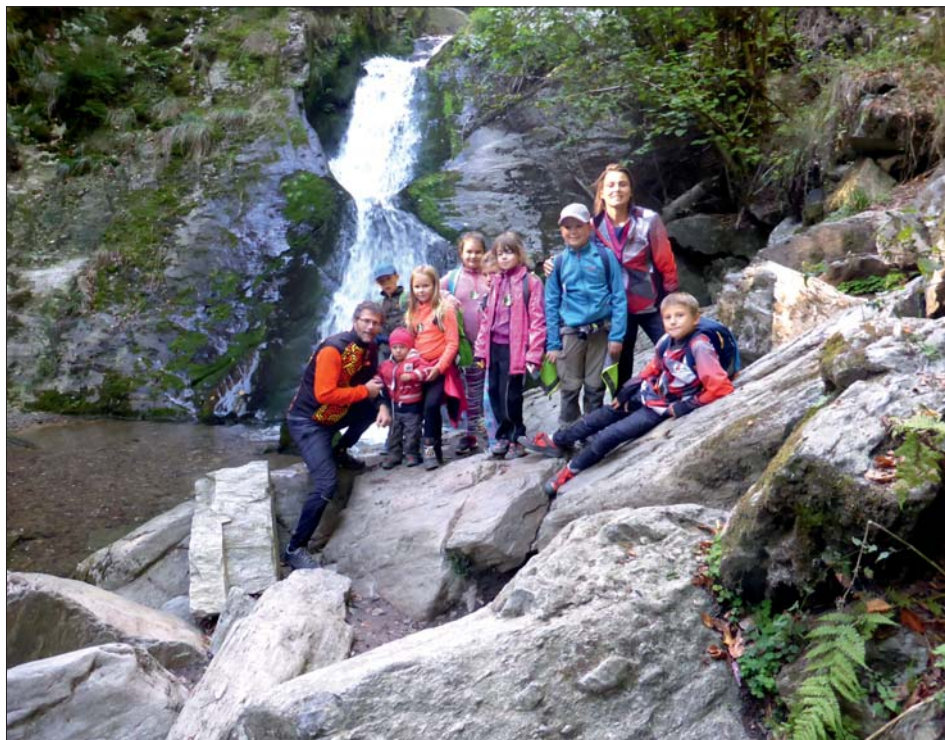
SPORTUR – první výlet na Rešovské vodopády.

Třetí naší podzimní novinkou je kurz „Hravá jóga“ pro děti ve věku 6 – 11 let.