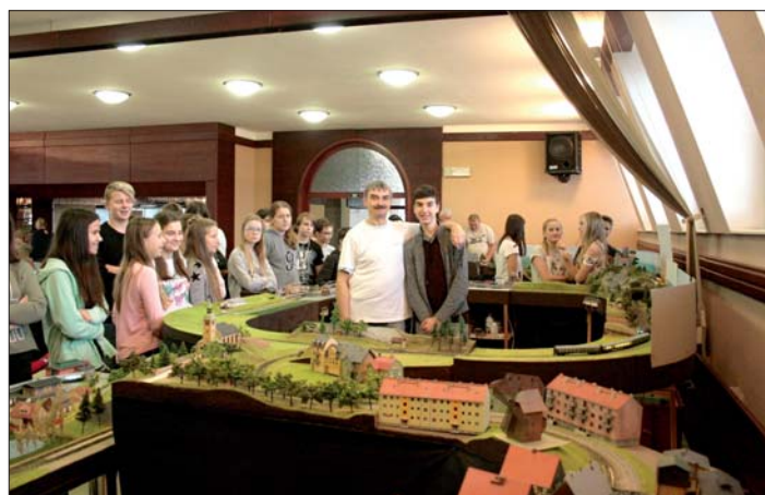
Loňskou výstavu obdivovali malí i velcí návštěvníci.