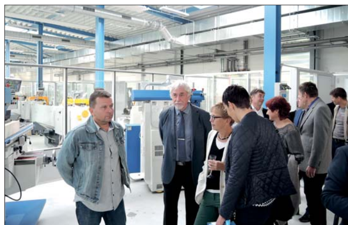
Prohlídka nového interiéru dílen.