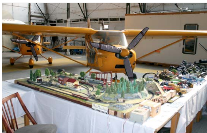
Modeláři mají chytré hlavy a šikovné ruce.