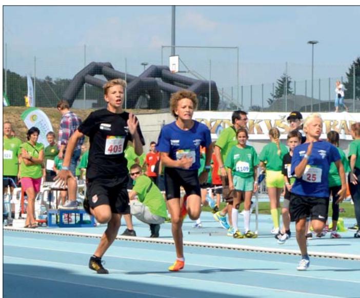
Závodníci bojovali s nasazením všech sil.