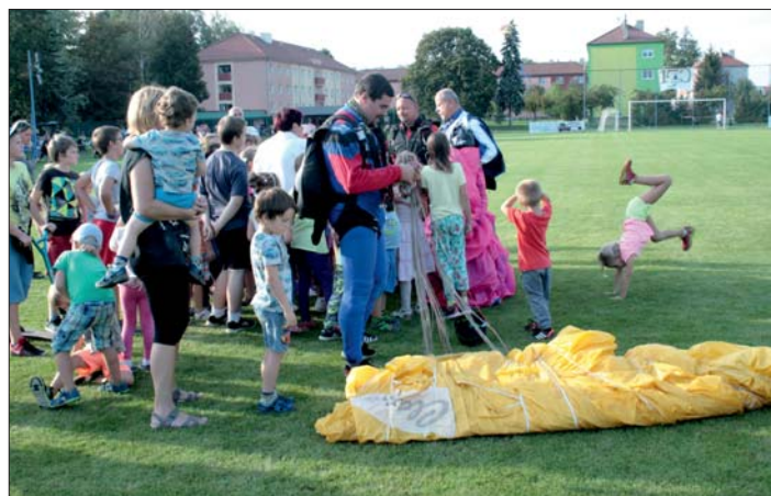
Šťastné přistání parašutistů.