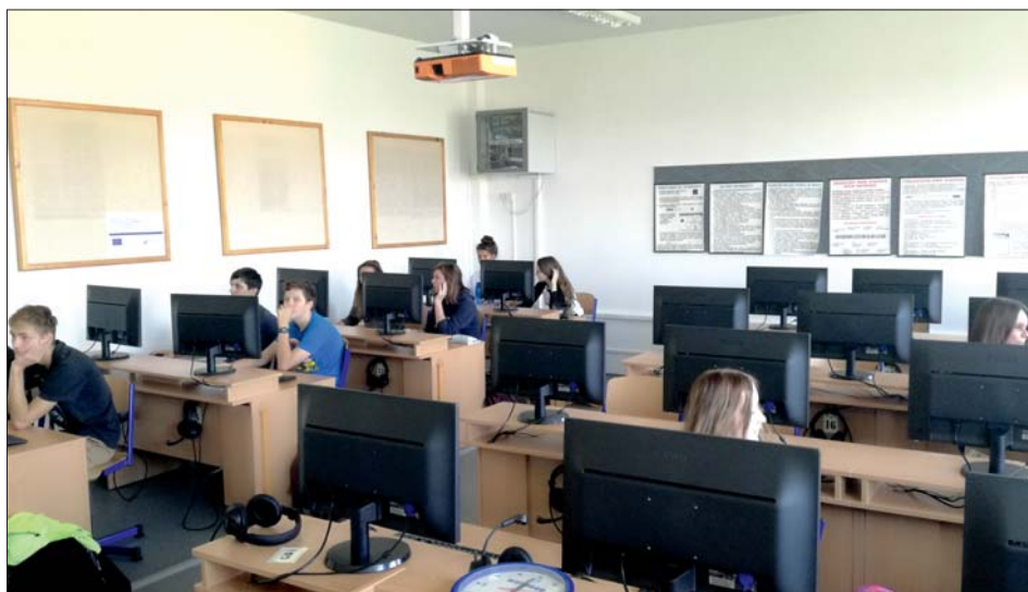
Nově vybavená jazyková a počítačová učebna.

Doba prázdnin je vždy dobou oprav a úprav. Ve školních budovách bylo i letos poměrně rušno. V budově základní školy proběhla rozsáhlá oprava sociálního zařízení v obou podlažích 1. stupně. Náklady se vyšplhaly téměř ke dvěma milionům korun.