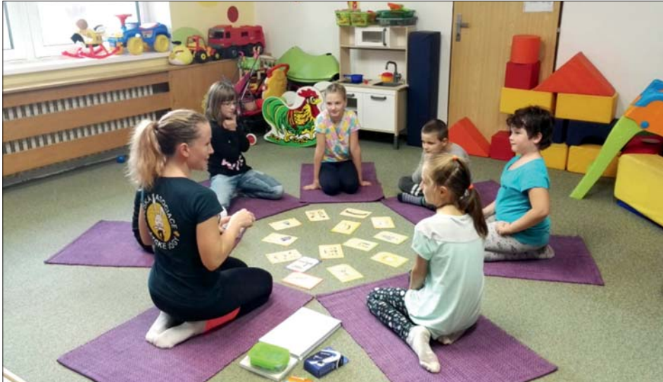
Hravá jóga – cesta ke zdraví a pohodě.