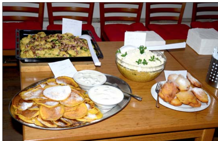
... byly dýňové pochoutky.