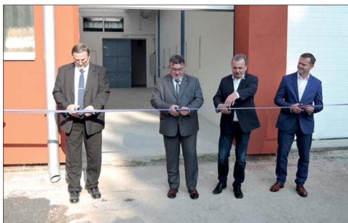
Slavnostní chvíle přestřižení pásy.