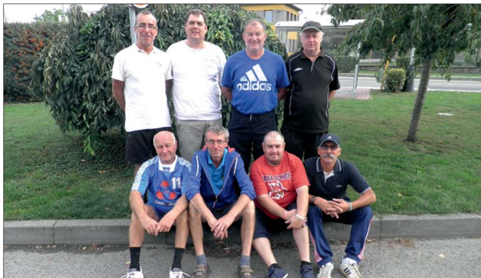
„Skalní“ hráči CULEK CUPU.