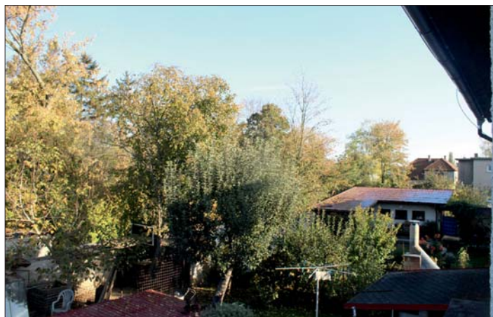
Ani lutínská zeleň není ušetřena zkázy.