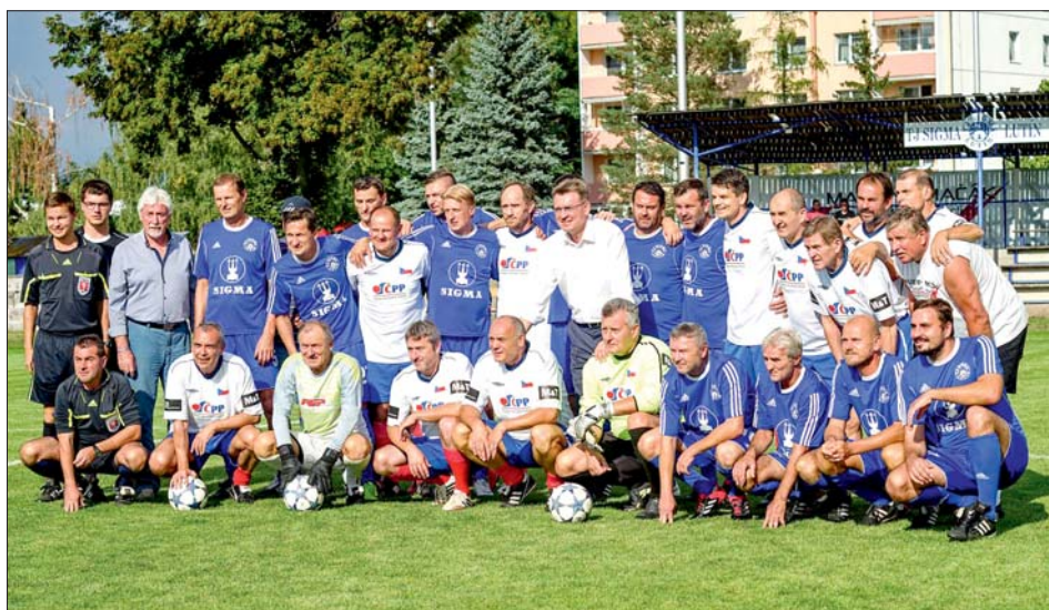
Všichni společně po „velké bitvě“.