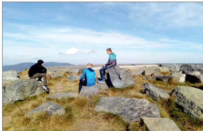
Z hráze nádrže je krásný výhled do okolí.