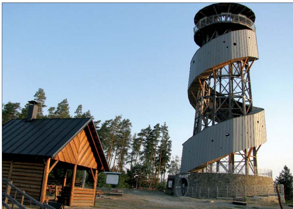
Opravená rozhledna znovu nabízí výhled do krajiny.

Po roce promarněném tahanicemi se začala rozhledna opravovat, aby mohla být opět dána do provozu. Stalo se tak 1. června 2018.