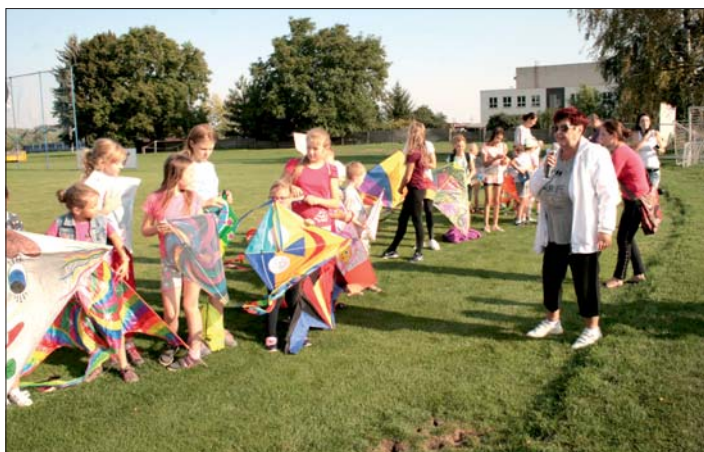
Nástup a poučení před „vzlétnutím“.

Pořadatelé děkují za účast a těší se na další ročník. Vladana Tomášková