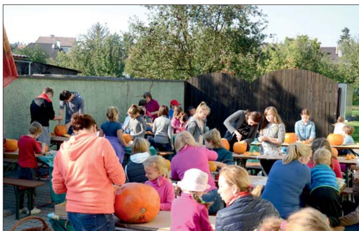
Odměnou za nápaditá díla ...