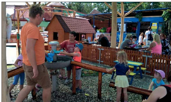
Odpocínek a osvěžení přišly vhod dětem i rodičům.