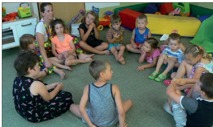
Před žhavým sluníčkem jsme se schovali v chládku klubovny.