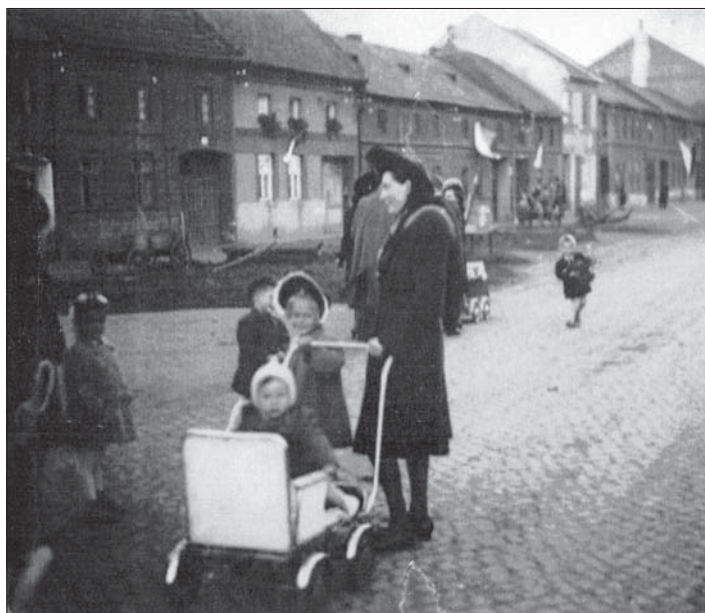
V roce 1945 - první poválečná oslava vzniku ČSR.