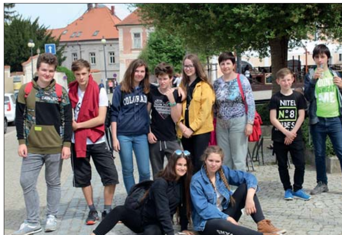
Skupina je připravena „zdolávat“ památky města.