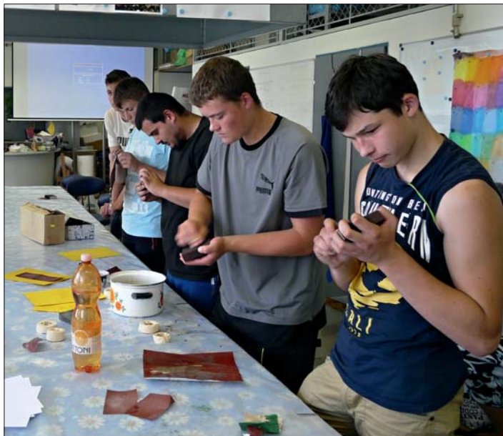
Vlastní pokusy v Technickém muzeu.