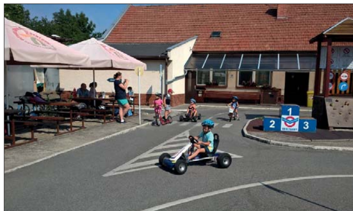
Malí „motoristé“ vyzkoušeli všechno, co mělo kola.