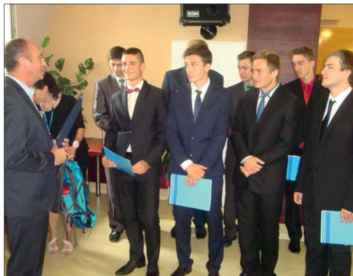
Něco krásného končí, něco nového začíná .