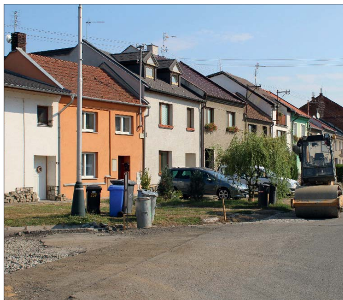
Ulice Na Zábrani dnes.