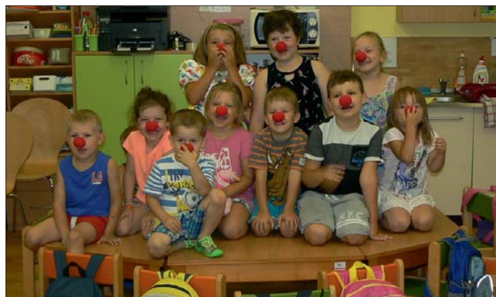
V žádném cirkusu nesmí chybět klaun.