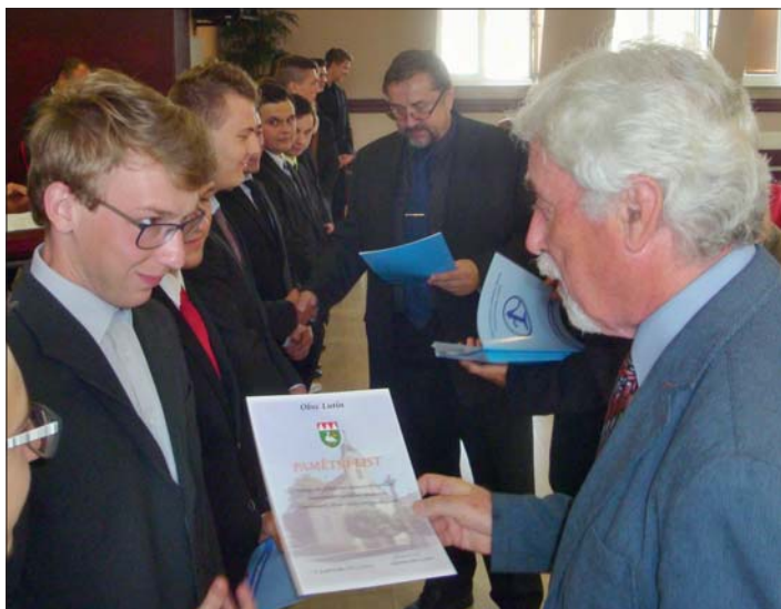
Předávání Pamětních listů obce Lutín...