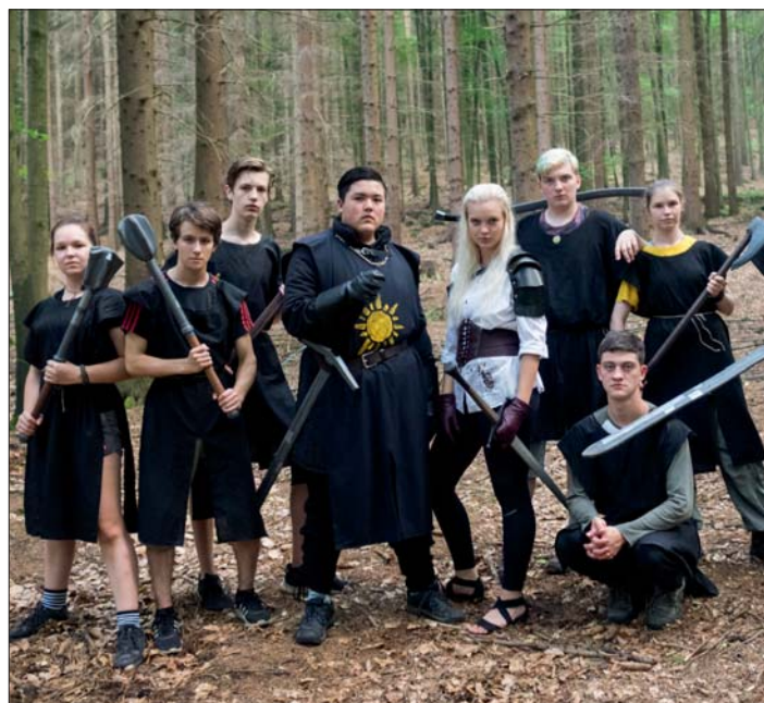
Před závěrečnou bitvou Zaklínačů s nepřítelem.