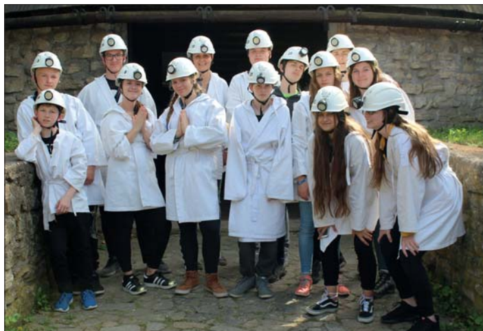
Najdeme novou „stříbrou žílu“?