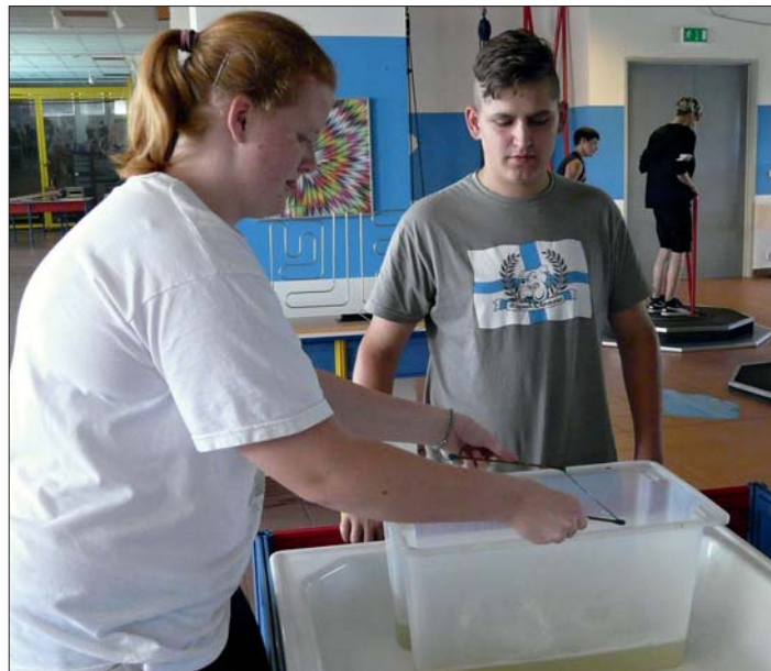
V dílně pro odlévání a čištění kovů.