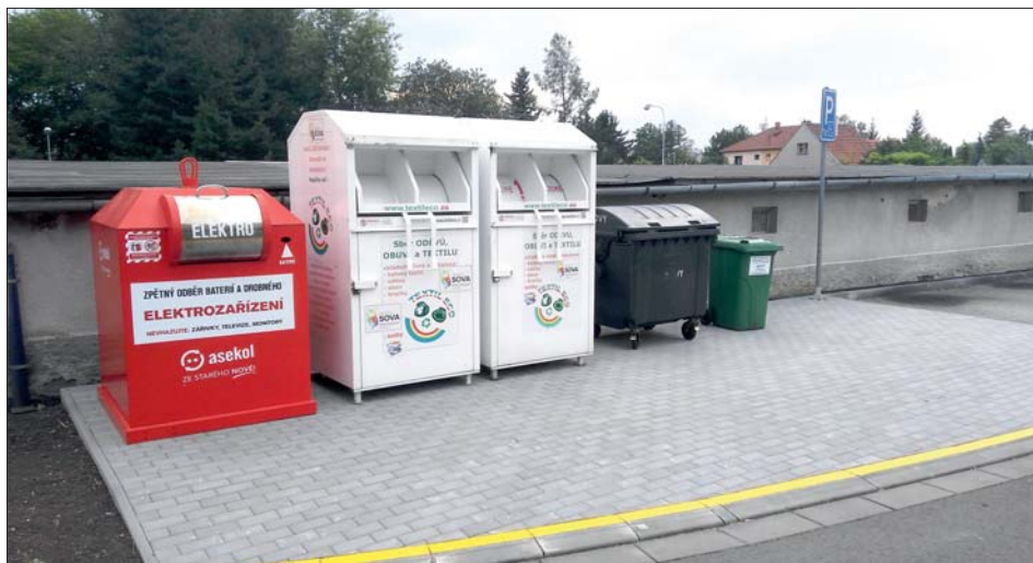
Nové stanoviště u garáží na sídlišti.