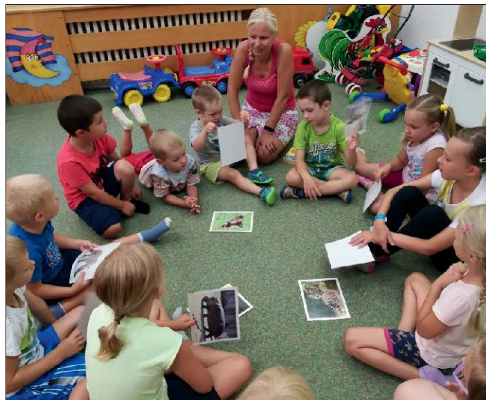
Poznáváme živou přírodu.