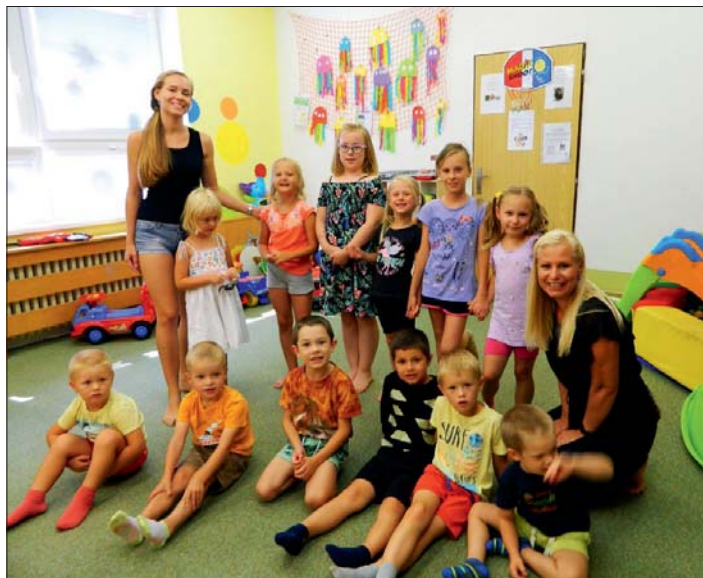
Těšíme se na „zvířátkový“ program.