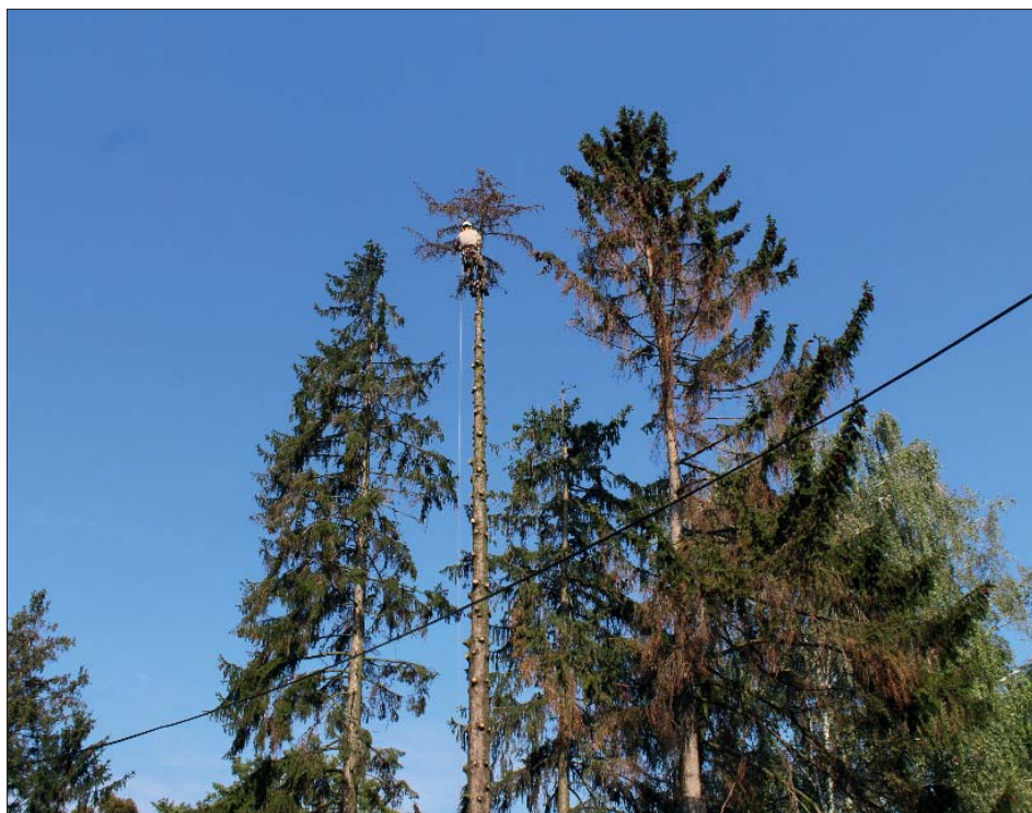
Kácení „nemocných“ smrků není žádná legrace.