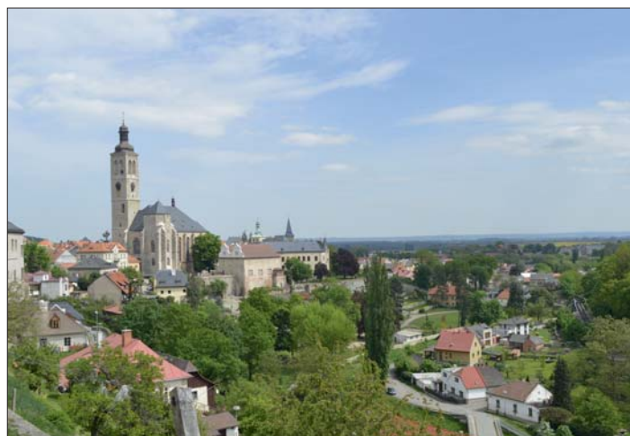
Výhled z rozhledny na město byl úchvatný.