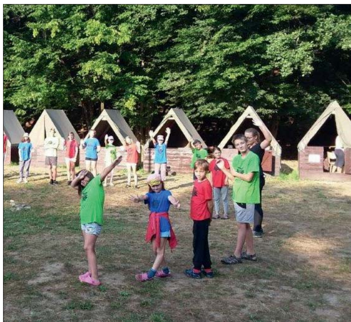
Ráno tělo do pohybu dáme...