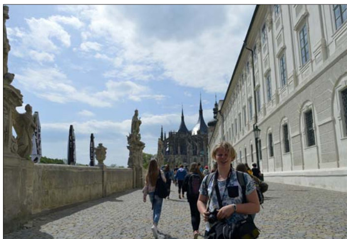
Na cestě ke katedrále svaté Barbory.

„Kostnice je podzemní kapli hřbitovního kostela Všech svatých. Působila na mě tajuplným dojmem. Spousta kostí a lebek je uspořádána do zajímavých tvarů – šlechtického erbu rodu Schwarzenbergů, pyramidy, ozdobného stropu či lustru.“