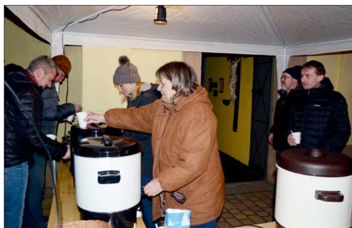
Návštěvníci nepohrdli dobrým čajem.