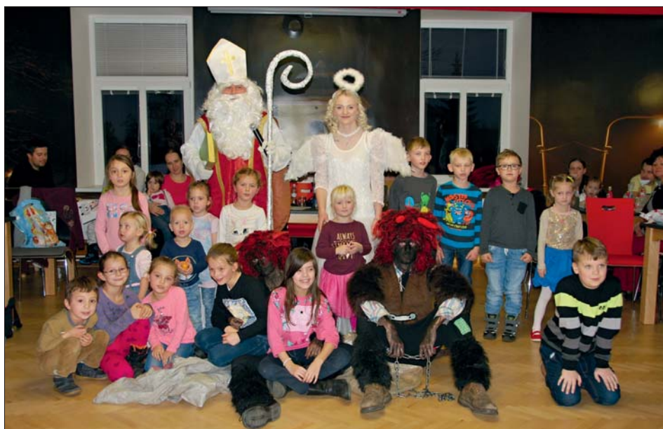
Mikuláš a anděl měli dárky pro všechny.

Poděkování patří všem, kdo se podíleli na organizaci všech akcí, připravili a zorganizovali vše potřebné, postarali se o program a občerstvení. Odměnou jim bylo potěšení z hojné účasti.