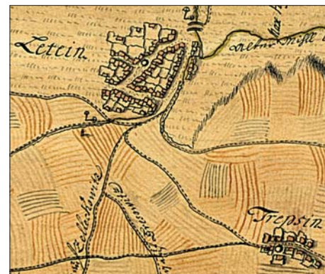
Výřez z mapy nadporučíka Fleischmanna.