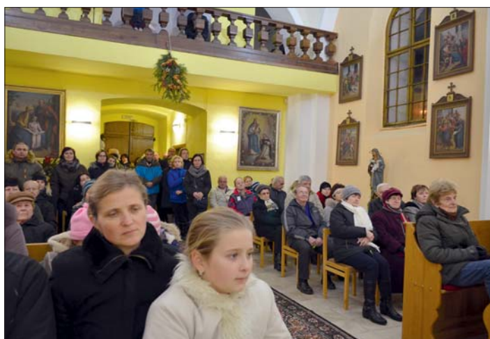
Návštěvníky koncertu neodradilo ani sychravé počasí a chlad.