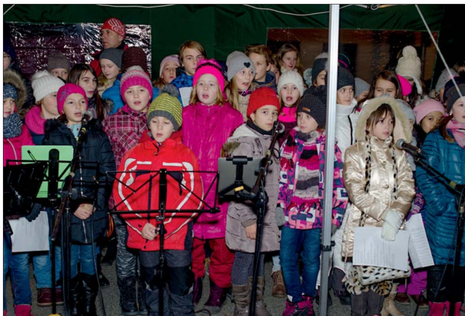
Na kulturním programu se podíleli učitelé a žáci základní školy.