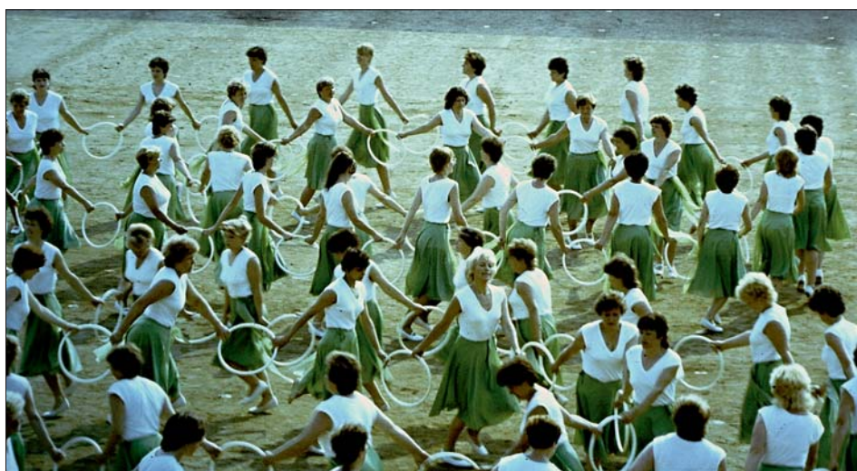
Místní spartakiáda v Lutíně.