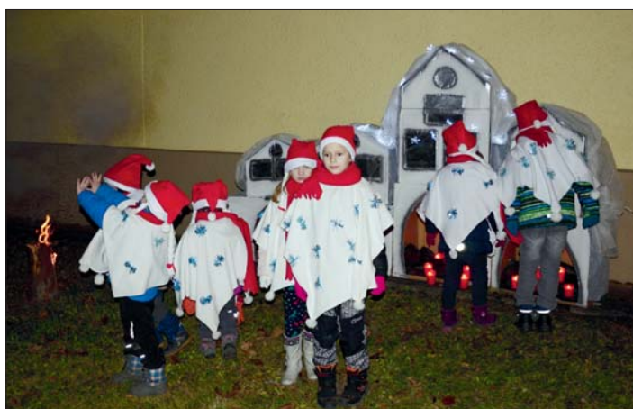
Vystoupení dětí ocenili všichni diváci.