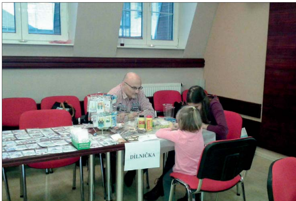
Dílničku navštívili rodiče i děti.