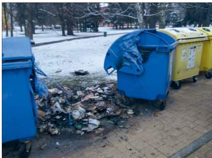
Takovou spoušť viděli občané Lutína v ulici Jana Sigmunda ve středu 20. prosince ráno.