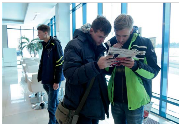
Zajímavé byly i prospekty a katalogy firmy.