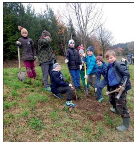
Ve Hvozdě sázeli školáci.