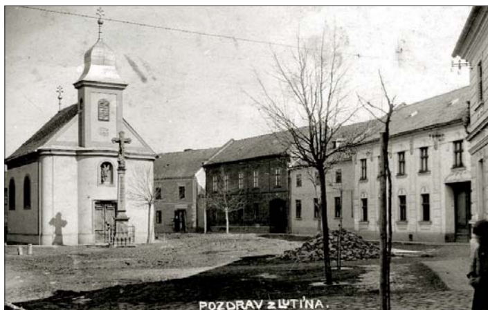
Lutínská „náves“ v roce 1930...