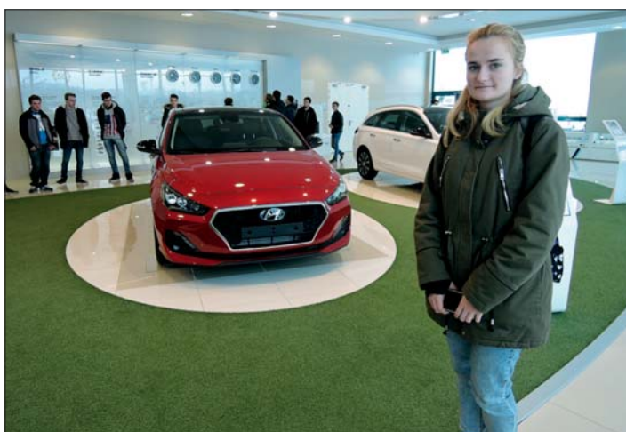
Na exkurzi ve firmě Hyundai.