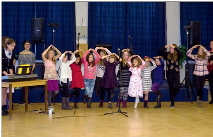
Pěkný kulturní program předvedly žákyně základní školy.