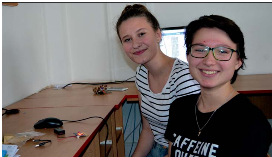
Práce na projektu byla nová a zajímavá