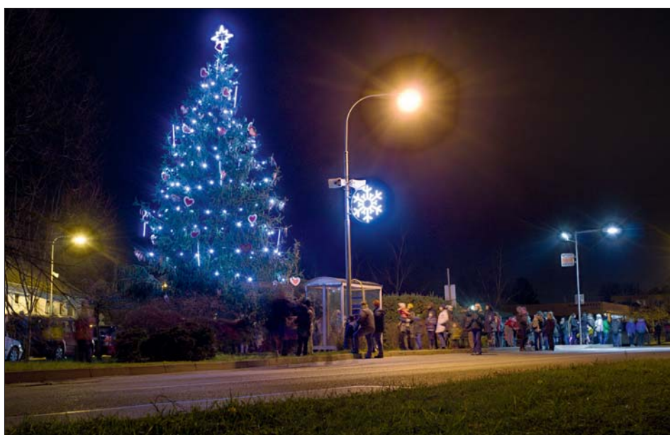
Vánoční strom ozdobily děti červenými srdíčky.

Na velký dřevěný stromek mohl každý, kdo přišel, přilepit srdíčko se svým jménem a přáním. Kdo chtěl, mohl své přání napsat Ježíškovi, zazvonit si na zvoneček pro štěstí nebo zazpívat spolu s duem Jirka Štěpánek a Roman