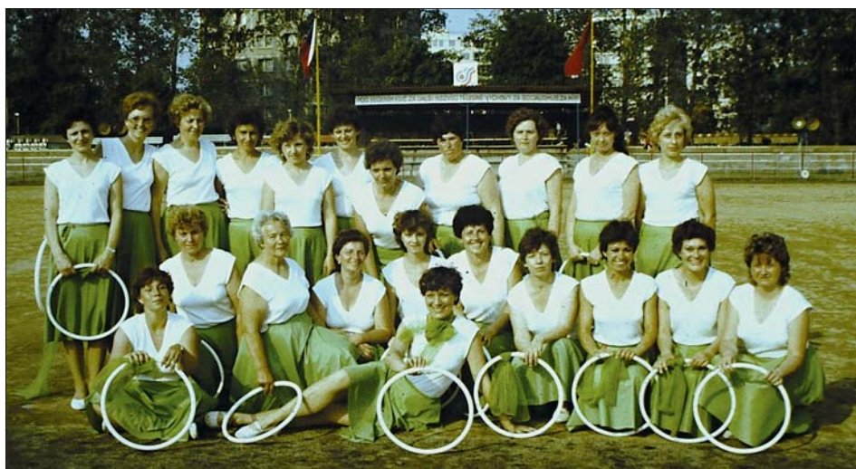
Celá „jednotka“ před vystoupením.