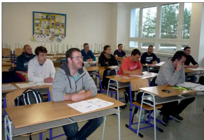
V teoretické i praktické přípravě uspěli všichni účastníci kurzu (na snímku vpravo vpředu lektori).