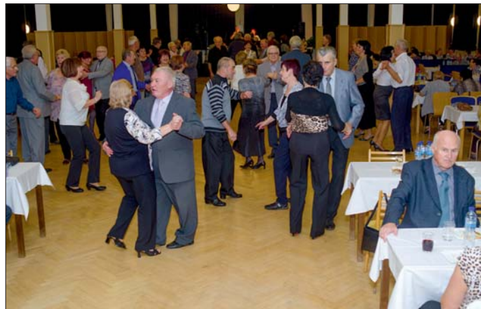
Taneční parket byl stále plný.