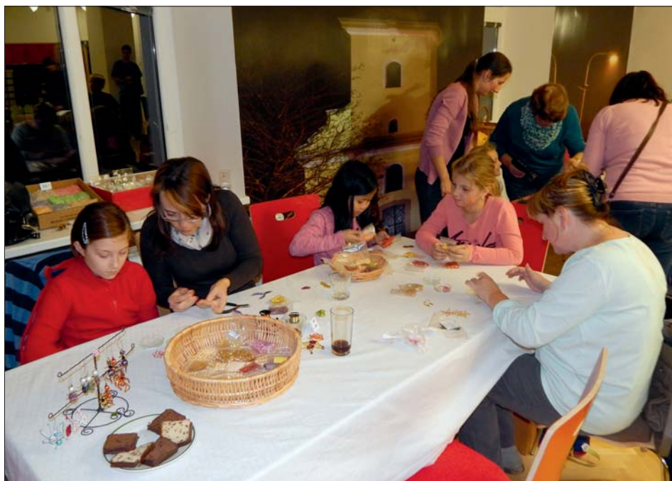
Třetí adventní neděle byla ve znamení příprav na Vánoce.