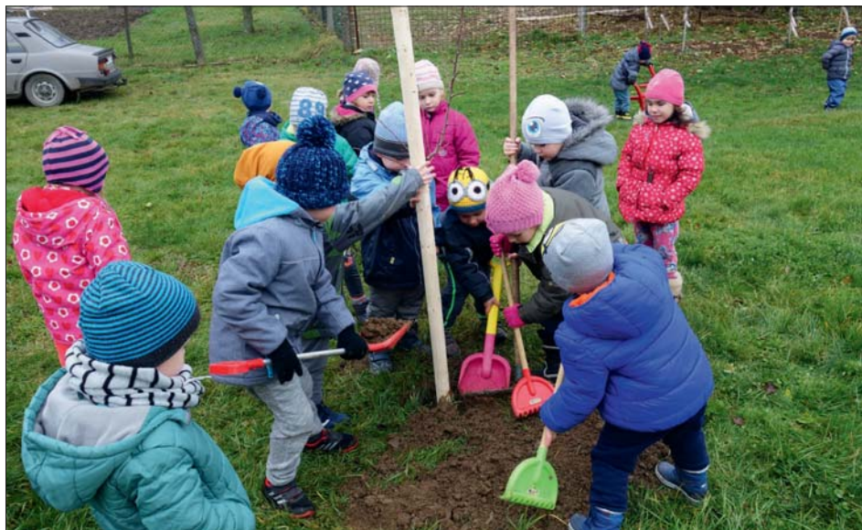
Malí „sadaři“ z mateřské školy v Rakové.

Podobný tým v ORP Prostějov organizoval na podzim stejnou aktivitu a zúčastnily se základní a mateřské školy