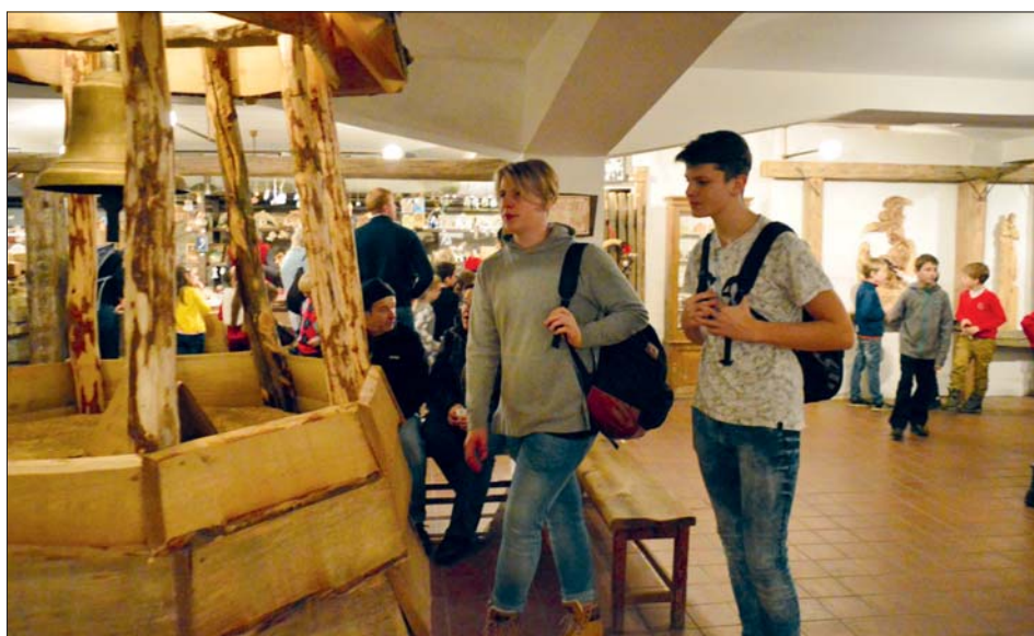
Na zajímavé výstavě betlémů.