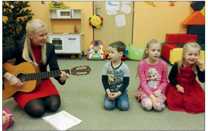
Malí hudebníci zpívali rodičům.