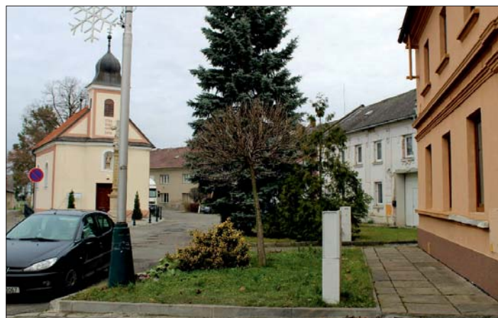
... a dnes.