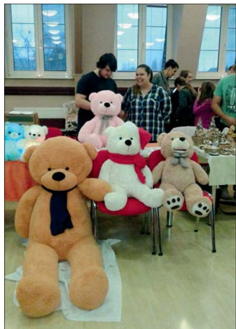
Medvídci na jarmarku čekají na „své“ nové kamarády.

/pedig = vnitřní část stonku ratanové liány (ratan); dováží se z tropů jihovýchodní Asie a slouží k výrobě košíků, bičů, nábytku i hudebních nástrojů/