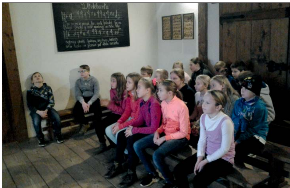
Žáci sledují ukázkou výroby inkoustu.

Ke konci exkurze jsme si ještě stihli prohlédnout velkou sbírku minerálů a sbírku motýlů a hmyzu. Pro zpestření programu nás ještě paní průvodkyně zavedla na vysokou věž, kde má muzeum uchovány vel-