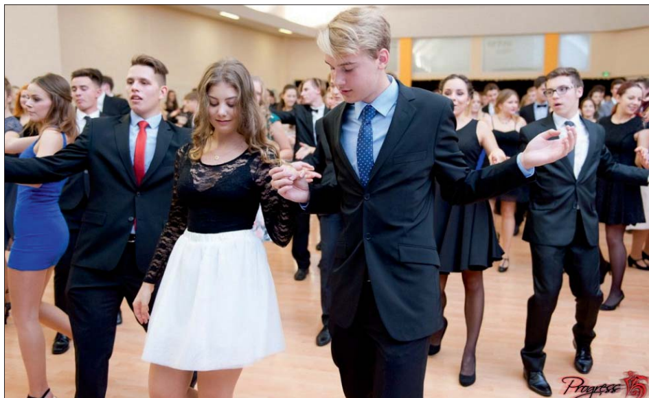
Po překonání počátečních rozpaků zvládli všichni tanec i pravidla společenského chování.