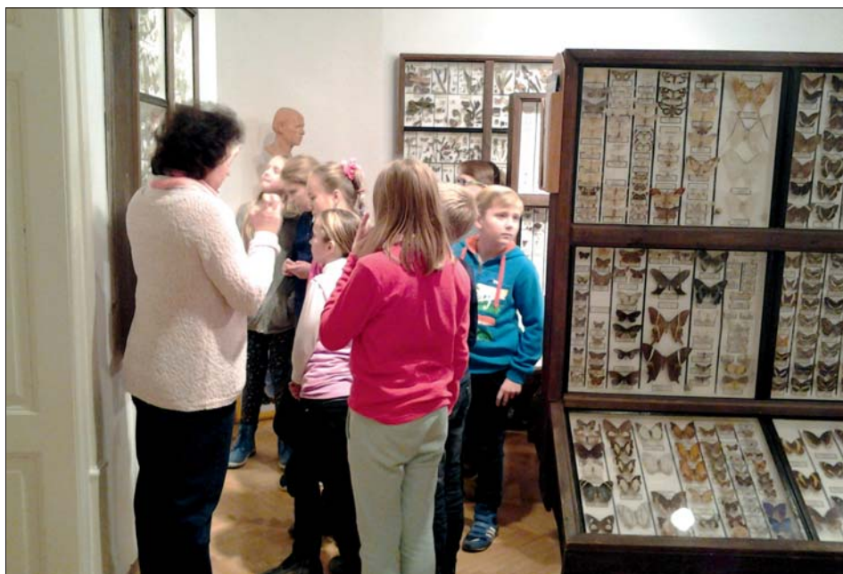
Prohlídka sbírek minerálů a hmyzu.

Hned u vchodu nás uvítaly dvě velmi milé průvodkyně a poté jsme se rozdělili do dvou skupin. Naši třídu odvedla první průvodkyně „do pravěku“. Naprostou tmou jsme vešli do jeskyně. Před námi se náhle zjevila hrobka pravěkých lidí. Poznávali jsme rostliny, které prý už rostly v době kamenné. Mohli jsme si ohmatat části kostí mamuta a prozkoumat i obrovskou mamutí stoličku. Rozdělili jsme se