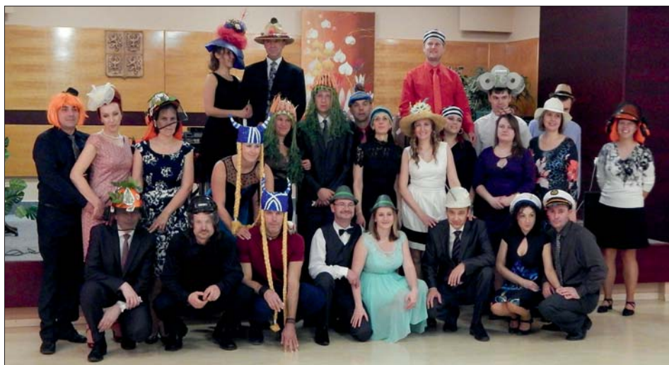
Přehlídka pokrývek hlavy svědčila o nápaditosti tanečníků.

Jak dokazuje snímek, všichni účastníci tento úkol pojali velmi kreativně.