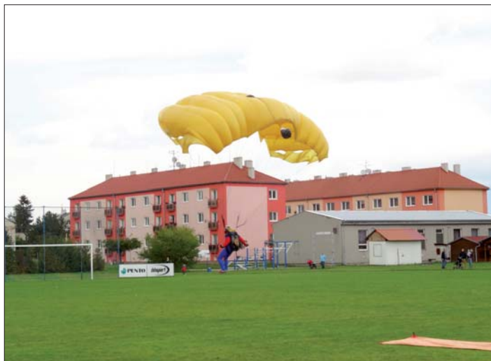
Ukázka seskoku parašutistů.