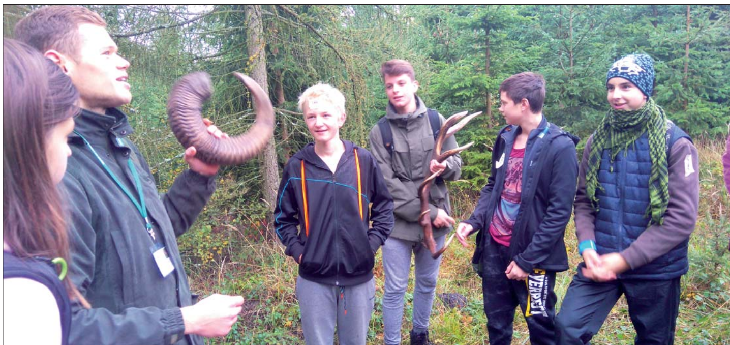
Enviromentální výchova nás učí poznávat a chránit přírodu.