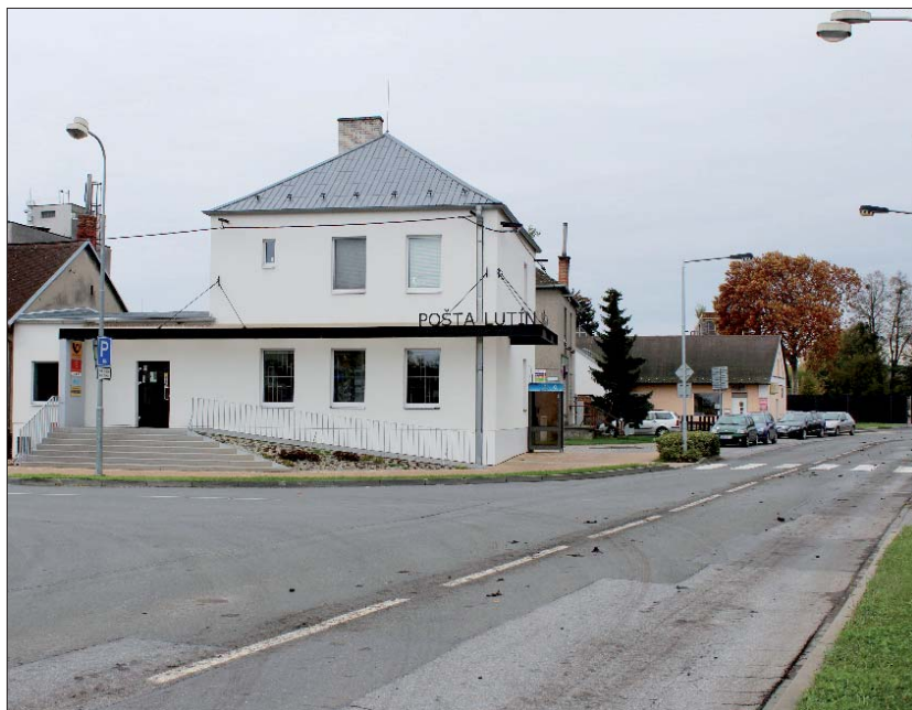
Od jara 2017.