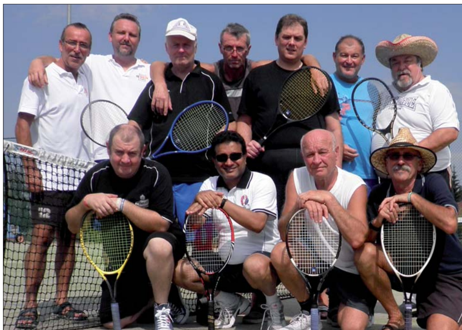
Sportem ku zdraví v každém věku!