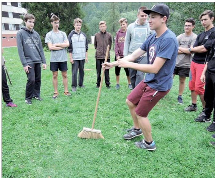
K programu adaptačních kurzů patří hry i sport.