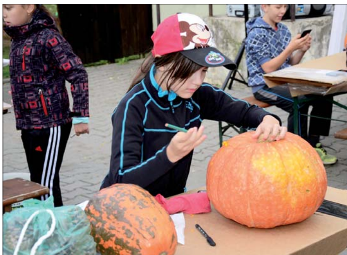
Nápady řezbářů a jejich umění se stále zlepšují.