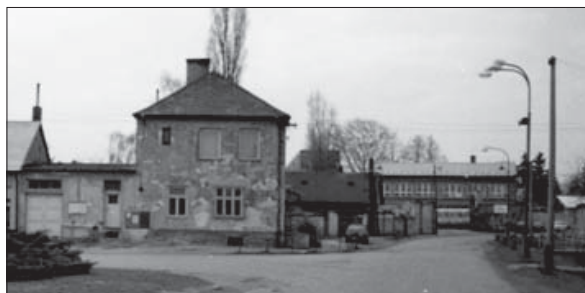
Pošta v Lutíně do první rekonstrukce.