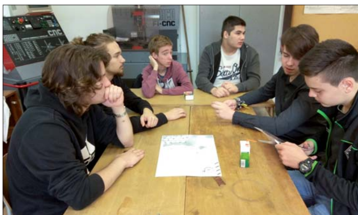
Pracovní skupiny se radí a zpracovávají úkoly.