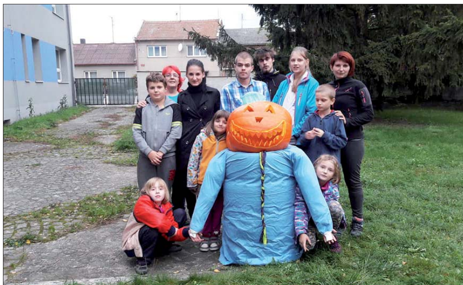
„Dýňák“ je náš podzimní kamarád.