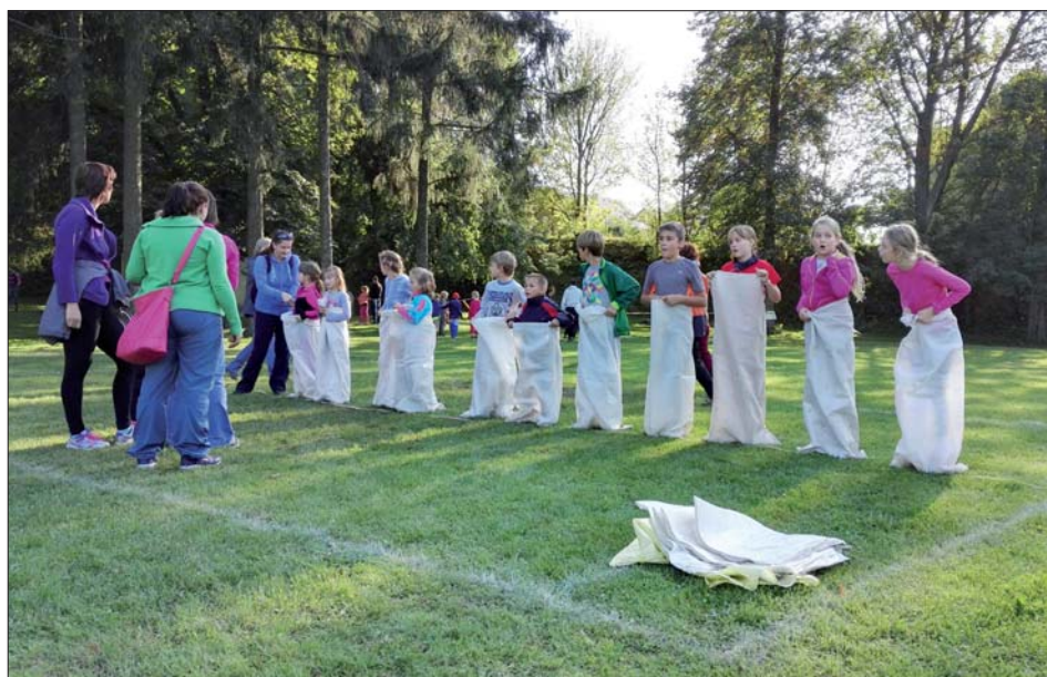
Jednou z mnoha soutěží byly skoky v pytli.