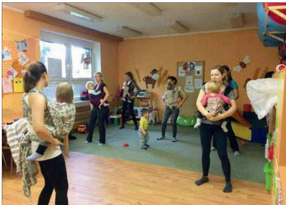
Nošení v šátku se dětem líbí.

Druhá aktivita – „Jógahrátky“ je určena pro rodiče s dětmi ve věku 2-3 let, kteří chtějí aktivně a příjemně trávit čas se svými dětmi, naučit se cvičit jógu a přitom relaxovat tělo i mysl.