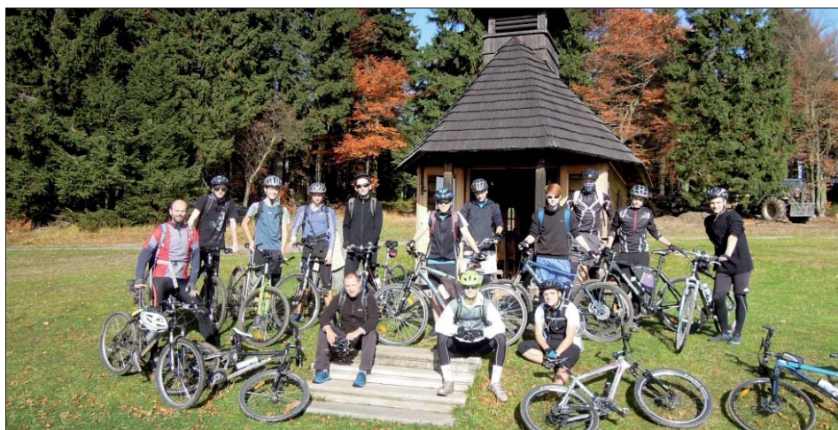
Po náročném výstupu si zasloužíme odpočinek.

Vyjeli jsme na Smrk, před tím pobýli v „Báru“ (lesním!). Jedna skupina