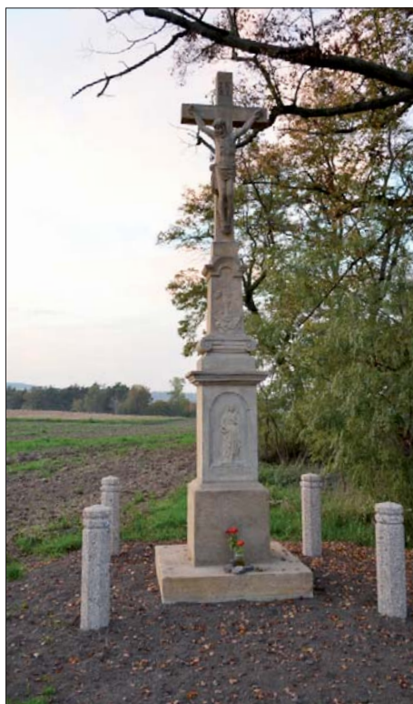
... a po letošní opravě.