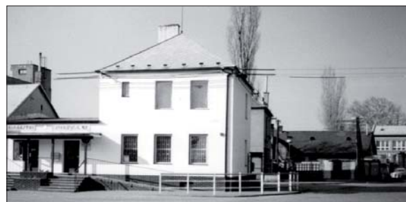
Po rekonstrukci před 26 lety.