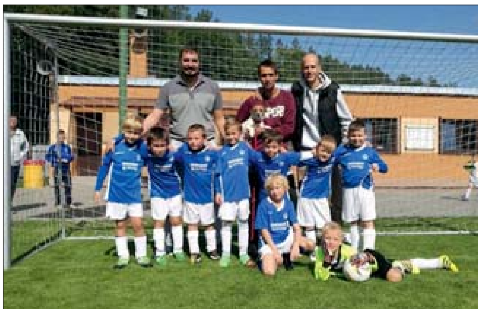
Naše „fotbalové naděje“ hrají s chutí a zápalem.