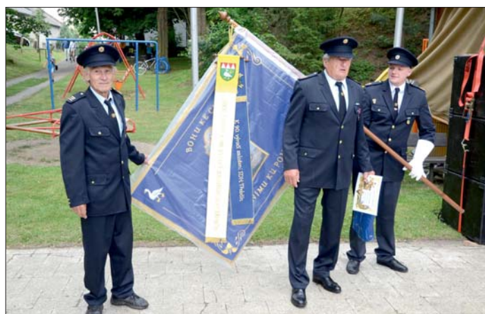
Čestná stráž a vyznamenaný člen SDH u nového praporu.