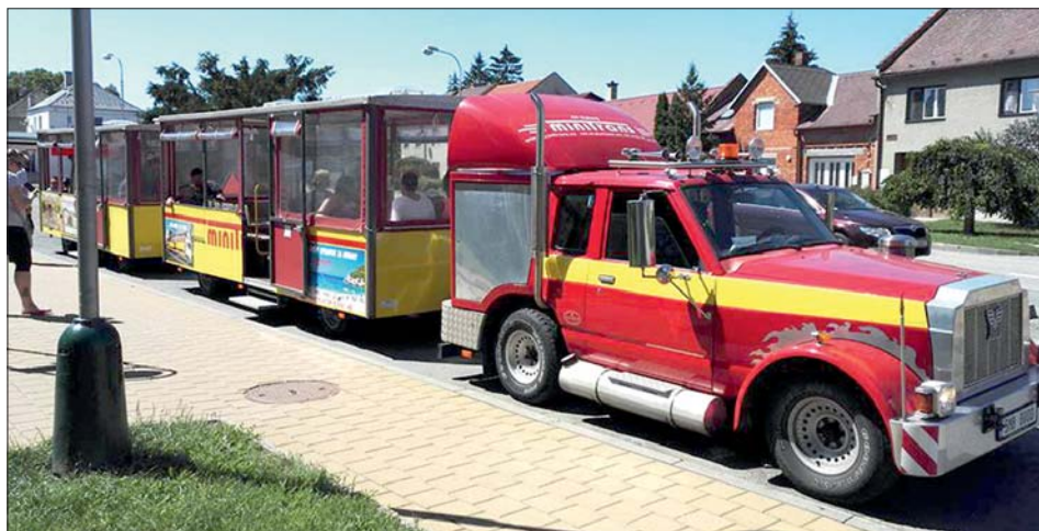
Turistický vláček je připravený k odjezdu.

Děkujeme obci Lutín za příspěvek pro realizaci výletu. Lucie Migalová