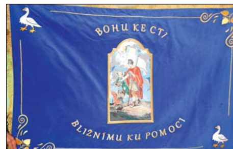
Líc a rub nového praporu Sboru dobrovolných hasičů Třebčín.