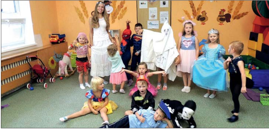
Poslední den tábora byl „superpohádkový“.