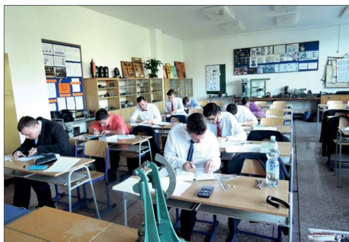
Třída OK 3. (obráběči kovů) při závěrečné písemné zkoušce.