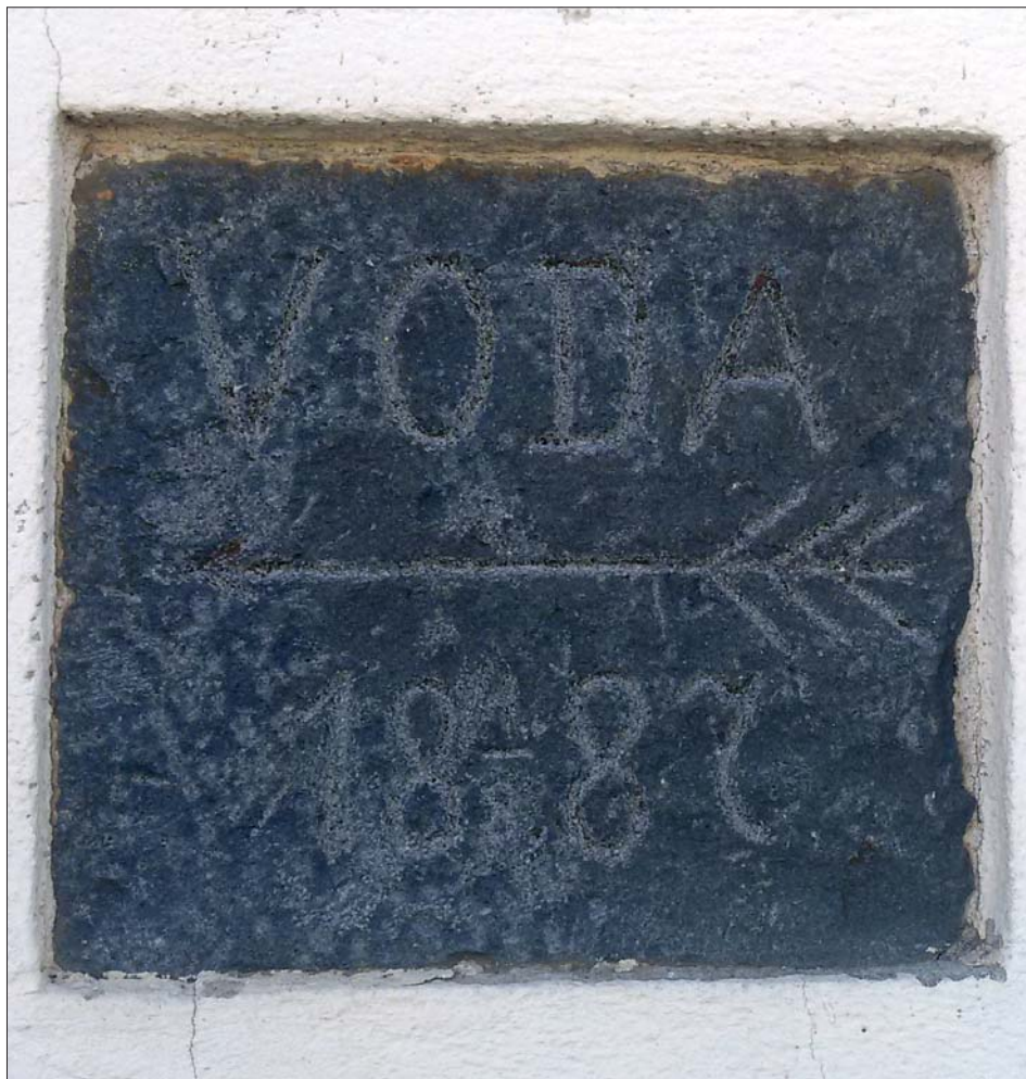
Svědectvím výšky povodňové vlny v Lutíně je deska na domě čp. 1 na Školní ulici (vpravo vedle staré budovy základní školy).