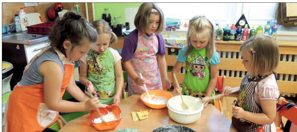
Sami si upečeme, sami si sníme!

Děti si celý týden užívaly hry, soutěže, písničky, hádanky, tvoření a malování ve společnosti pohádkových postavíček. Přišel se za námi podívat Ferda mravenec a tak moc se nám líbil, že jsme chtěli vypadat jako on, a tak jsme si vyrobili jeho masku. No a jak třeba pomoci princezně Zlatovlásce? My jsme jí šli posbírat korálky... a našli jsme všechny. Když za námi zavítala ježibaba z Perníkové chaloupky, ptala se, jestli jsme jí nevzali perníčky, ale my jsme si je sami upekli, nazdobili a pak