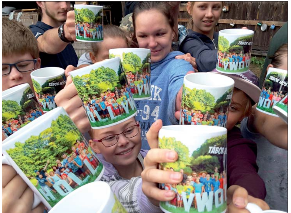
Každý má svůj vlastní „táborový hrneček“.

Na závěr jsme je vrátili rodičům, s úsměvem na tvářích jsme se s nimi rozloučili a popřáli štěstí do nového školního roku. A jestli chcete zažít podobné věci, přijďte k nám