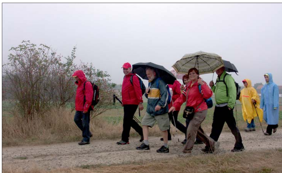
Loňský podzimní zájezd do Jaroměřic nad Rokytnou turistům pěkně „propršel“.