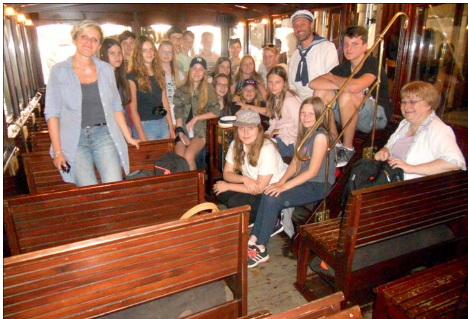
Plavba lodí po Vltavě byla příjemným zpestřením naší zastávky v Praze.

V saloncích se v průběhu let procházely „hlavy státu“, počínaje naším prvním prezidentem T. G. Masarykem. V blízké době (v červnu) má tohle místo navštívit rakouský prezident.