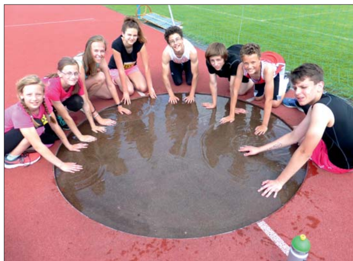
Příjemné ochlazení po „horkém“ boji?

v Hranicích jsme se také „neztratili“. Tentokrát nás čekal šestiboj. Počasí nezklamalo, takže i „kilák“ se běžel. I dalších pět disciplín – běh na 60m, skok daleký, hod míčkem, skoky přes švihadlo a shyby na šikmé lavičce, popř. ještě dribling jako varianta k běhu na 1 km – se snažili závodníci plnit na maximum svých sil.