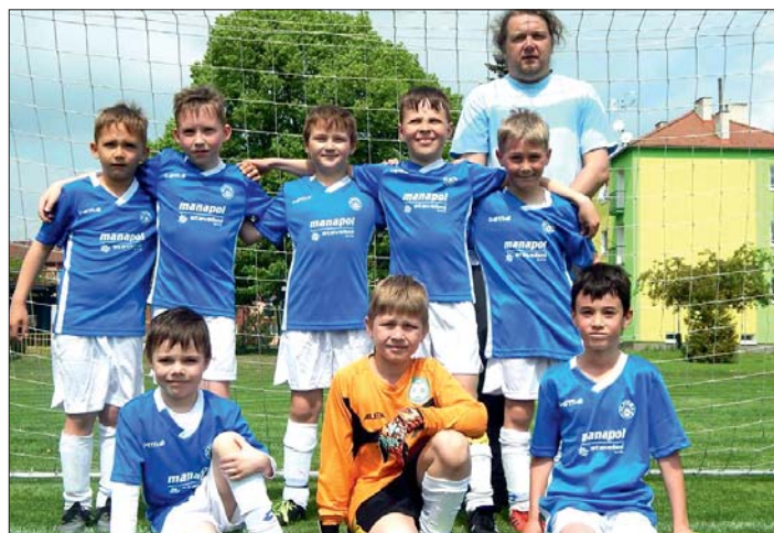
Na kluky z přípravy už čekají zkušení trenéři.