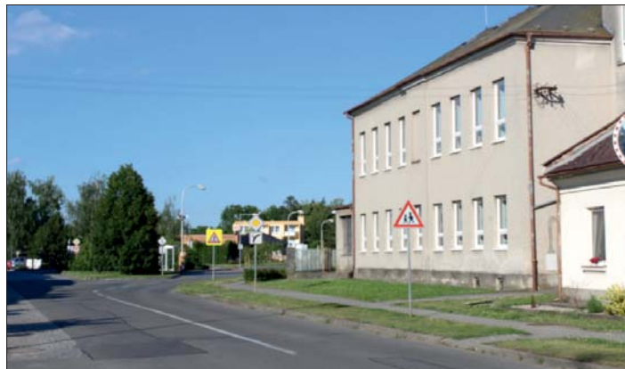
Rok 2017 - současnost.