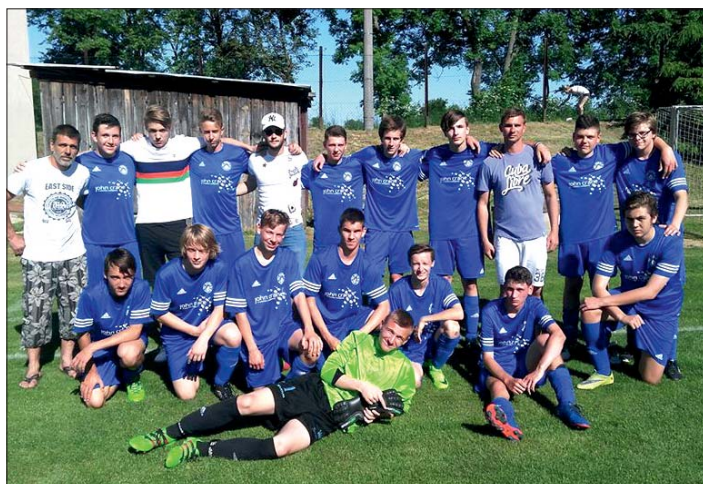
Dorost bude dál hrát spolu s SK Slatinice.