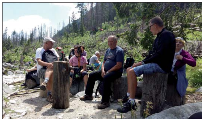
Odpočinek při výstupu na Štrbské pleso.