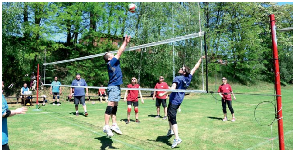
Hráči bojovali s nasazením všech sil.

Volejbal je stále oblíbeným sportem, který přináší radost všem. Celodenní sportovní klání, které se hrálo na travnaté ploše, přineslo mnoho zajímavých