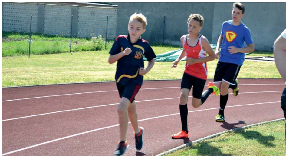
Domácí závodníci slavili „atletické žně“.