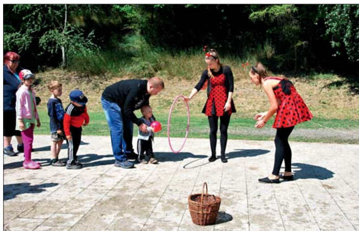
Do soutěží a her se zapojili i rodiče.