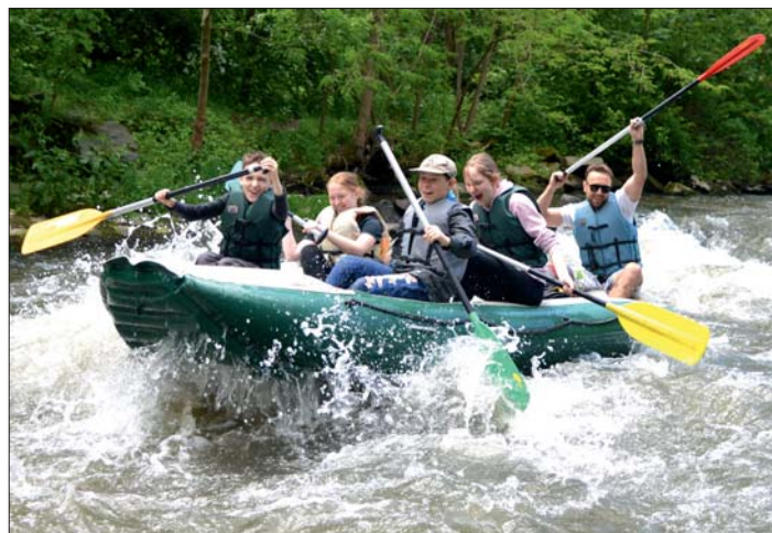
„Raftáči“ v akci.