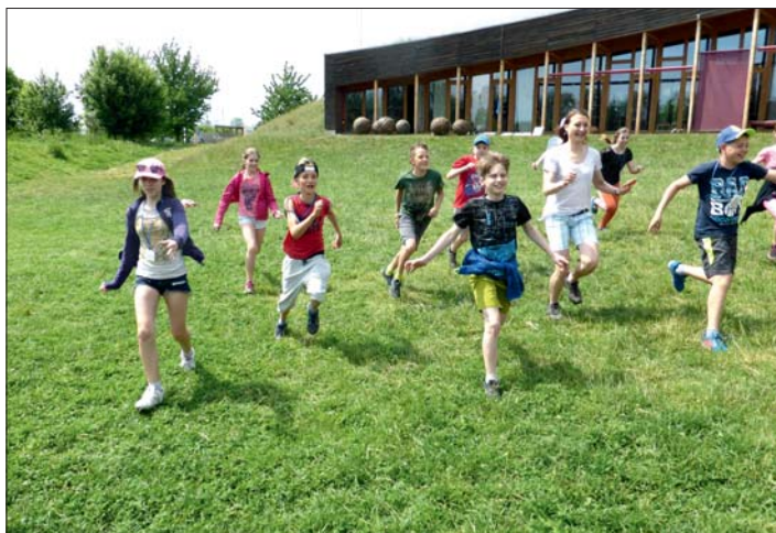
Pohybem ke zdraví!

Náplní pobytu na škole v přírodě byl vzdělávací program. I ten byl velmi zajímavý a okouzlil nás hned od začátku.