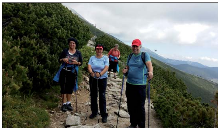
Výstup k Popradskému plesu.

Odbor turistiky TJ pořádá každoročně na jaře několikadenní zájezd do různých koutů Čech a Moravy. Letos vyrazili jeho členové a další příznivci turistiky do „ciziny“ a od neděle 18. do pátku 23. června poznávali za slunečného letního počasí krásy slovenských Vysokých Tater.