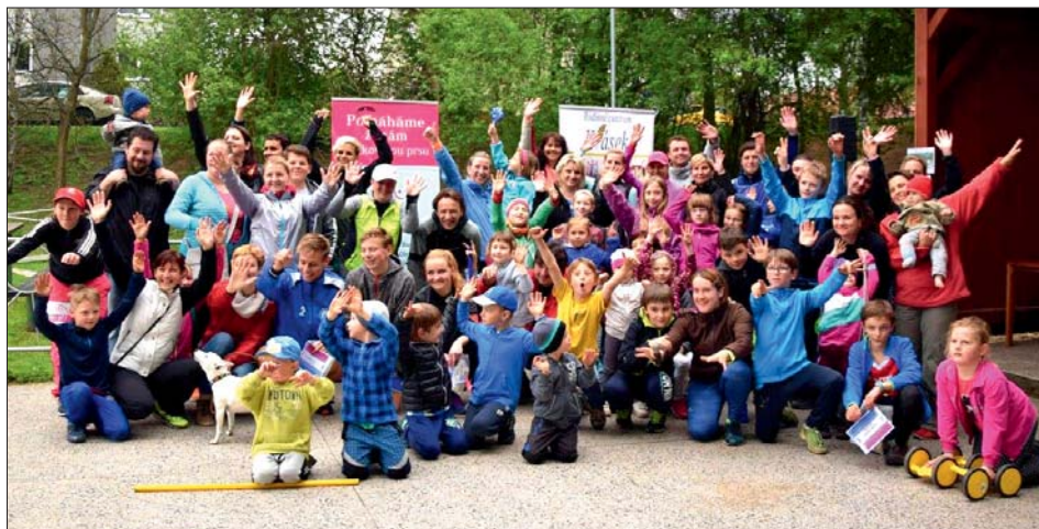
Běh pro dobrou věc doprovázelo pěkné počasí a veselá nálada.

Letos nám víc přálo počasí, a tak jsme rádi, že také účast byla větší než v loňském roce. Dětských běhů se zúčastnilo celkem 55 dětí, na hlavních tratích běželo 86 závodníků.