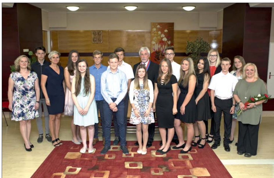
Společně se starostou obce a ředitelkou školy.

Slavnostní setkání se starostou obce organizuje Sbor pro občanské záležitosti a jsou zváni i rodiče oceněných. Určitě i pro ně bylo setkání velice příjemné, vždyť mají také nemalý podíl na skvělých výsledcích svých dětí.