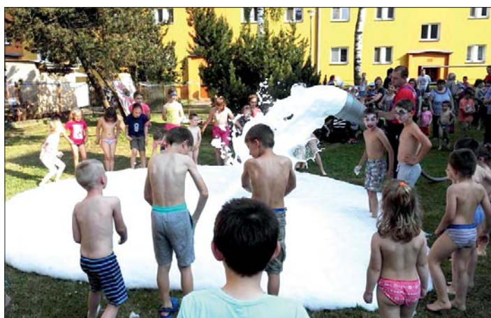
Pěnový „bazén“ byl dárek třebčinských hasičů.

(psí agility = sport se psem, pozn. red.)