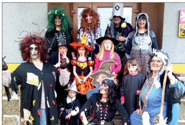
Malé i velké čarodějnice z Lutína.