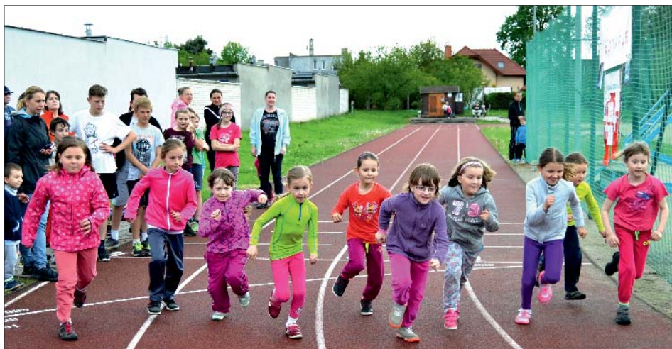
V běhu na 200 metrů závodí dívky.