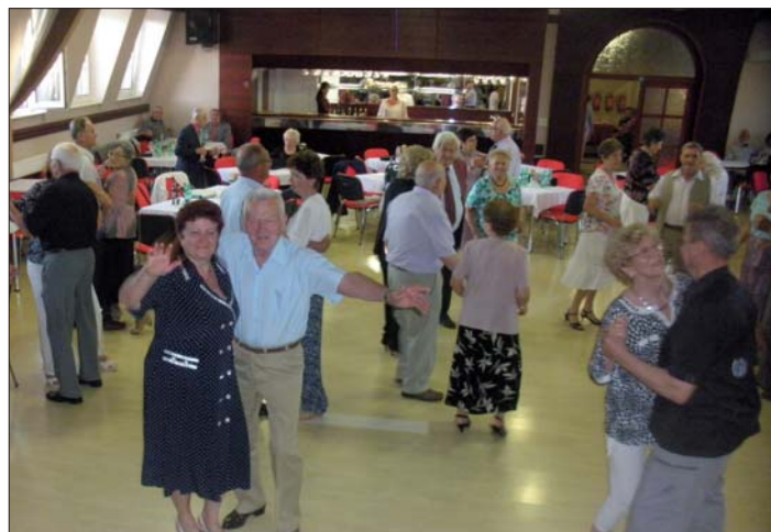
Hosty neodradilo ani horké počasí.

Pořadatelé děkují všem, kdo se navzdory horkému počasí přišli pobavit, a zvou milovníky tance na kateřinskou