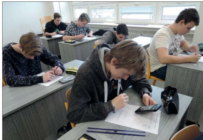
A teď už každý sám!