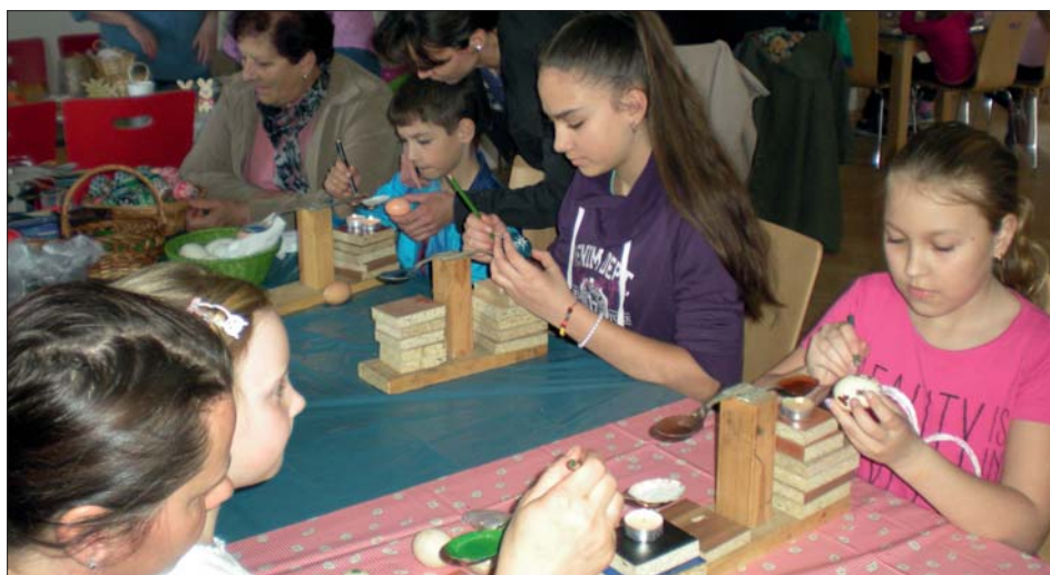
Zdobení kraslic si vyzkoušely i šikovné děti.