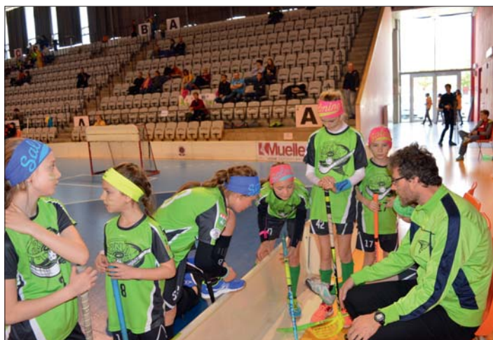
Chvilka pro oddech a poradu.