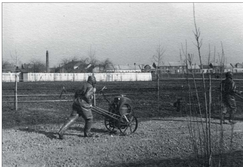
Pohled na cvičení ženského dobrovolného ochranného sboru Sigmundů a Chemy v protiplynové obraně a očištění Chemy (v pozadí Lutín, 1937).