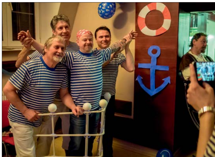
Všichni doplnili šťastně a v dobré náladě.