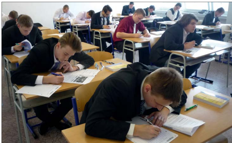
Písemná práce z českého jazyka.