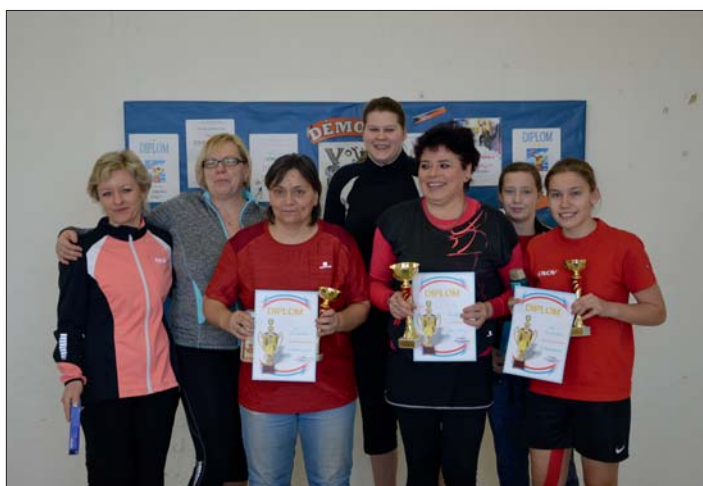
Hráčky v plném počtu s vítěznou „trojkou“.