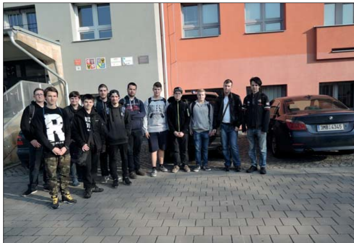
Dvanáct „statečných“ pro celostátní kolo.

V úterý 21. února proběhlo na naší škole základní kolo matematické soutěže.