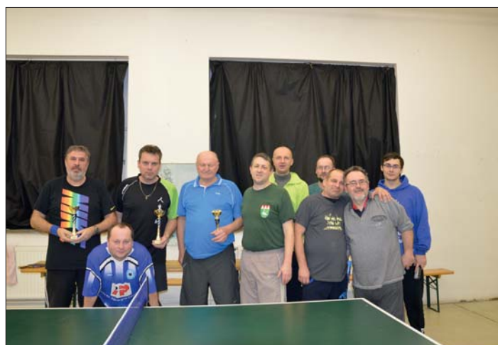
Kdo se nám schoval?