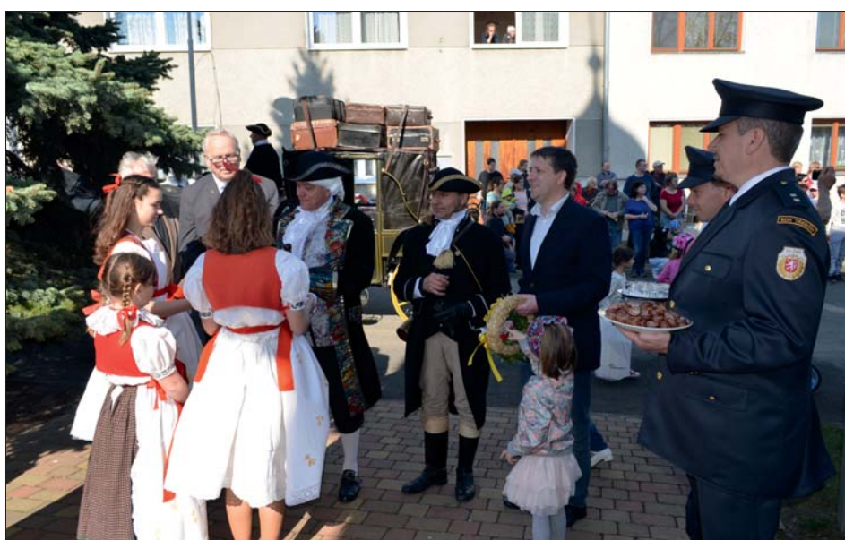
Vzácná společnost při zastávce v Třebčíně.