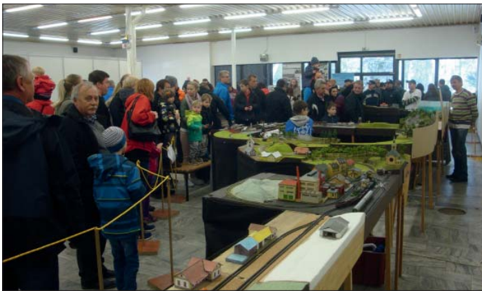
Bohatá expozice modelů potěšila malé i velké návštěvníky výstavy.