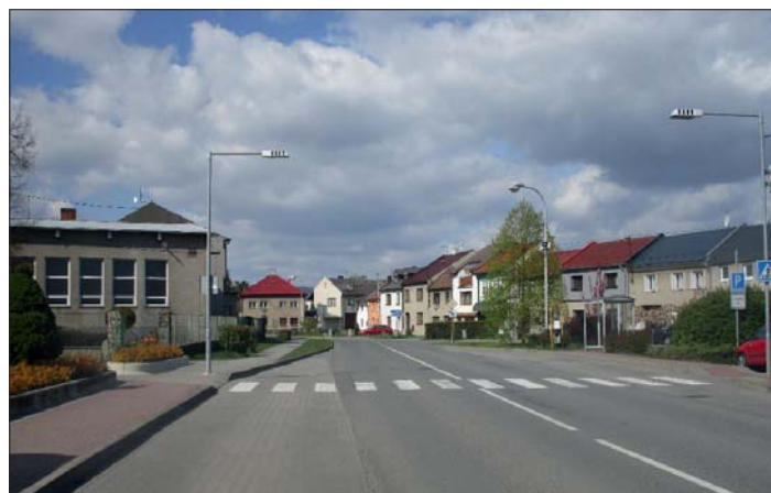
... a dnes.