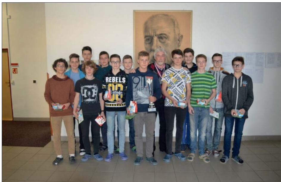
Držitelé druhého místa z Plzně.

Turnaj nám vyšel náramně. Chlapci pokračovali ve svých výkonech z postupových kol a probjovali se do finále. Za celý rok až do finále neprohráli jediný zápas. Do Plzně se s nimi probjovalo družstvo