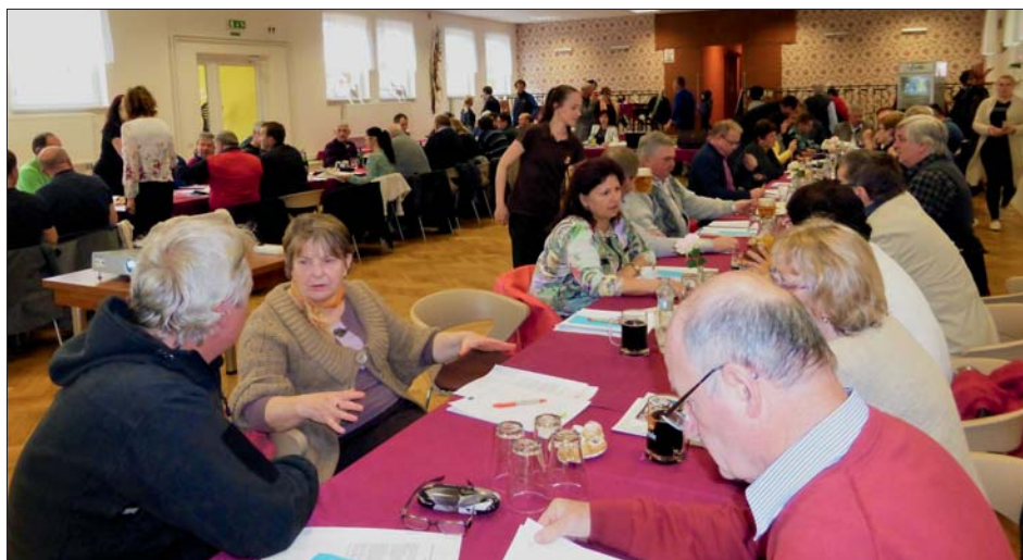
Z jednání valné hromady MAS Region HANÁ 25. dubna 2017 ve Smržicích.

Finanční podpora pro jednu školu se pohybuje v rozmezí od dvou set tisíc korun až po téměř milion a půl korun. V rámci