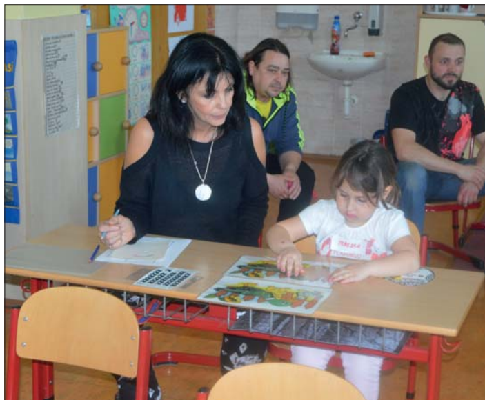
Budoucí „prvňáčci“ brali své úkoly vážně.

Mgr. Leona Čotková Mgr. Milena Vychodilová