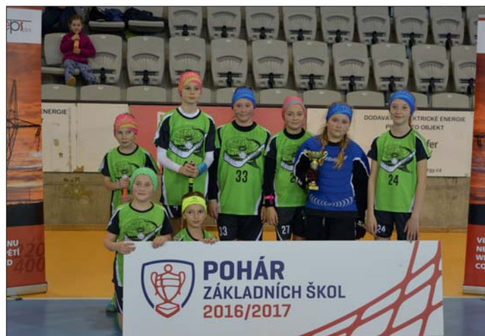
S chutí do dalšího boje!