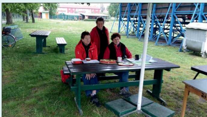
Tady to vždycky začíná (z „Mánesky 2016“).