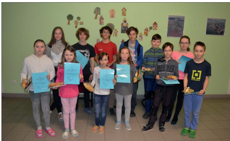
Úspěšní řešitelé školního kola.