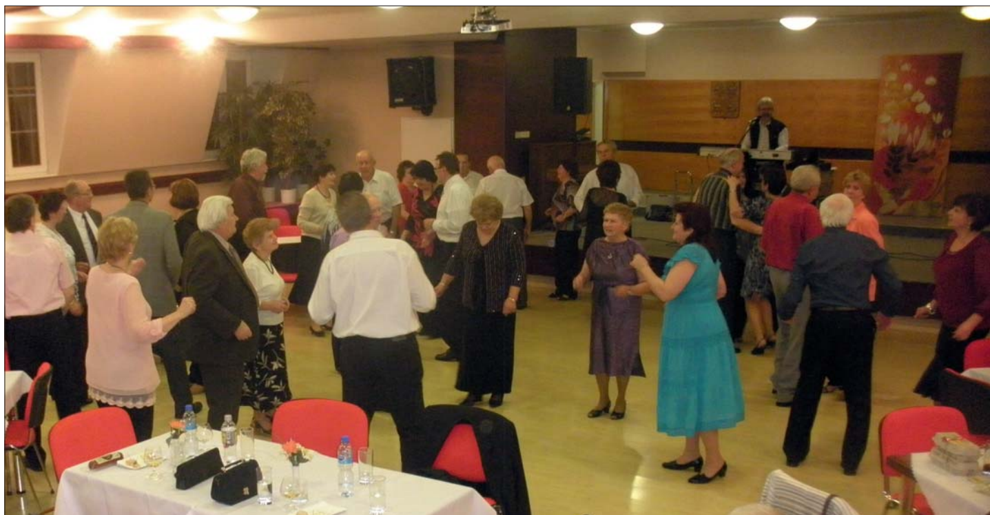
S veselou myslí a dobrou společností je život příjemnější.