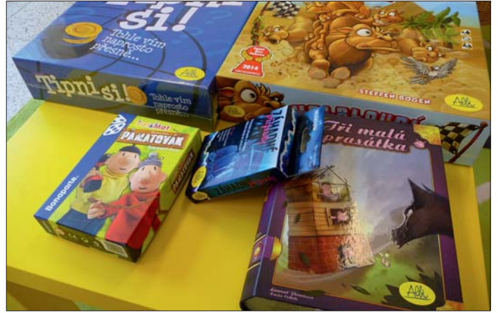
K novým přírůstkům v knihovně patří také společenské hry.

Jste dlouhodobě nemocní nebo se ze zdravotních důvodů nemůžete dostat do knihovny? Čtení se vzdávat nemusíte. Lutínská knihovna Vám nabízí donášku knih. Tato služba má několik pravidel: