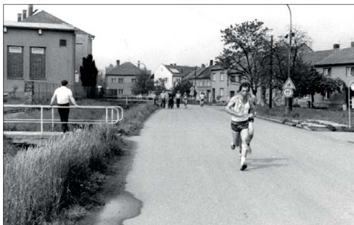
V květnu 1990...