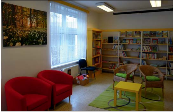
„Obývák“ pro filmový klub najdete v oddělení literatury pro mládež.