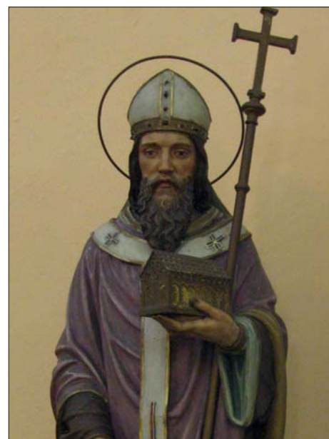
Sv. Metoděj a sv. Cyril v třebčínské kapli sv. Floriána (sochy vytvořil Eduard Wesselveect).