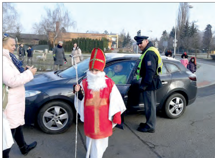
Ukázně řidiče odměnili Mikuláš a anděl.