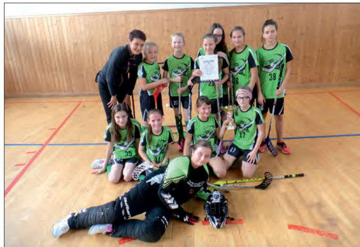
Mladší žákyně (6. a 7. ročník).