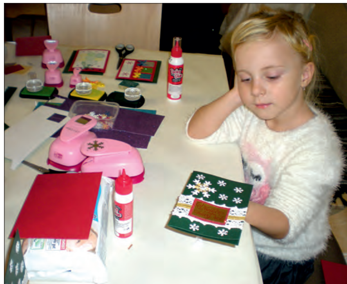
Copak si dnes vyrobíme?

Nedělní odpoledne uteklo jako voda, děti odcházely spokojeně domů. A jak slíbil Mikuláš, za rok zase na shledanou.