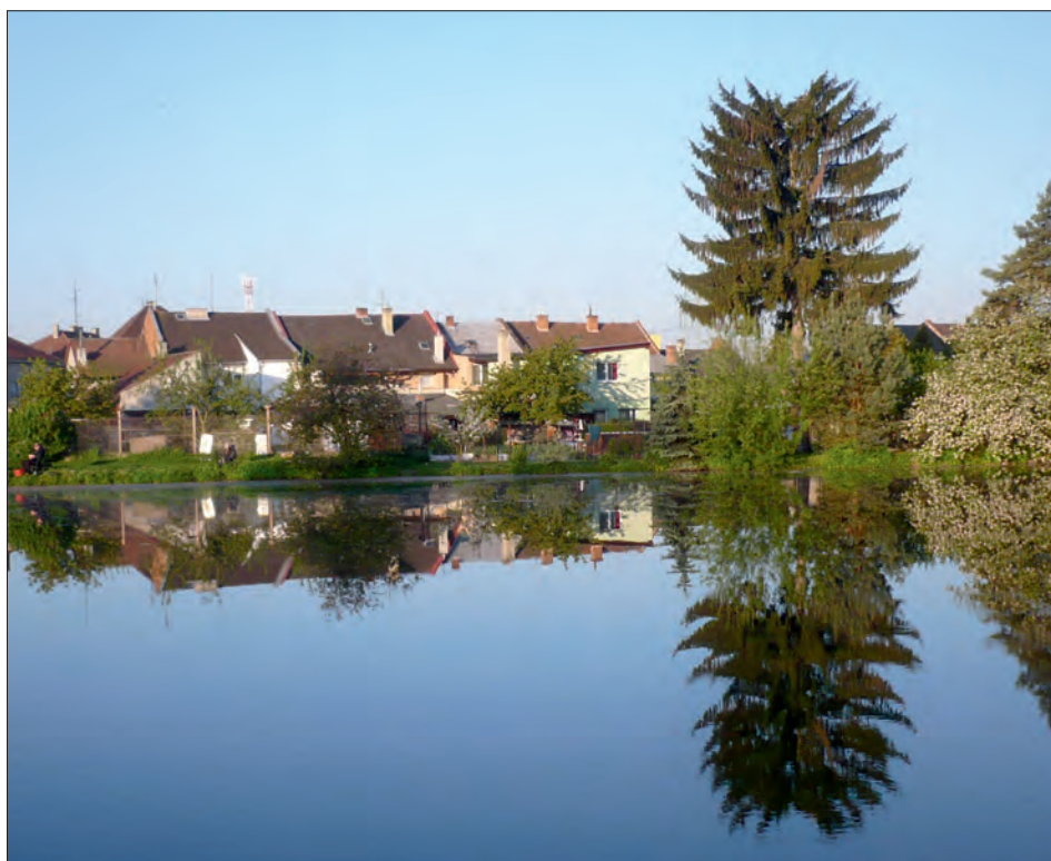
Historie místní akční skupiny Region HANÁ začala v roce 2002 v Těšeticích.

„Místní akční skupiny ale nevznikly primárně jen kvůli finančním prostředkům, které mohou rozdělovat – to je přidaná hodnota,“ říká předseda Národní sítě Místní akční skupiny ČR Václav Pošmurný. Motivací pro založení MAS, a to už od jejich vzniku v Evropě v roce 1991, je podle něj především snaha spojit partnery v regionu. MAS se pak pro ně stávají základnou a oporou, která je vede celým procesem –