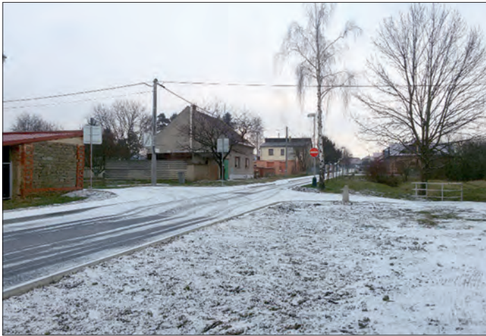
Opravená komunikace u nádraží (s prvním prosincovým sněhem).