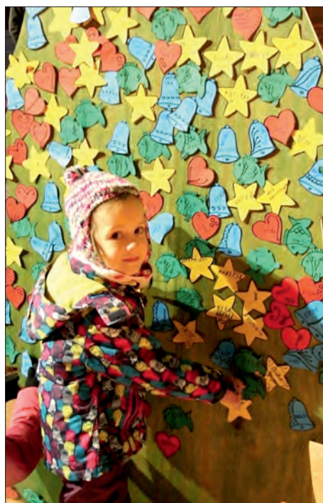
Stromeček vánočních přání plnili dospělí i děti.

Právě vzájemné setkávání je to, co lutínské občany rok co rok přivádí na slavnost rozsvícení vánočního stromu, která se již stala tradicí. Tradiční byl i program, jímž