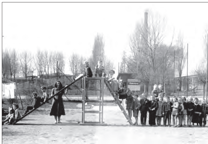
Před 85 lety.

Pokud by nebyl vedle současný obrázek, těžko by se dalo odvodit, kde tato fotografie dětí z mateřské školy vznikla.