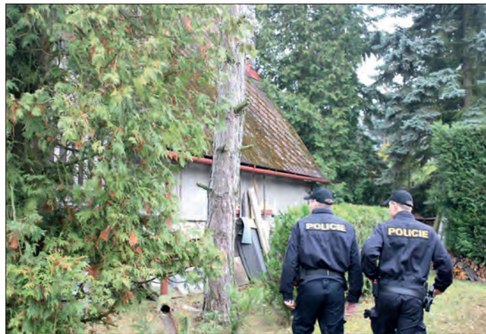
Chaty a chalupy na samotě lákají nevídané „hosty“.