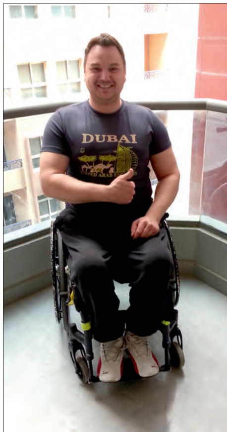
Chvilka klidu před závodem.