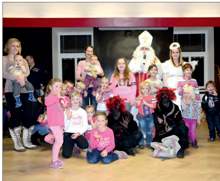
Mikuláš zahájil advent v Třebčíně.