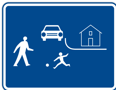
Jiné značení „obytné zóny“.

A ještě poznámka na závěr: Zónami, prahy, značkami se můžeme snažit situaci na našich cestách zlepšovat, ale bez vzájemné ohleduplnosti se stejně úplně nezklidní.