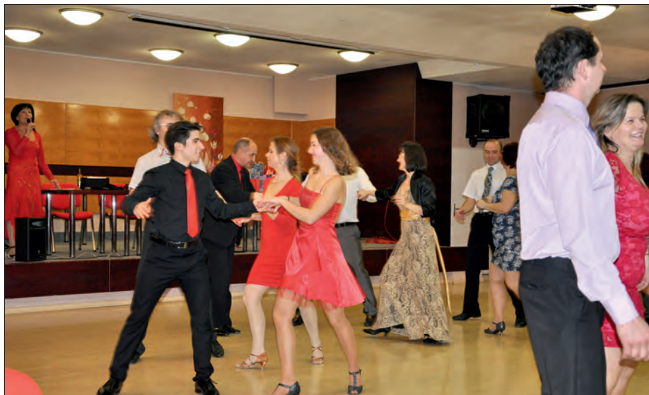
Na plesech to „rozbalíme“.