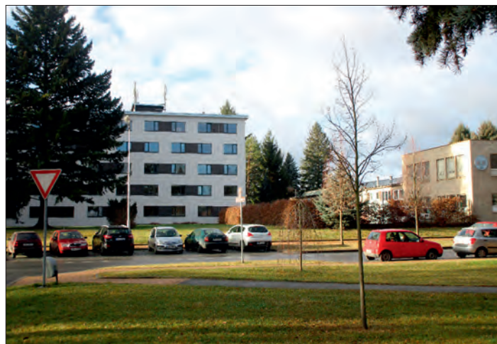
Stejné místo dnes.