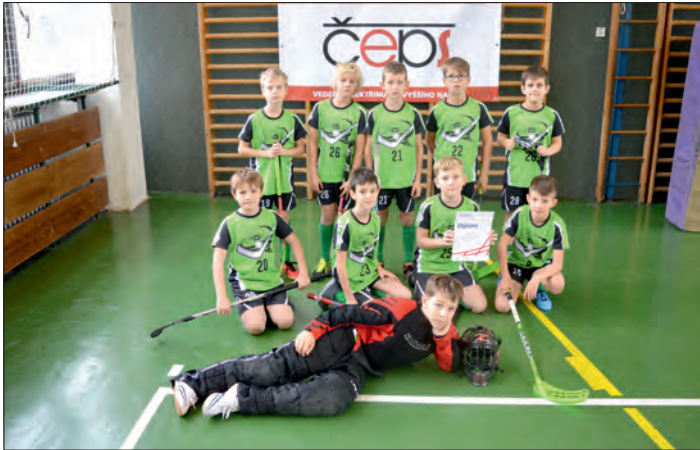
Chlapecké družstvo z 1. stupně (3. a 4. ročník).

Šest týmů a čtyři první místa - to je bilance letošních okresních kol ve florbalu ZŠ. I letos jsme přihlásili všechny kategorie, protože florbal hrají naše děti rády.