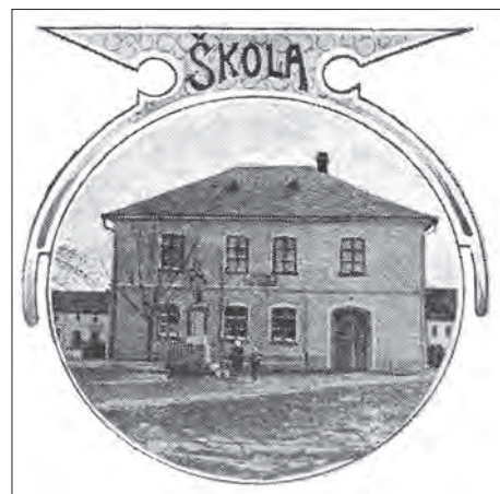
Podoba školy na přelomu 19. a 20. století.