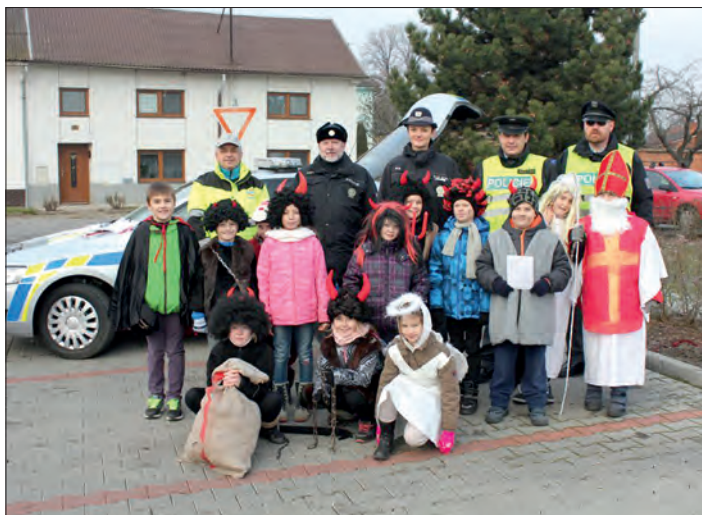
„Dětská policejní hlídka“ pomáhala České policii.