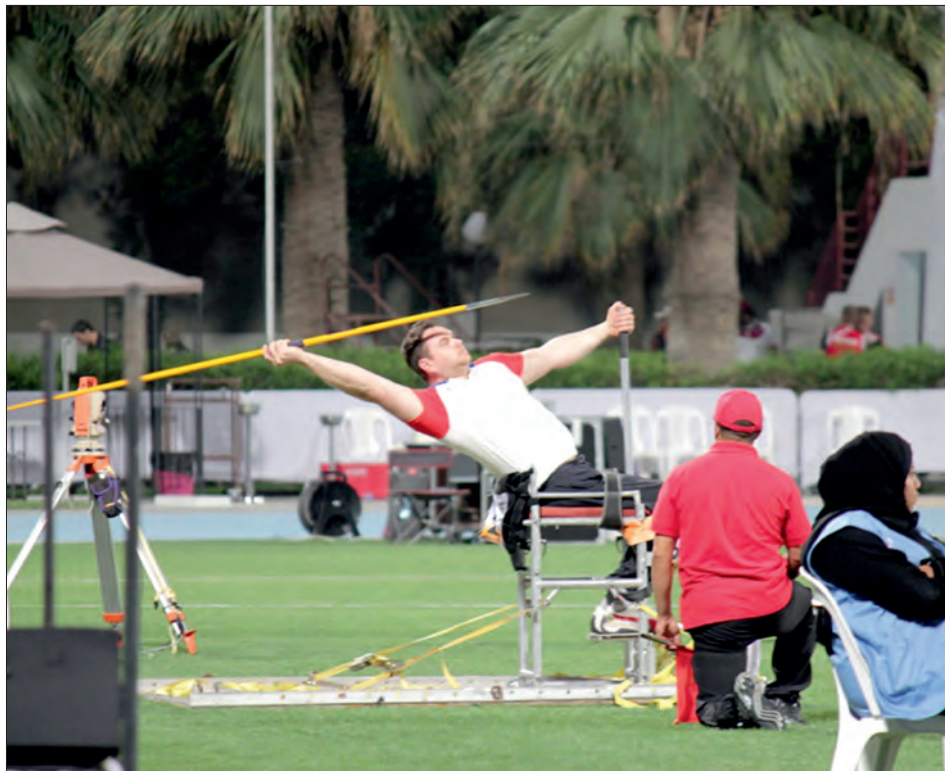
Hod oštěpem na závodech v Dubaji.