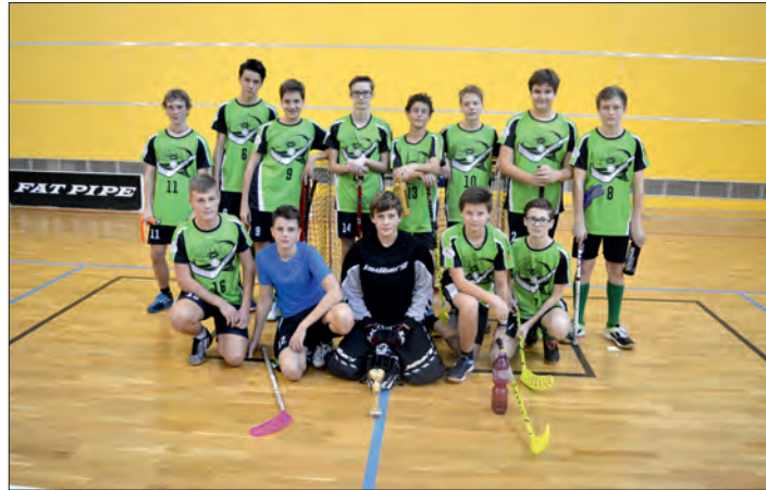
Starší žáci (7.-9. ročník).

Poslední naše družstvo, které zasáhlo do florbalových bojů v okresních kolech, bylo družstvo děvčat z prvního stupně. Družstvo se také nově tvoří, je složené z žaček třetích a čtvrtých tříd. Mělo ale víc štěstí než kluci - dokázalo všechny své