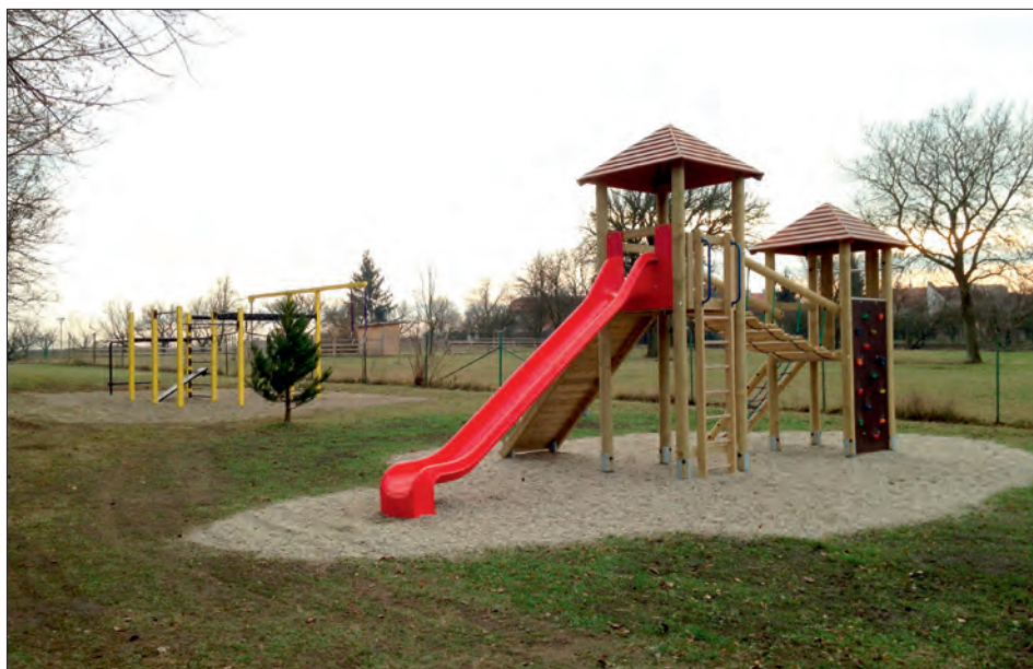
Skluzavka s lanovou prolázačkou.

Důvodem ke snížení rychlosti na obslužných komunikacích je především zvýšení bezpečnosti chodců a cyklistů, ale přináší i zmírnění hluchnosti a emisí. K omezení rychlosti se nepoužívají běžné dopravní značky omezující rychlost, jejichž platnost je rušena křižovatkou, ale vytvářejí se tzv. zóny, které jsou označeny značkami na začátku a konci. Nejčastěji se používá „zóna 30“, která je stavebně výrazně jednodušší než „obytná zóna“, protože zůstává zachováno