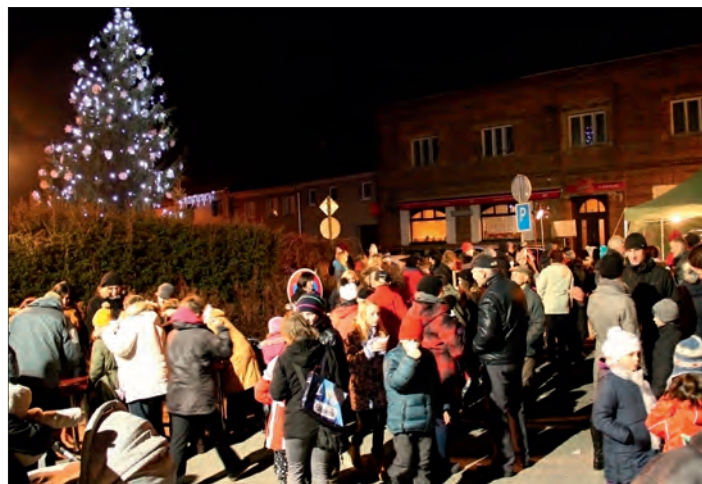
Zpívání, horký punč a voňavé trdelníky v Lutíně.