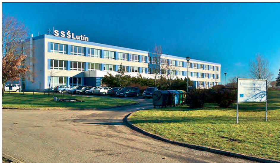
Škola otevřená v říjnu 1987 byla zrekonstruována v roce 2014.