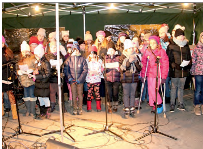
Bohatý hudební program připravili současní a bývalí žáci ZŠ.