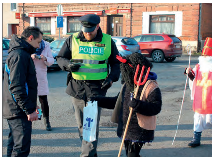
Kdo se provinil, „propadl“ pecku.