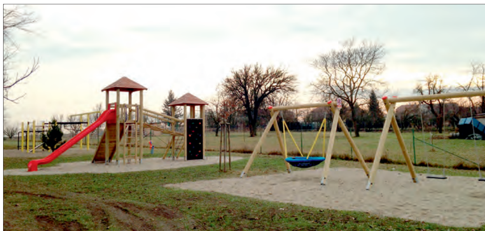
Nové dětské hřiště v „Domkách“.

Kdokoliv v posledních několika měsících přijížděl do Třebčína směrem od Lutína, nemohl přehlédnout novou „dominantu“, která se objevila v lokalitě „Domky“. Obec zde zřídila nové dětské hřiště. K dispozici jsou dvě houpačky, houpačka „ptačí hnízdo“, pes na pružině a herní sestava se dvěma věžemi, skluzavkou a dalšími prvky, které jsou nepřehlédnutelné.