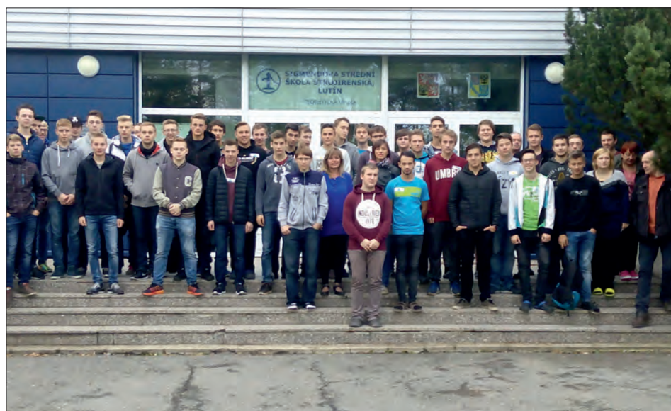
Společně s celým pracovním týmem před školou v Lutíně.