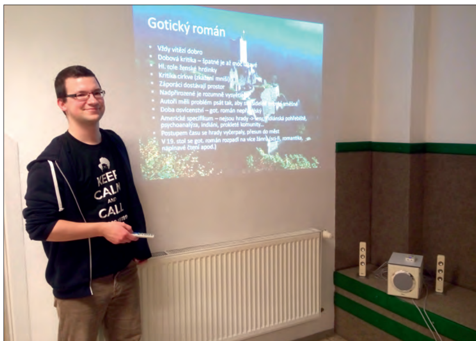
I bát se musíme umět!

Je to tady, nový rok, čas vzpomínání a předsevzetí. V knihovně tomu není jinak. Máme za sebou úspěšný rok a hodně se toho podařilo. Nový knihovnický systém, technika, částečná rekonstrukce, vyklizení archivu a další. Děkuji všem čte-