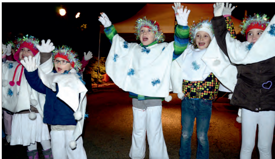
Radost pod rozsvíceným vánočním stromem.