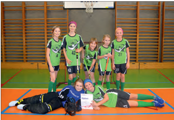
Dívčí družstvo z 1. stupně (3. a 4. ročník).

Další družstvo, které se zapojilo do bojů, bylo družstvo hochů z prvního stupně. Nově vzniklý tým, složený z žáků třetích a čtvrtých tříd, skončil nakonec na dru-