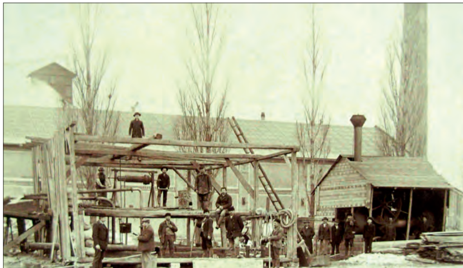
Pohled do dvora továrny Sigmundů, v přístavku vpravo lokomobila.