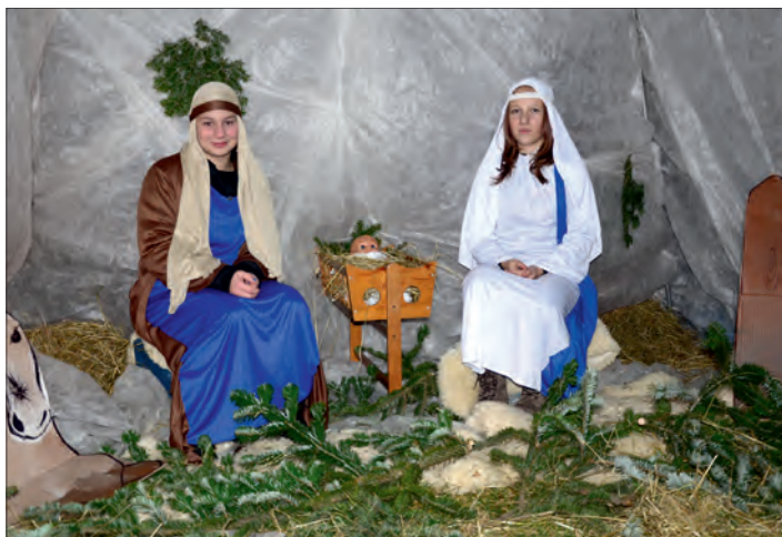
Rozsvěcení vánočního stromu s „živými jesličkami“ v Třebčíně.