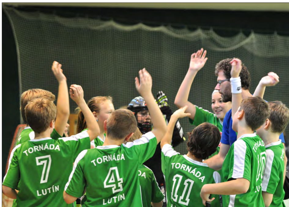
Lutínská „tornáda“ si vedou úspěšně.