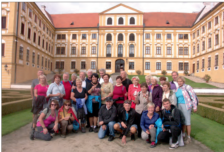
Účastníci zájezdu na nádvoří zámku v Jaroměřicích nad Rokytnou.

Na základě informací zpracovala Mgr. Ladislava Kučerová