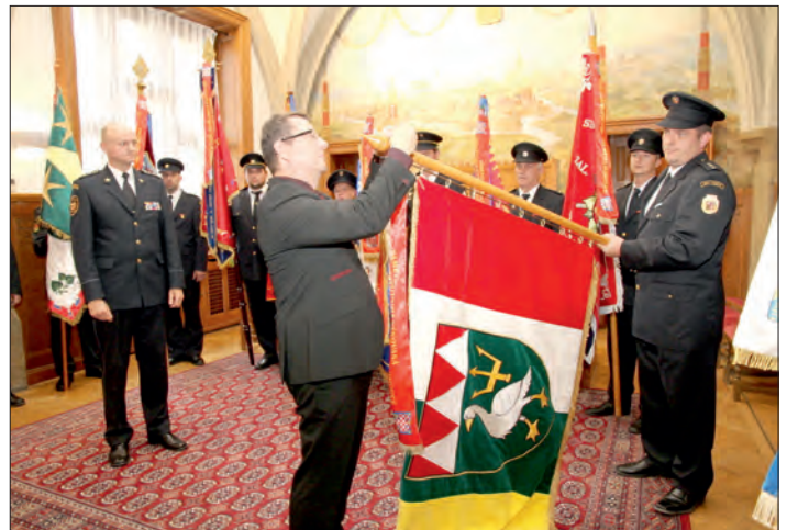
Zástupce třebčinské jednotky přijímá ocenění.