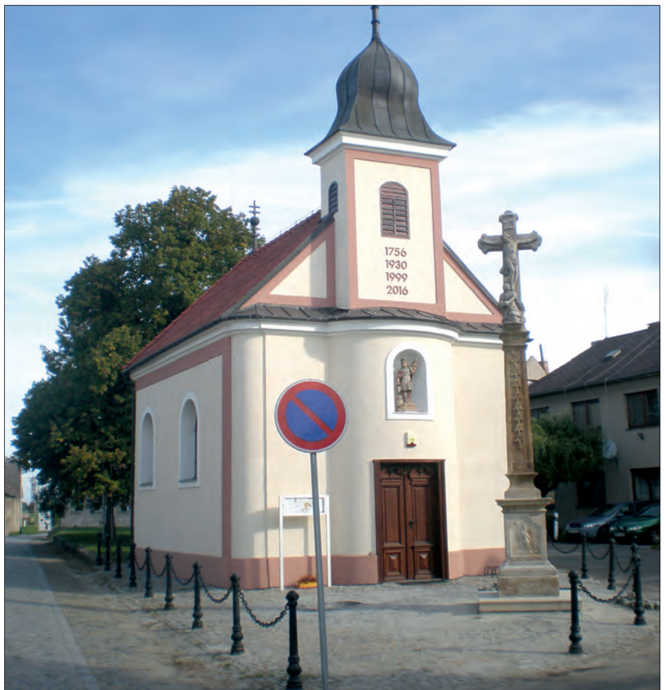
Lutínská kaple a opravený kříž.

Renovací prošla rovněž socha holčičky umístěná před mateřskou školou v Lutíně. Tato socha stála původně před starou mateřskou školkou, po jejím zrušení však byla přemístěna na nynější místo. Renovace sochy spočívala v čištění kamene, odstranění