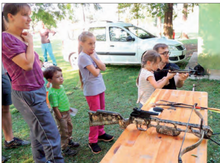
Nedělní sportování dětí s rodiči se vydařilo.