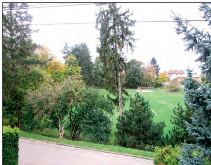
... a v současné době.