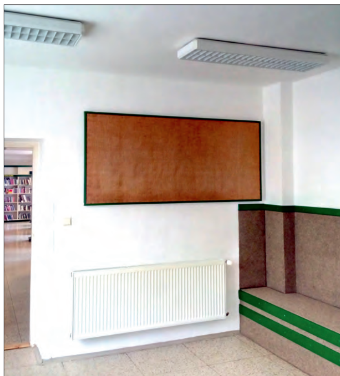
Vstupní prostor knihovny po úpravách.