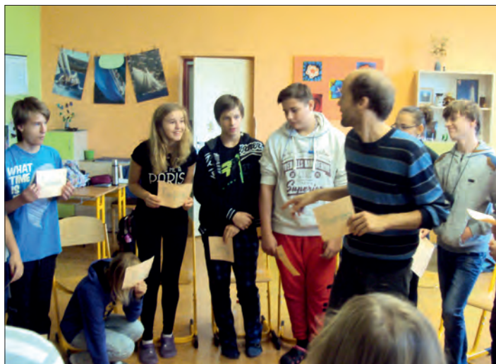
Němčina opravdu „nekousala“ a pobavila všechny účastníky.