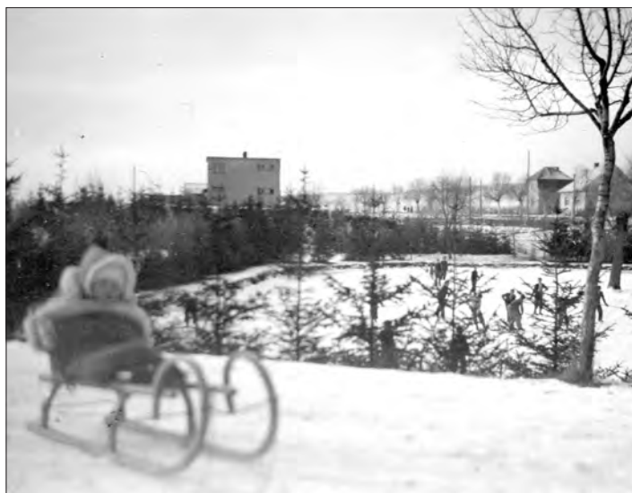
Před 85 lety ....