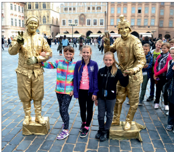
Šestáci s živými sochami („zlatáky“) na Staroměstském náměstí.