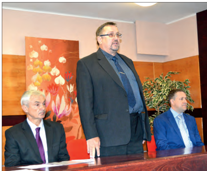
Zahájení školního roku a přivítání nových žáků Sigmundovy SŠS.