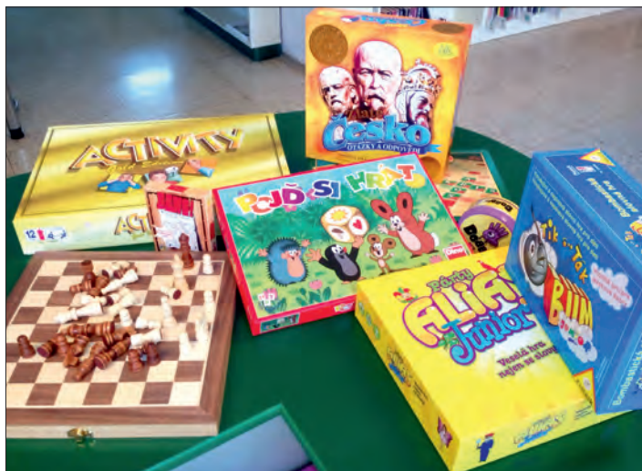
Deskové hry čekají na zájemce.