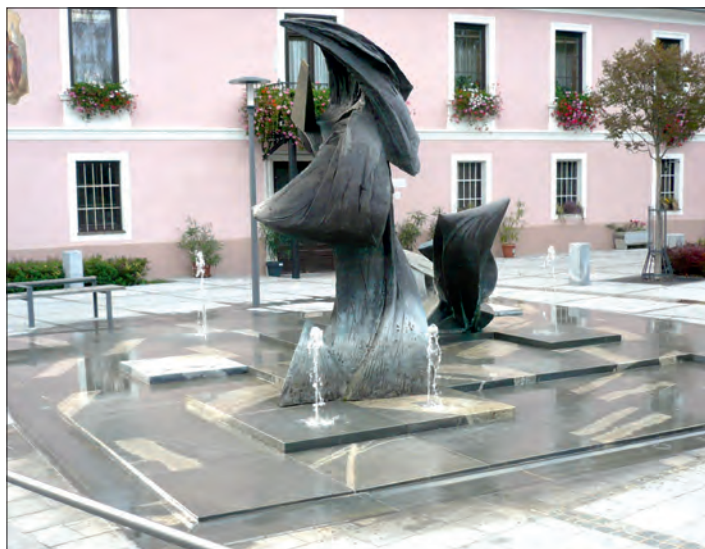
Architektura centra Slovinské Konice.

dotrsky, parky a květinová výzdoba. Navštívili jsme i družstevní vinařství „Zlati grič“, které bylo vybudováno z evropských dotací a mělo zajímavou architekturu – kromě příjezdové komunikace a vstupní budovy bylo celé pod úrovní terénu. Nebyl tak narušen cha-