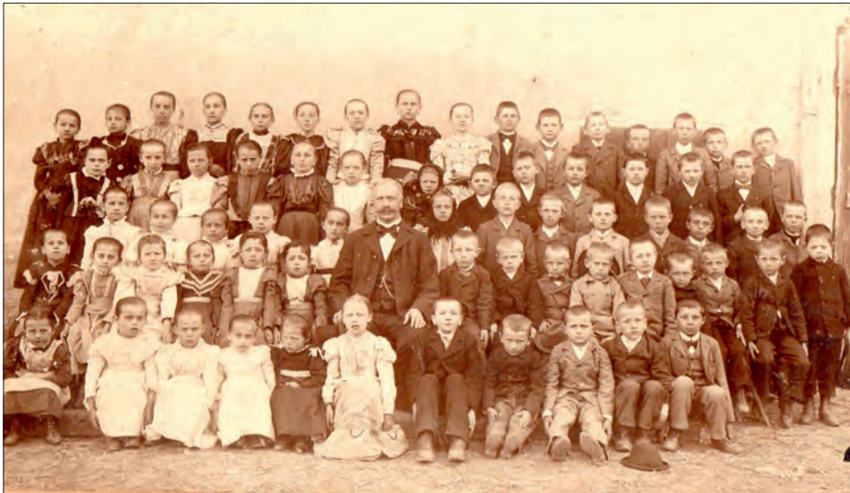
Fotografie pana učitele s žáky.