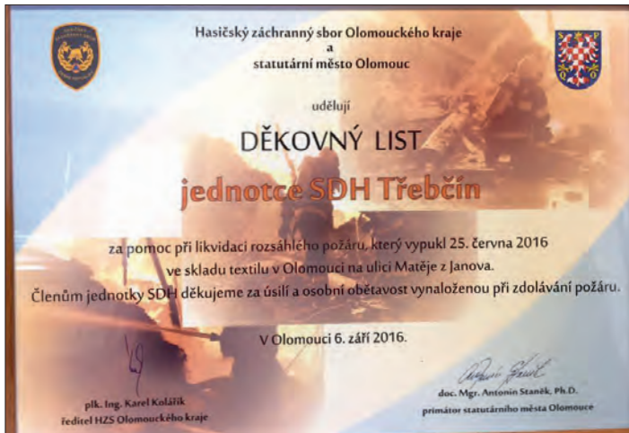
Děkovný list primátora Olomouce.