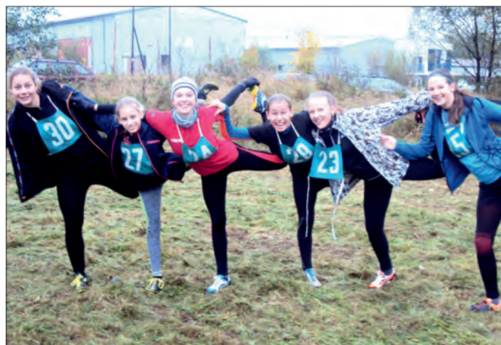
Krásné třetí místo v kraji potěšilo všechny účastníky.