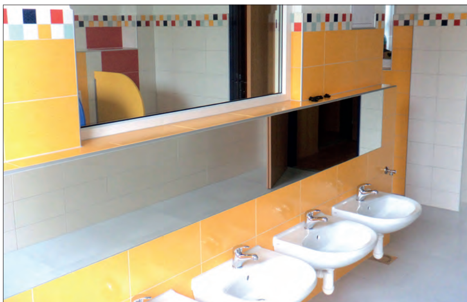
Nová umývárna v přízemí budovy základní školy.