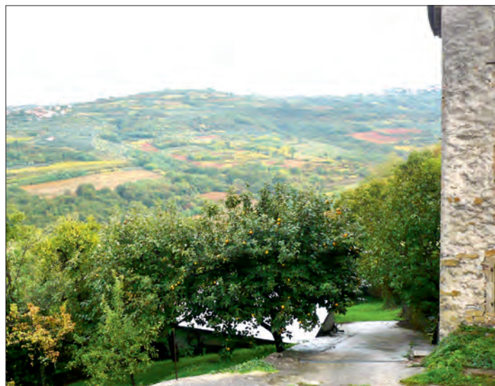
Ovocné sady v obci Padna.