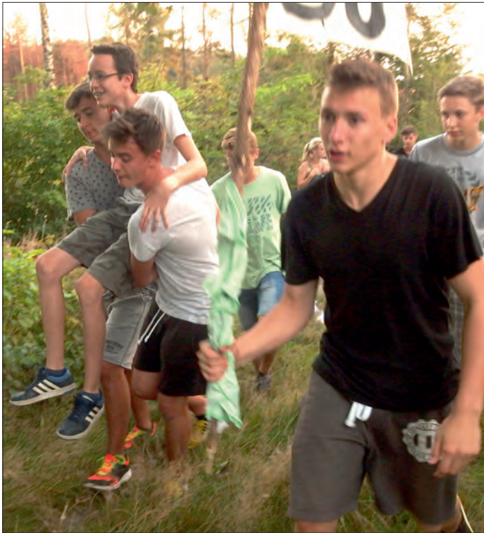
Adaptační kurz byl plný her, sportu a poznávání.