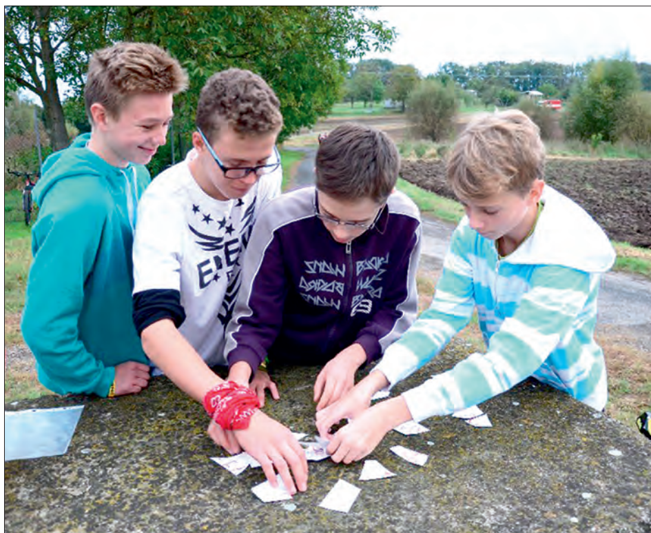
Hra prověřila důvtip, šikovnost a znalost okolí.