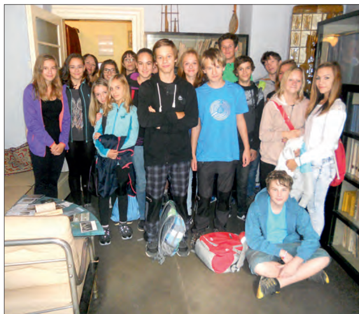
Osmáci po prohlídce Modrého pokoje v původním bytě skladatele Jaroslava Ježka v Kaprově ulici.