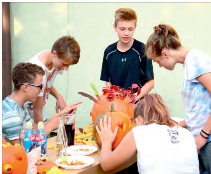
Do díla se zapojili dospělí i děti.