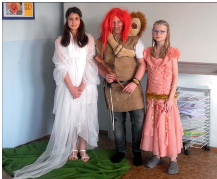
Tři hlavní (a jediní) hrdinové – Rozkoš, Hérakles a Ctnost (v bílém).