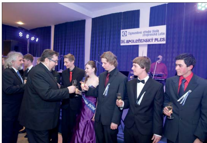
Vážná chvíle stužkování skončila přípitkem ...