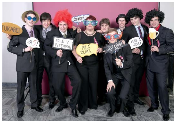
... a pokračovala svérázným veselím.