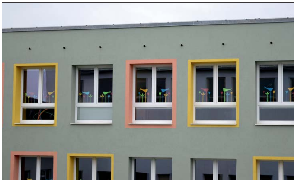
V malých odvětrávacích otvorech nad okny školní družiny hnízdili rorýsi.

Zajímavé bylo také povídání o netopýrech, při kterém jsme si mohli jednoho hendikepovaného jedince netopýra rezaového prohlédnout naživo a poslechnout si pomocí speciálního přístroje zvuky, které vydává a které jsou lidským uchem