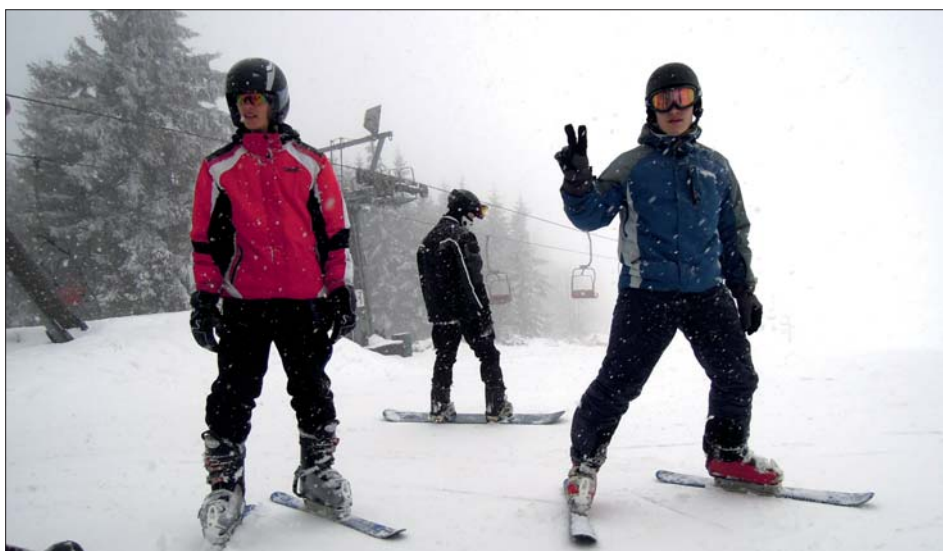
V Ostružné se lyžovalo na přírodním sněhu.