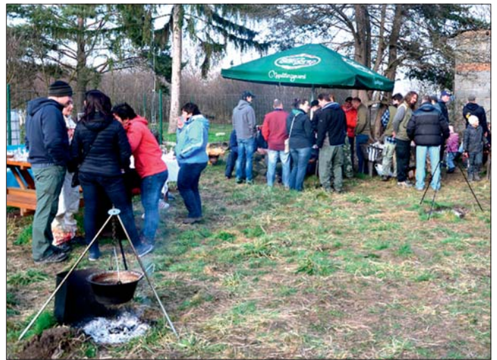
Pátý ročník soutěže o nejlepší kotlíkový guláš se vydařil.