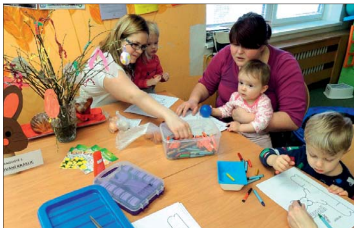
Do zdobení a her se zapojily děti i maminky.