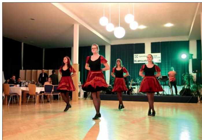
Tanečnice skupiny Tarantela Olomouc.