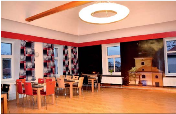
Pohled od baru do sálu vlevo.