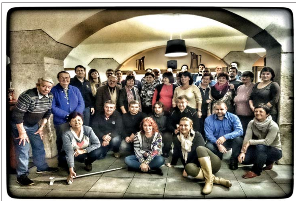
Spokojené tváře svědčí o vydařené akci.