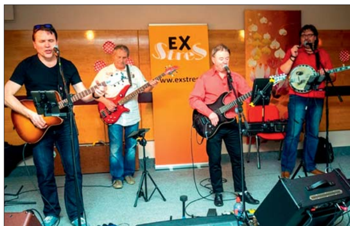
Kapela EX STRESS přispěla k dobré zábavě.