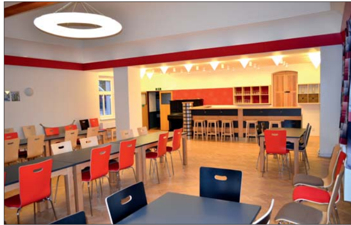
Nový bar, vlevo vstup do sálu.