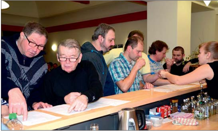
Hodnotící komise ochutnává a posuzuje.