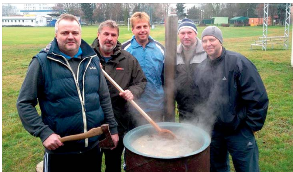
Poradí si nejen na kurtu.

V letošní sezoně bychom rádi rozšířili naši