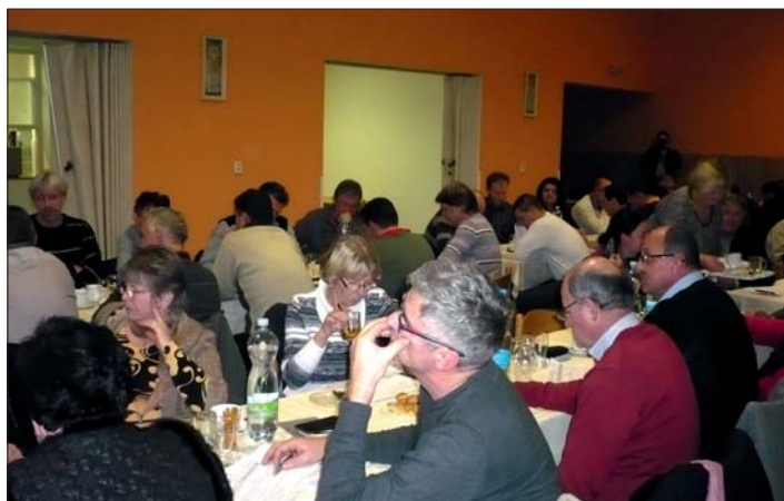
Strategie Regionu HANÁ byla projednávána také na valné hromadě v Lešanech v listopadu 2015.

rozvoj občanské společnosti a sociální soudržnosti prostřednictvím dostupných a kvalitních sociálních služeb, podpory spolkové činnosti, občanské angažovanosti a aktivizace a zapojení komunit bez rozdílů věku.