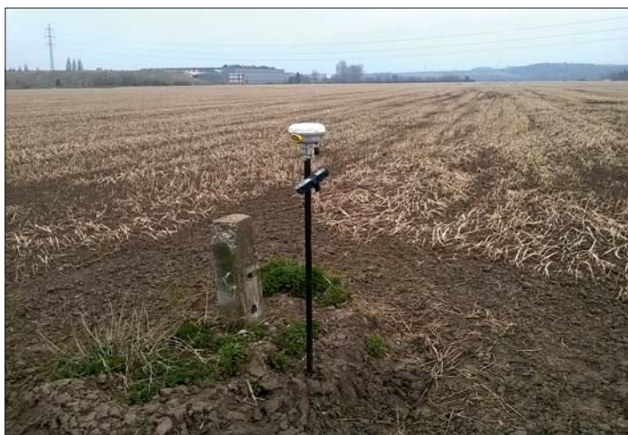
Trojmezí s geodetickým přístrojem