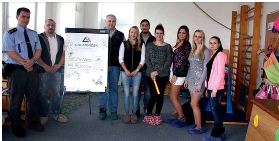
Zábavně vzdělávací dopoledne připravily studentky MVŠ Olomouc.

Na úterý 22. března připravily studentky Moravské vysoké školy v Olomouci zábavně vzdělávací dopoledne pro děti v mateřské škole v Lutíně. Sponzorem akce s názvem „Bezpečnost na silnicích“ byla společnost CHLADNÍČEK autodily, jejíž vybraní zaměstnanci darovali dětem na památku bezpečnostní odznaky a reflexní