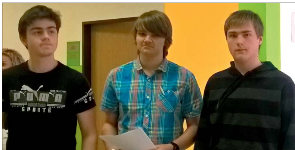
Do you speak English?