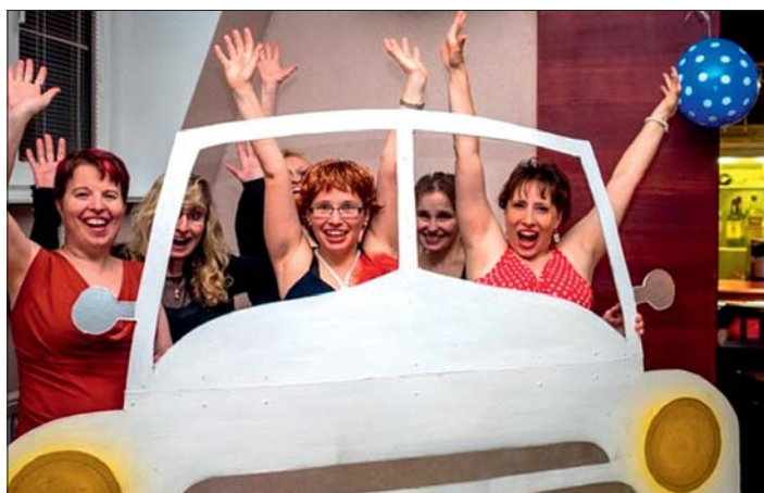
Jízda kabrioletem byla bezpečná a bez nehod.