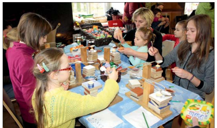
Děti a maminky daly přednost zdobení.