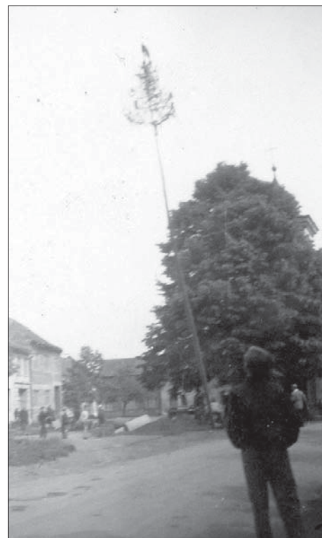
„Lípy Svobody“ v květu 1960. Z kaple je nejasně vidět jen vrchol kříže.