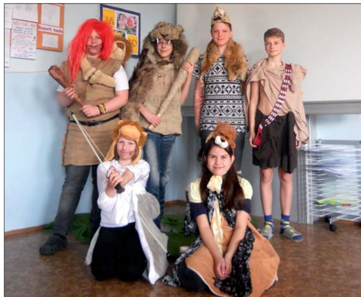
Hérakles v chlapeckém i dívčím provedení.

Hodiny literatury jsou pro takovéto hovory tím pravým prostředím. I proto jsme se tento citát naučili se žáky šestého ročníku nejdříve pěkně recitovat a posléze jsme celý rozhovor mezi Héraklem, Ctností a Rozkoší předved-