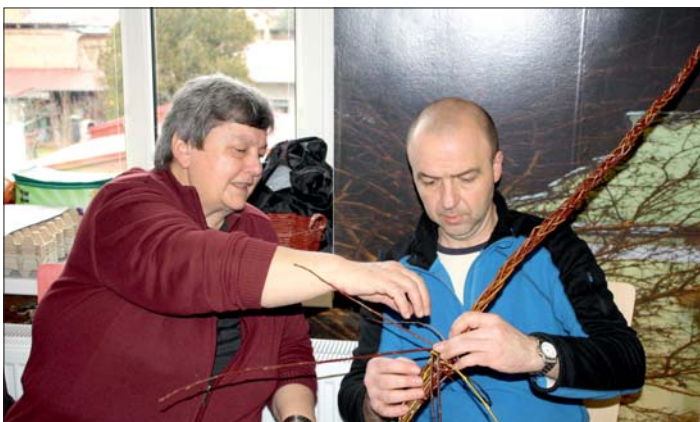
Malá instruktáž a pomlázka je hotová.