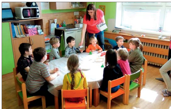
Děti poznávají zábavnou formou svět a jeho zvláštnosti.

Důležitým prvkem kurzu je smysluplné vyplnění volného času dětí. V rámci jednoduchých pokusů a experimentů budou mít děti možnost rozvíjet své vědomosti nejen z chemie, fyziky, ale i z dalších oblastí přírodních věd. Budou zábavnou for-