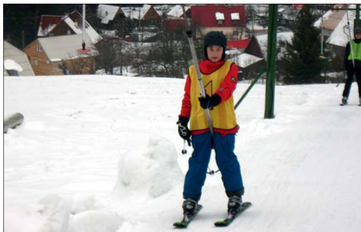
Konečně sníh – málo, ale opravdový!