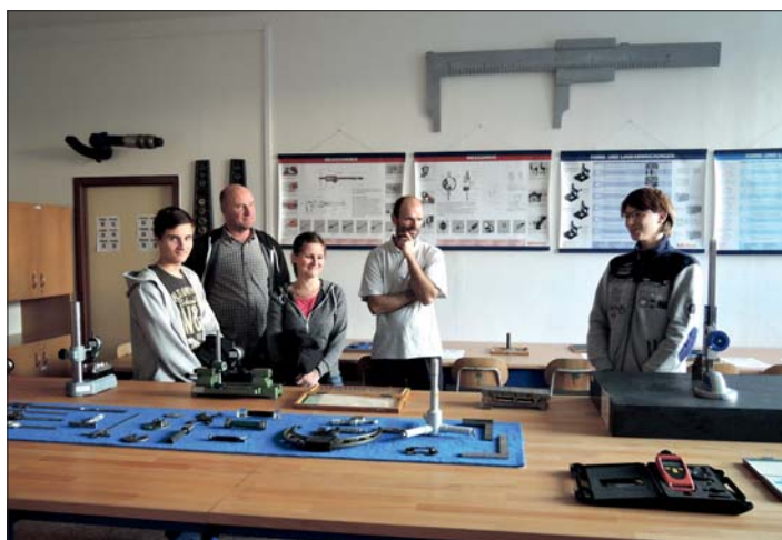
V nové laboratoři technických měření.