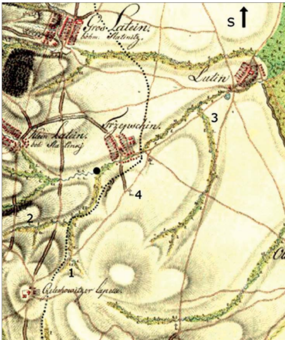
Mapka okolí Třebčína z roku 1768: Tečkovaně je doplněna železniční trať, černou tečkou „Rečák“. Vesnice Andlerka (Lípy) zatím neexistovala.

Možné vysvětlení úkazu lze objevit na mapce pořízené rakouskými důstojníky při prvním vojenském mapování zdejší krajiny v roce 1768. Deštná tehdy měla několik přítoků, které dnes v krajině nejsou. Tekly též ze svahu bezejmenného kopce jižně od Třebčína (nadmořská výška 285,3 m). Pamětníci mu říkají Kalvárie a je na polní trati Slatinek zvané „Na Záhoří“. Jeden z přítoků měl dva prameny poblíž polní cesty spojující tehdy Třebčín s Kaplí a napájel jej potůček z oblasti