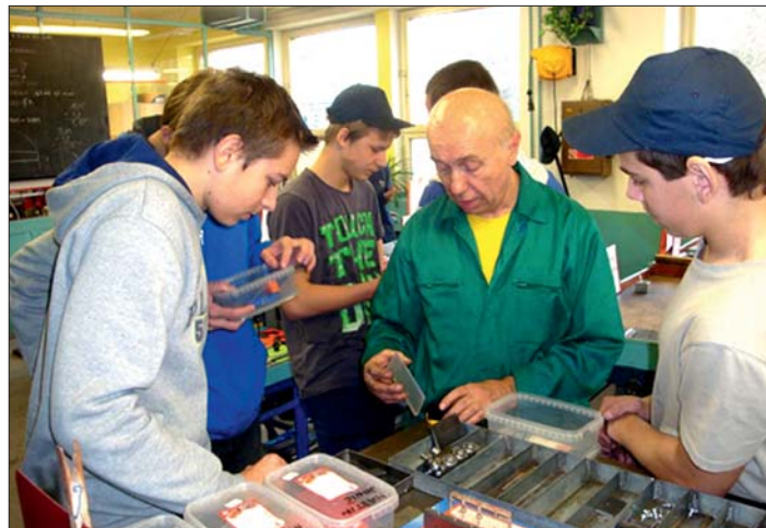
Ve školních dílnách.

Budoucím studentům oboru mechanik seřizovač jsme nabídli možnost vyzkoušet si nanečisto přijímací zkoušky z matematiky