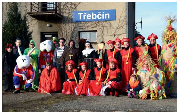
Malá zastávka a velké společné foto.