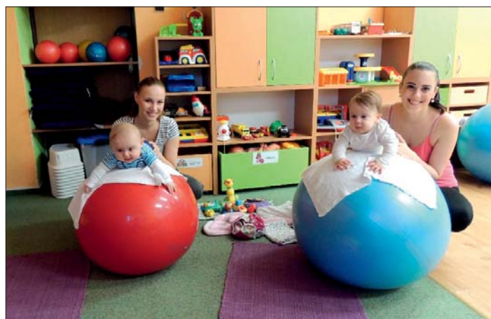
S máminou pomocí to zvládnou.