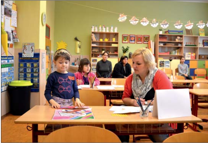
Předškoláci si s „pohádkovými“ úkoly poradili.