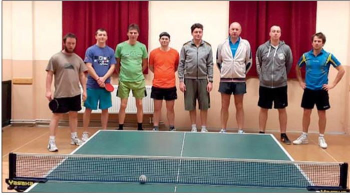
„A“ mužstvo v herně stolního tenisu.