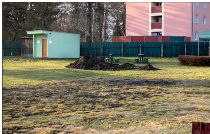
Stejné místo dnes (při úpravách).