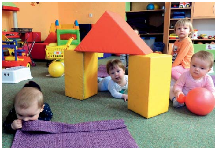
Cvičení přináší radost dětem i maminkám.