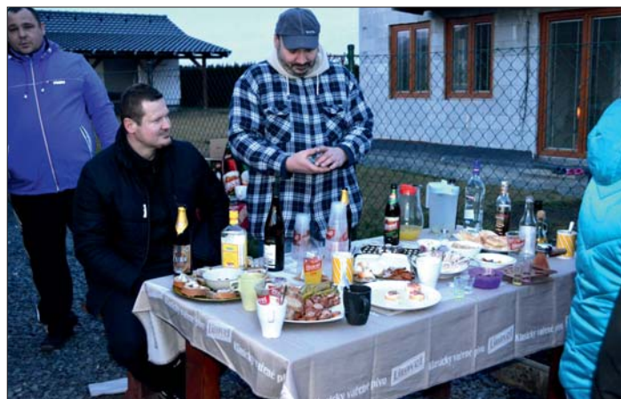
Občerstvení pro účastníky průvodu.