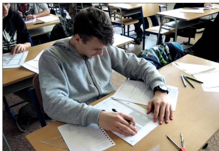
Přijímací zkouška z matematiky – zatím „nanečisto“.