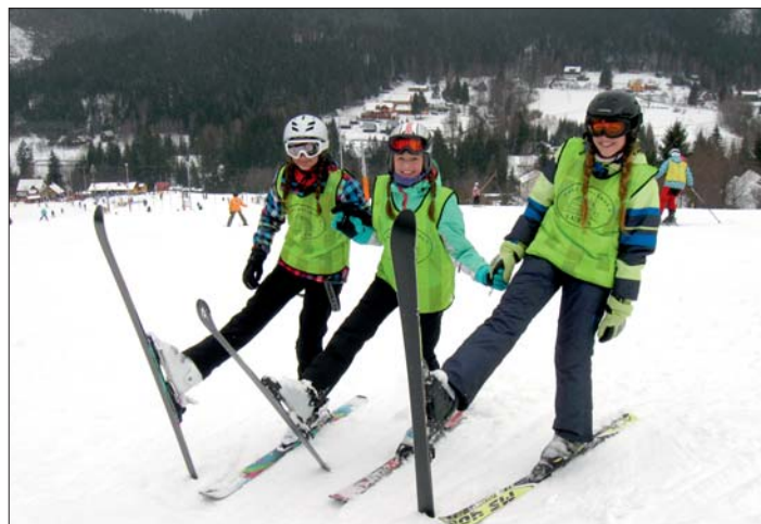
Ani při výcviku nesmí chybět legrace.