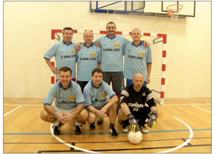
„Stříbrné“ družstvo z Lutína.

Naši "staří páni" v Čechách rozhodně nezklamali a po dvou výrazných výhrách poměrem 7:2 a prohrách 2:4 a 4:8 obsadili krásné druhé místo, ke kterému jim samozřejmě gratulujeme. Třešničkou na dortu bylo