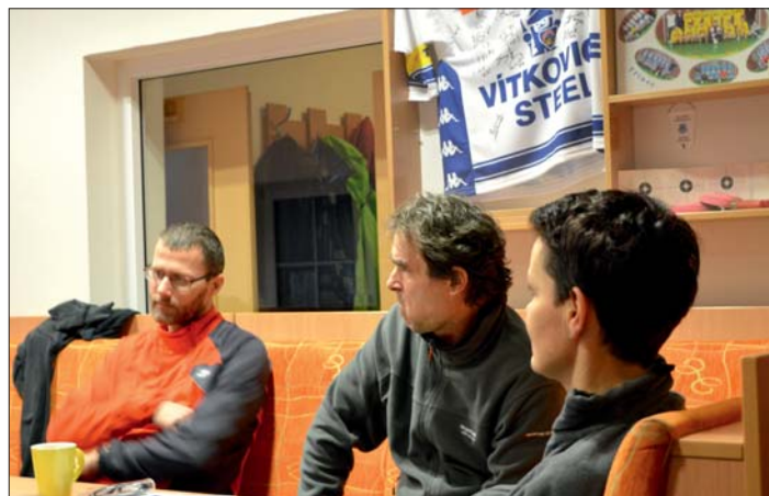
Chvilka zaslouženého odpočinku.