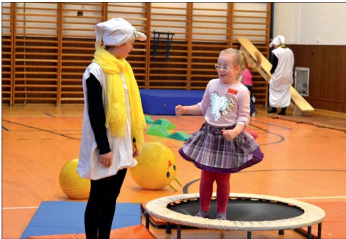
K zápisu patřila také prověrka pohybových dovedností.