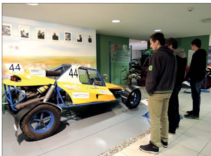
V technickém muzeu Tatry Kopřivnice si studenti vychutnali krásu exponátů.