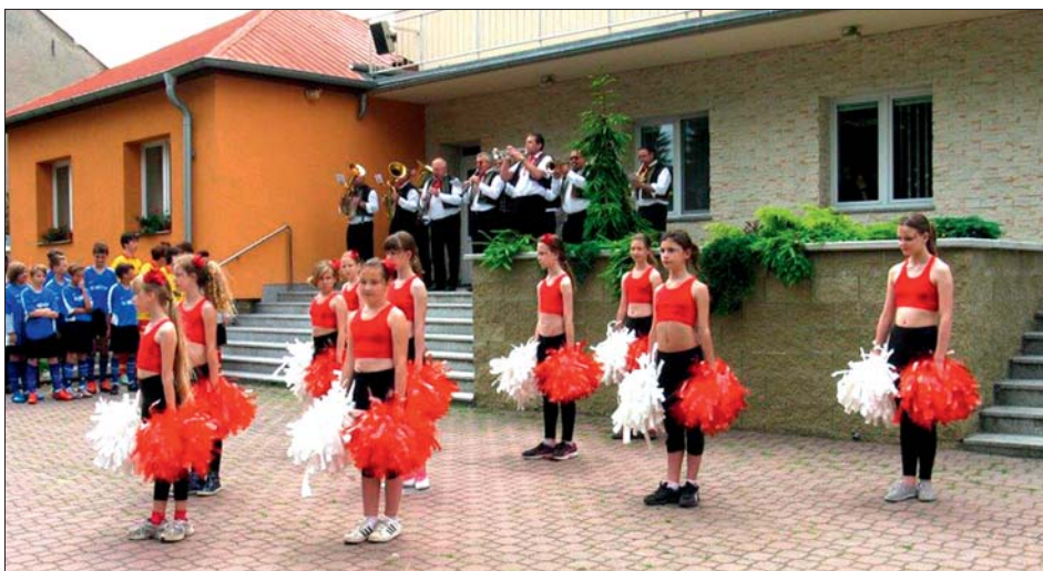
Vystoupení hněvotínských mažoretek.

V loňském roce se soutěže úspěšně zúčastnila obec Hněvotín a získala druhé místo v rámci Olomouckého kraje.