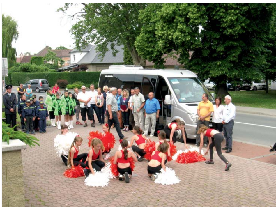
Hodnotitelská komise posuzuje život v obci Hněvotín – červen 2015.

„Olomoucký kraj tuto soutěž dlouhodobě podporuje a v letošním roce uvolnil z rozpočtu 500 tis. Kč. Druhé a třetí místo v krajském kole soutěže obdrží finanční dar ve výši 100 tis. Kč, dále kraj udělí čtyřem