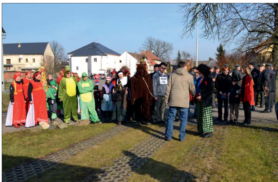
Zahájení průvodu masek za „početkou“.