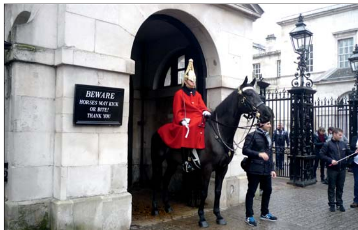
Downing Street 10 – sídlo britského premiéra.