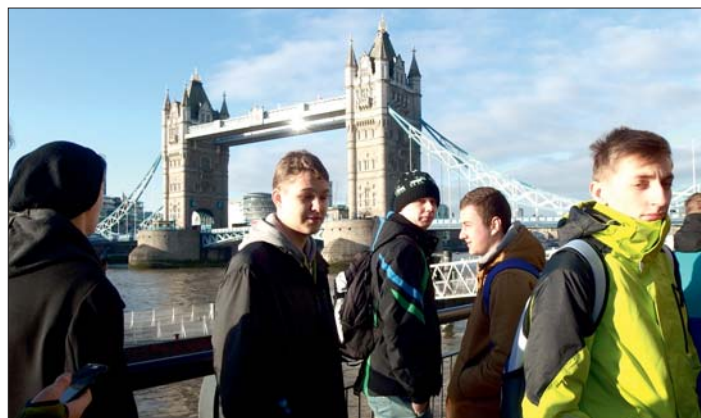
Tower Bridge a řeka Thames (Temže).

přijít večer, kdy jsme dorazili na tzv. „meeting point“, kde na nás čekaly „naše“ nové rodiny, u kterých jsme měli trávit čtyři večery.