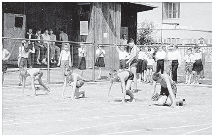
Sportovní závody dětí při oslavách 90 let podniku.