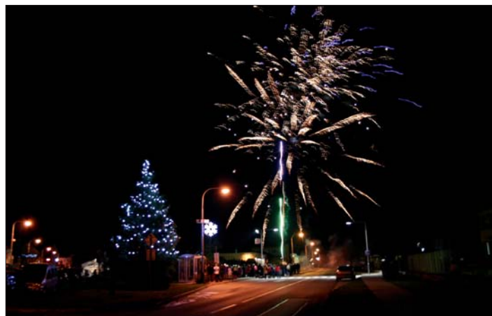
Tečkou za programem byl slavnostní ohňostroj.