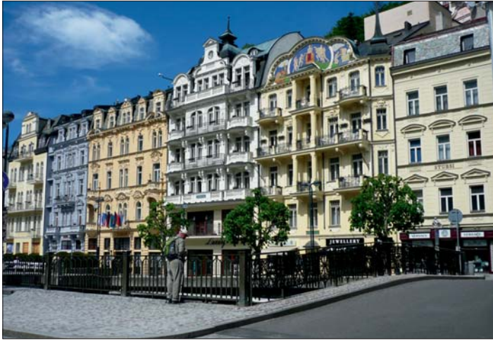
Město zdraví a filmových festivalů.