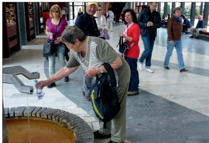
Na kolonádě v Karlových Varech.

a běh 51 běžců. Celková účast byla i přes dobré počasí slabší (174), ale akce bude pořádána i nadále.