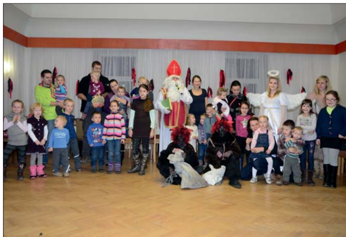
Po mikulášské nadílce.