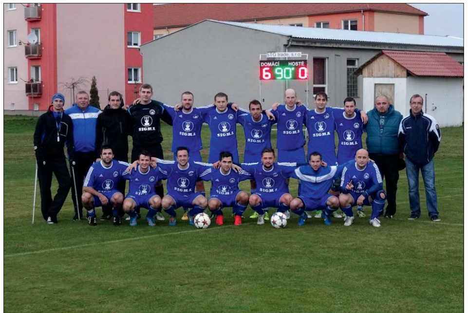
Vrací se pohaslá fotbalová sláva Lutína?

Po celý podzim bylo naše mužstvo povzbuzováno mnohými příznivci, kteří i na venkovních zápasech zajišťovali výbornou atmosféru. Podle zápisů o utkáních navštívilo naše