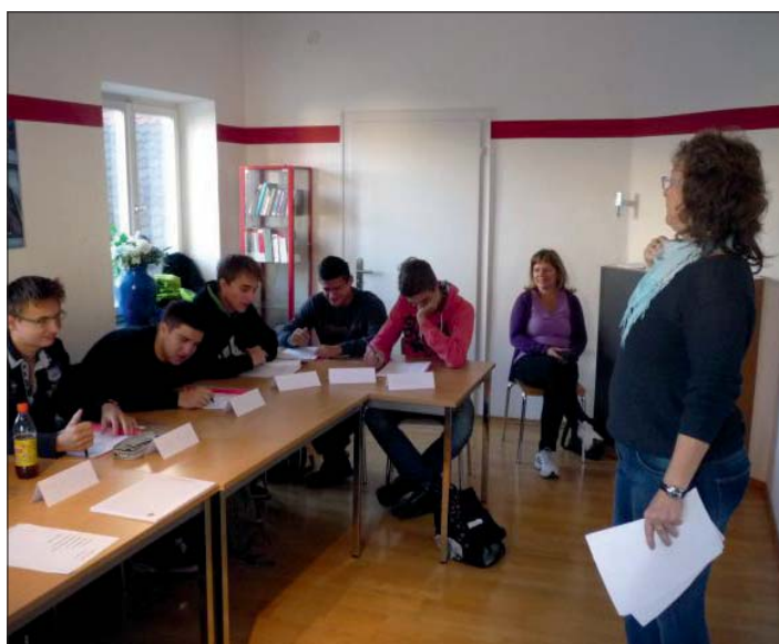
Jazykový kurz byl hlavním bodem vzdělávacího "výletu"...