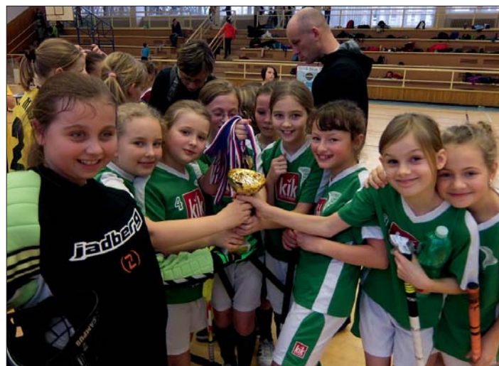
Vítězství je naše!