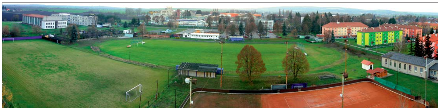
Sportovní areál TJ Sigma Lutín je tu pro všechny milovníky sportu.

fotbal, kluziště v zimě – Jakub Chrást 724919829