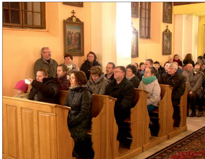
Kaple byla plně obsazená svátečně naladěnými posluchači.