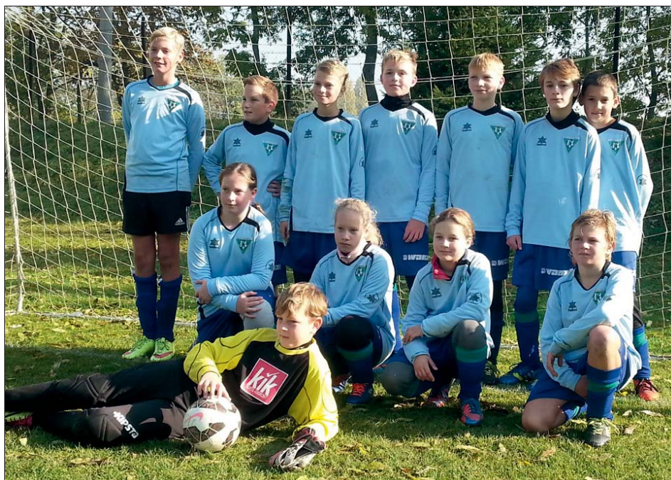
Nová fotbalová naděje stále potřebuje posily.