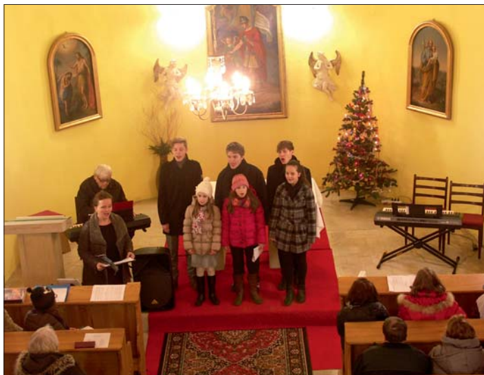
Známé i méně známé koledy zazpívali žáci lutínské pobočky ZUŠ.

V Třebčíně by snad ani nemohly začít Vánoce bez svátečního koncertu. I letos se ve středu 23. prosince rozezněly o půl šesté večer před kaplí sv. Floriána nástroje Olomouckých trubačů. Jejich tóny zvaly posluchače dovnitř do prostor trebčínské kaple k poslechu vánočních melodií.