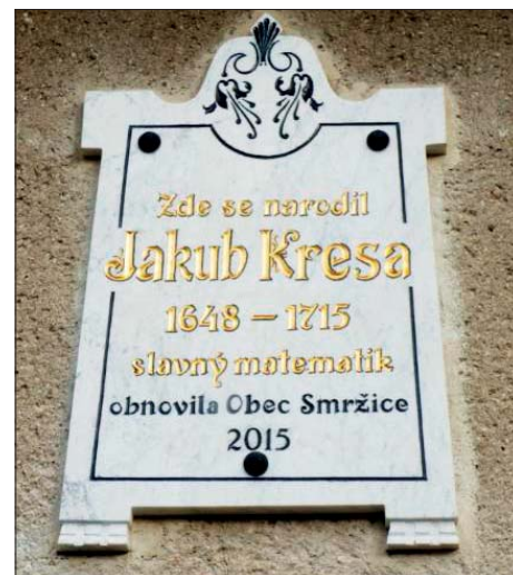
Detail pamětní desky.