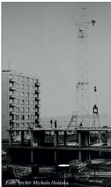
Budování mateřské školy v roce 1979.