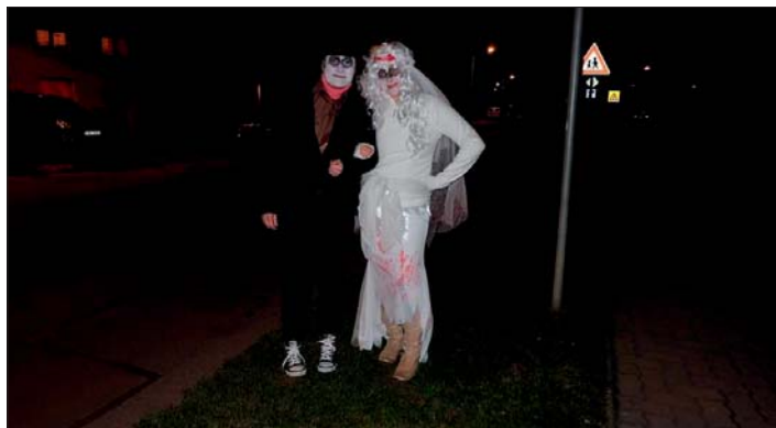
Kdo by se bál strašidel?

Rodinné centrum, Křasek O dušičkové neděli 1. listopadu jste za potmělého večera mohli na Rybníčku a v jeho blízkém okolí narazit na strašidla a strašidylka a ucítit vůni svařáku či dětského punče. Konal se zde totiž první ročník akce