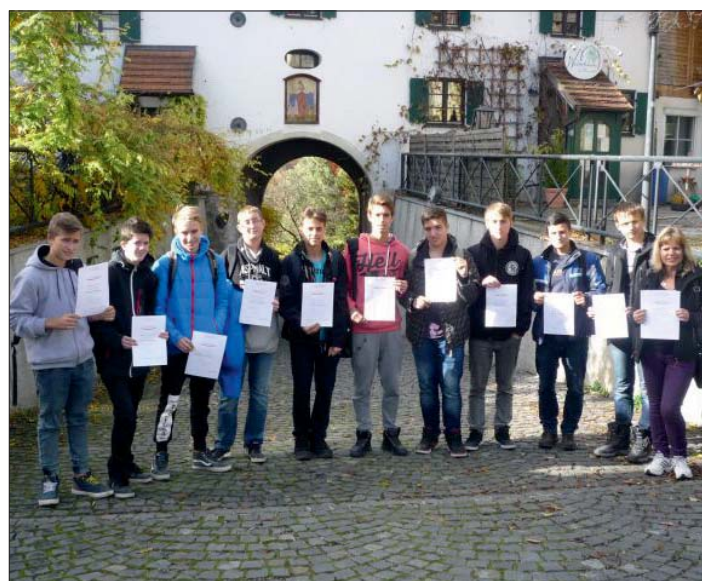
... a získané certifikáty důkazem jeho úspěšnosti.