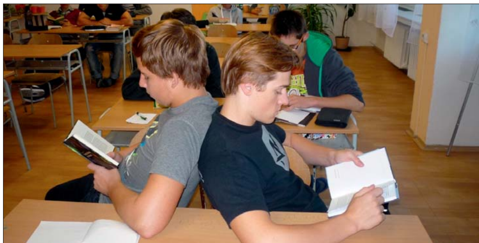
Od počítačů a "chytrých" mobilů na chvíli zase zpátky ke knize.