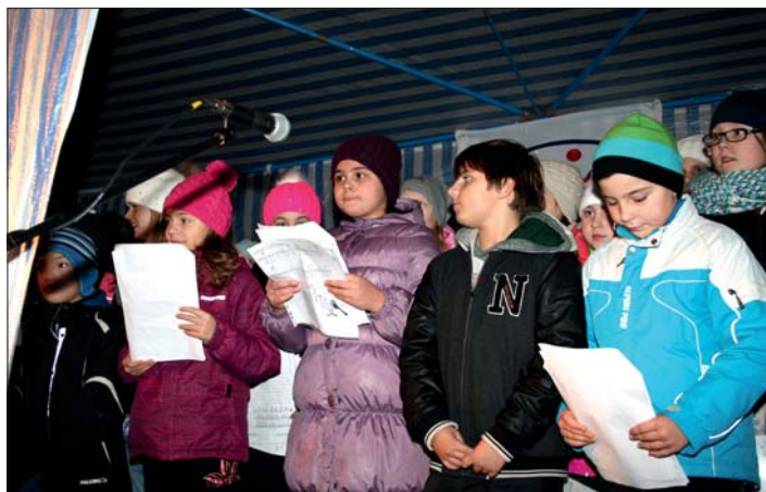
Prosincové lidové tradice nám přiblížily děti.