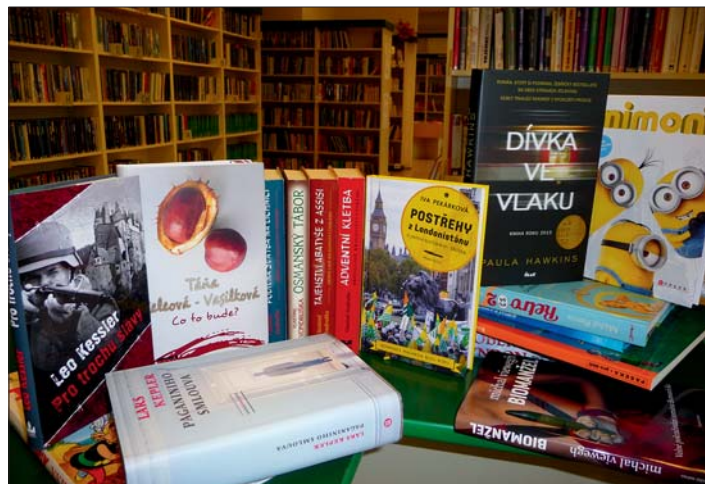
Jsme tu pro naše čtenáře.