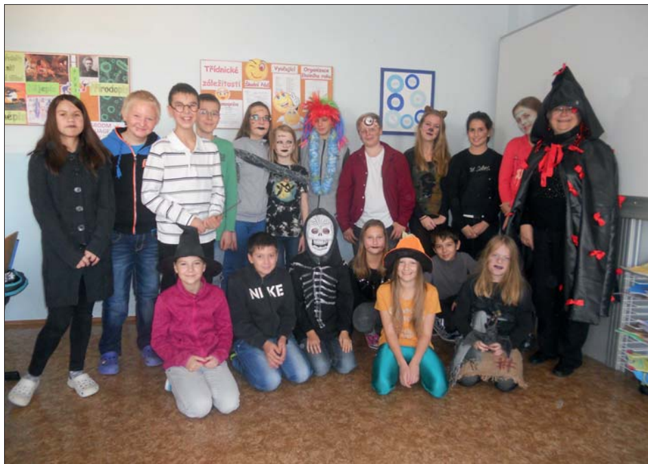
Čeština je pro čaroděje hračka.