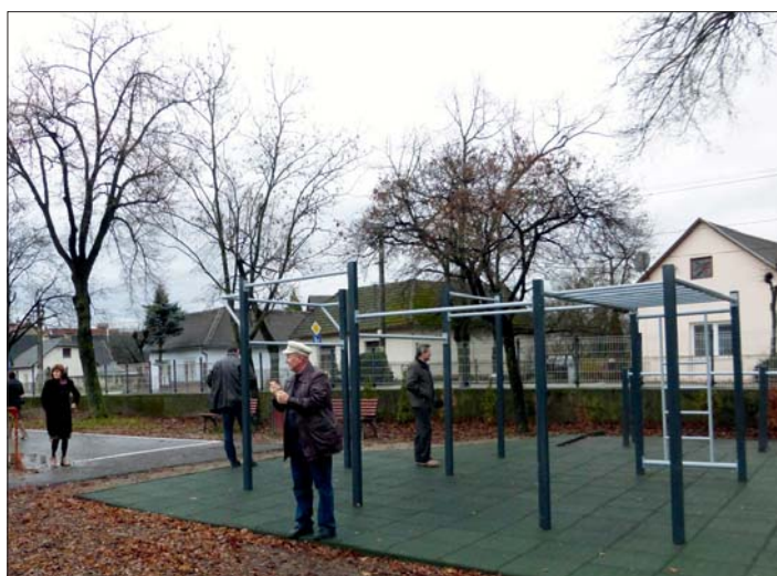
Ve fitnessové zóně města Nemšová.