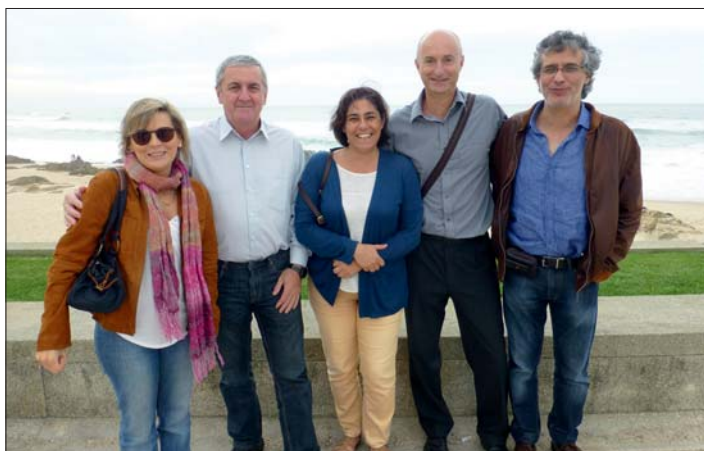
Oddechový čas s kolegy.