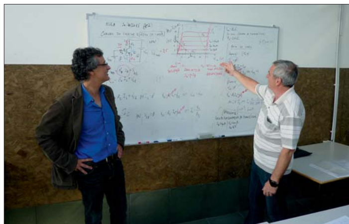
Na výuce technických předmětů.