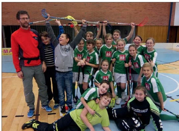
Radost ze hry je nejlepší motivací.