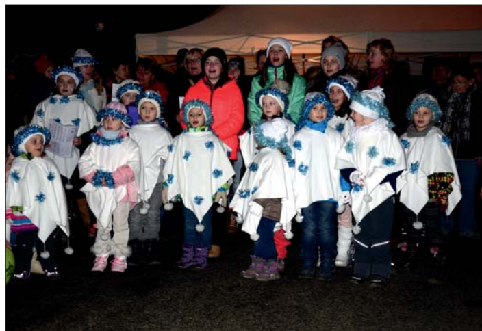
Zpívání u vánočního stromu před kaplí.