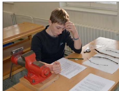
Odměnou za náročnou přípravu byla radost z úspěchu.