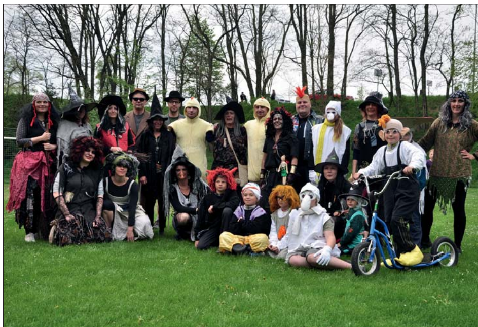
Velké i malé čarodějnice si svůj den užily.