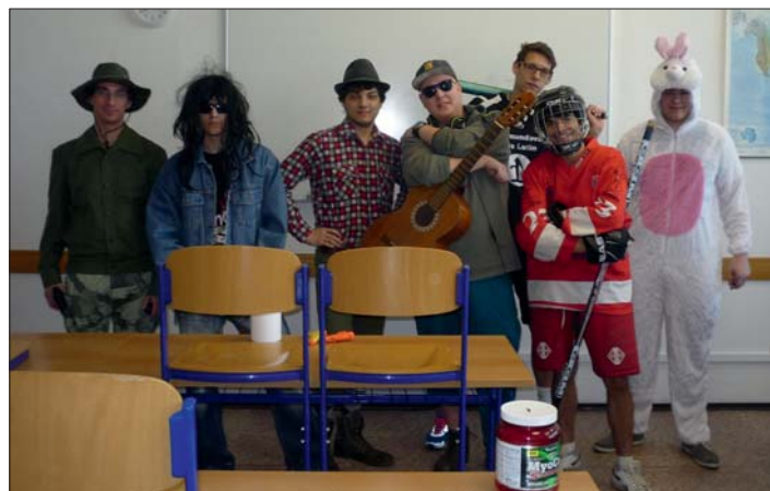
Poslední zvonění před „svatým týdnem“ a pak...

Další částí maturitní zkoušky byla tolik obávaná státní matura . Matematiku si zvolilo 17 studentů, angličtinu 14 studentů a s českým jazykem se museli „popasovat“ všichni. K naší velké radosti dopadla tato část pro naše studenty velice dobře.