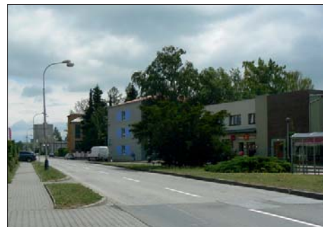
Pravá strana ulice.