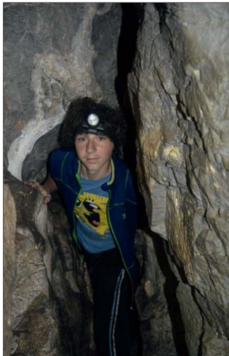
Kdo se bojí,...