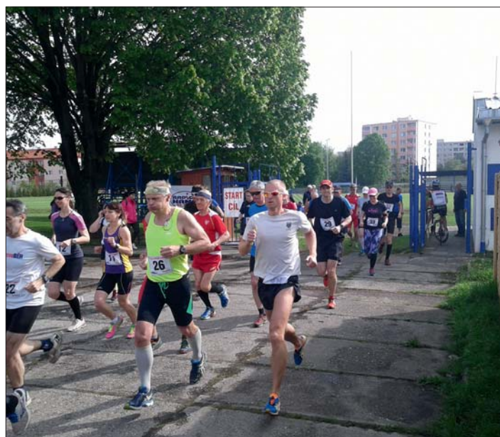
Start a cíl běhu na 20 km byl na stadionu TJ.