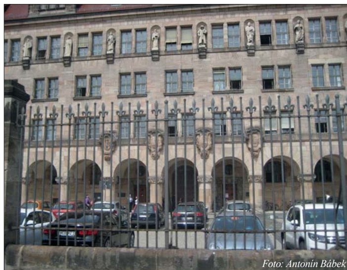
Norimberský soudní palác – místo procesu s válečnými zločinci.