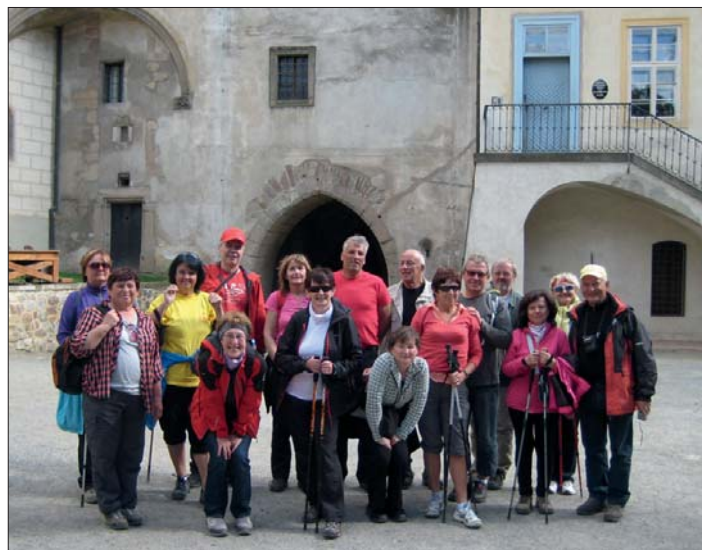
Na nádvoří Křivoklátu.