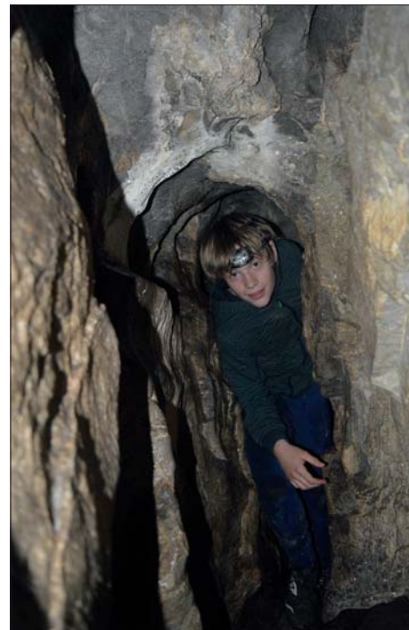
... nesmí do jeskyně.