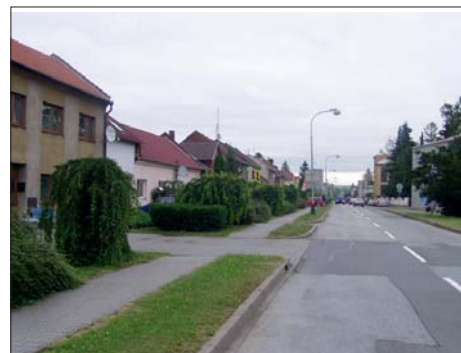
... a stejné místo dnes.