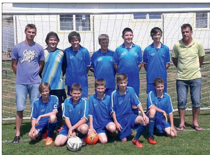
Starší žáci s trenéry v sezoně 2014/2015.