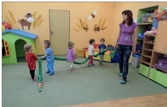
Učíme se hrou.

A nyní už nakukují natěšení rodiče, přicházejí si své děti vyzvednout, Čekanka