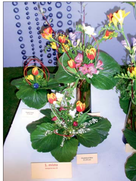
Děkazy zaslouženého vítězství.