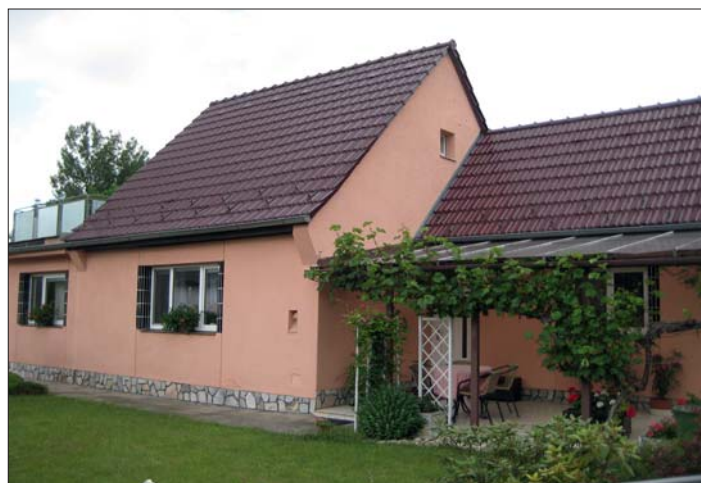
Domek po větší přestavbě s novou přístavbou vlevo.