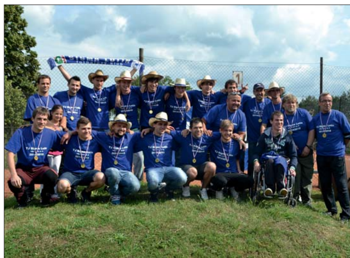
„A“ mužstvo postupující do I.A třídy OKFS.