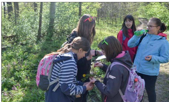
"Botanikové" poznávají a určují byliny.