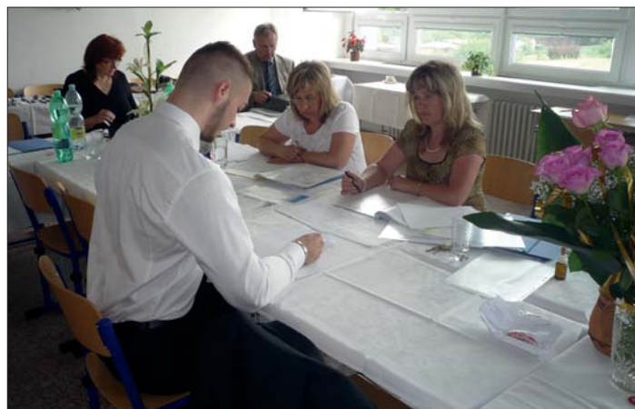
Ústní zkouška z českého jazyka.