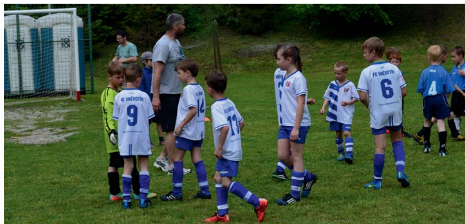
Benjamínci si zahráli v sobotu dopoledne.