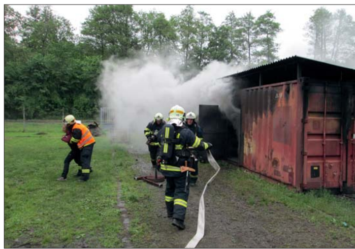
Záchrana osoby z hořícího domu.