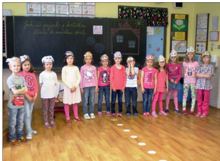
Kočičce a pejskovi pomáhali všichni kamarádi.