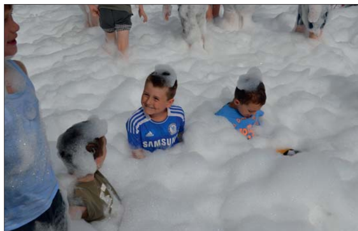
Díky hasičům se děti vyřádily v pěně.

P.S. V úterý 16. června už jsme věděli, že dva z vypuštěných balónků zamířily na sever. Jeden urazil vzdálenost 82 kilometrů a dolétl do Dolního Benešova na Opavsku,