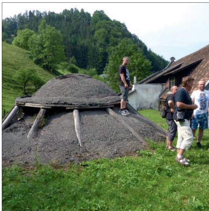
Milíř na výrobu dřevěného uhlí.