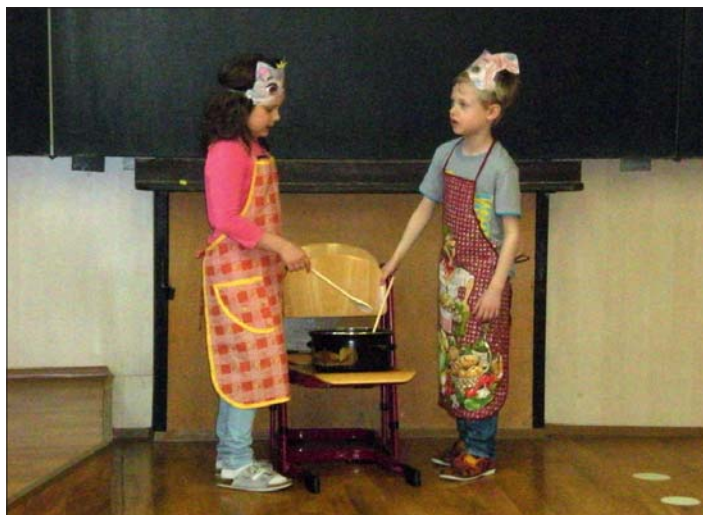
Kočka Karolína a pejsek David.