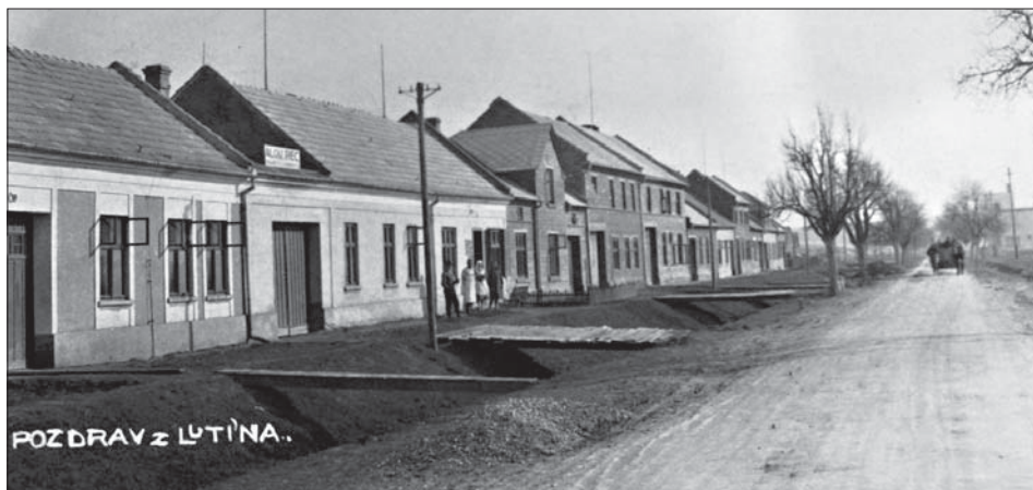
Olomoucká ulice od pošty v roce 1931.