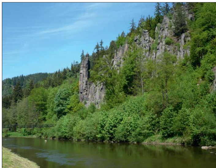
Jedna z turistických tras vedla malebným údolím Ohře.