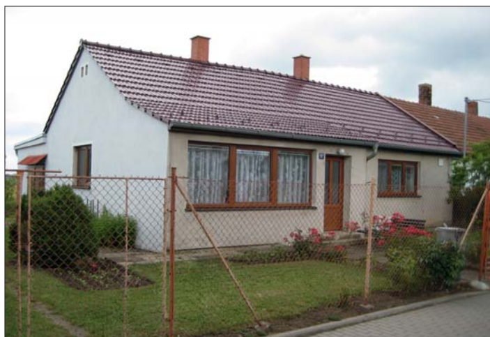
Levá strana dvojdomku dnes.