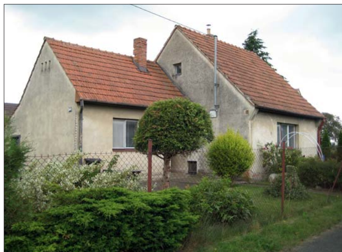
Domek s přístavbou v původní podobě.