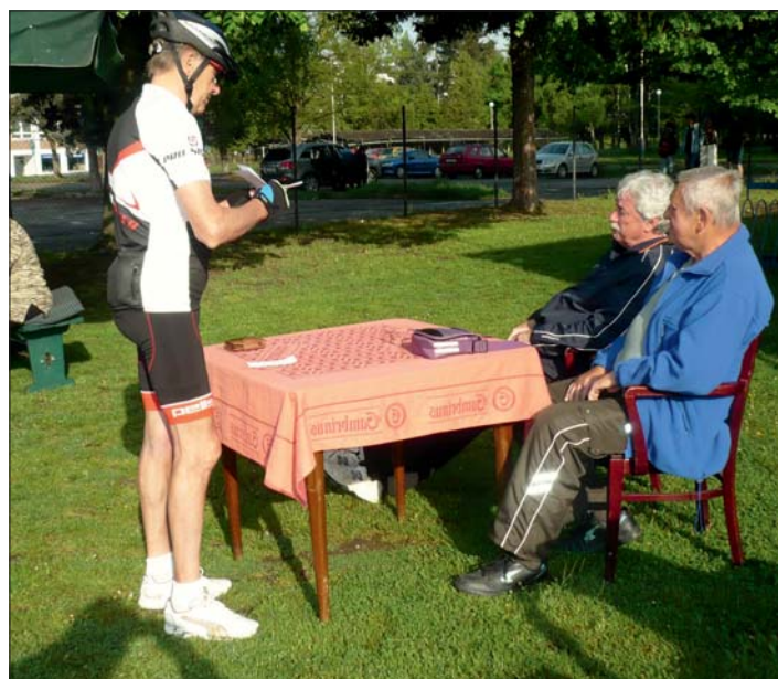
Registraci účastníků spolehlivě zajišťovali členové TJ.