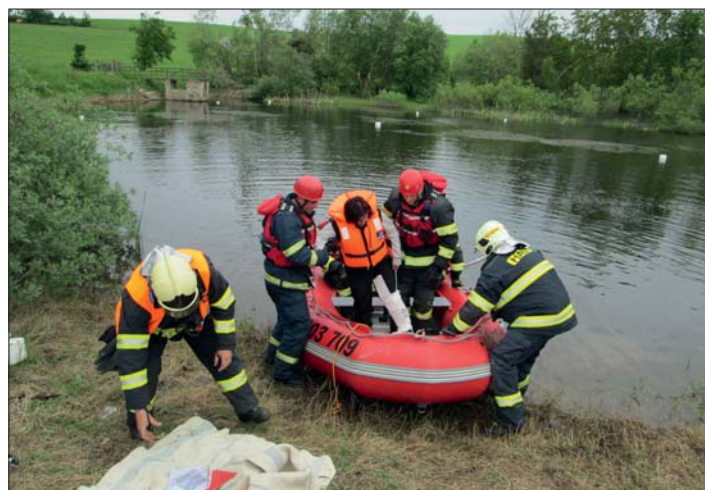
Zachraňování osoby při povodni.

Pro družstva bylo připraveno osm stání s nelehkými disciplínami: simulovaný požár rodinného domku, vyproštění osoby po pádu do potoka, vyhledávání a komunikace v terénu, dopravní nehody, záchrana