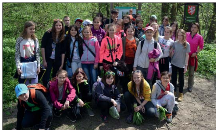
Na hranici „Lesu Království“.