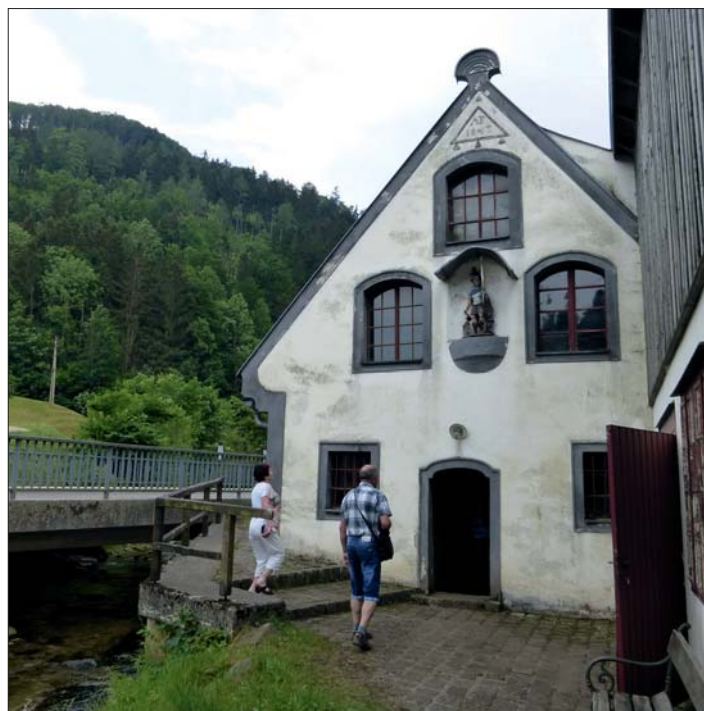
Stará kovárna s funkčním vybavením.