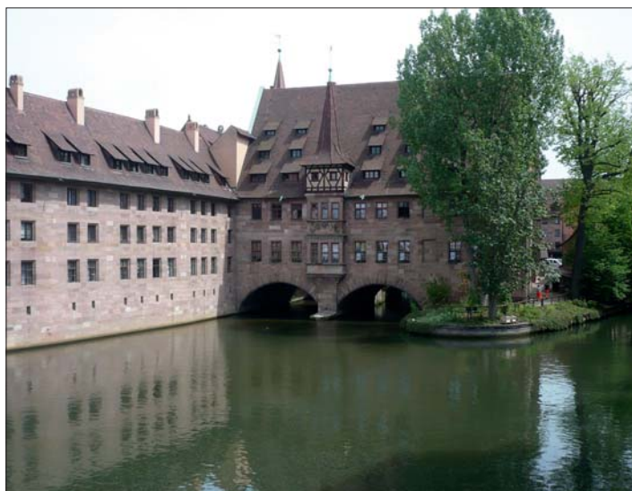
U staré norimberské nemocnice (špitálu).

Informace získala a zpracovala Mgr. Ladislava Kučerová