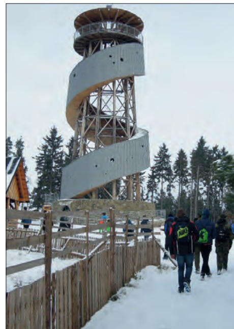
Cíl u rozhledny na Kosíři.