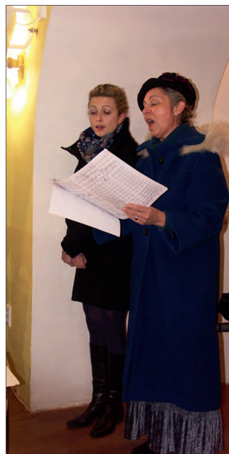
Solistky při koncertu.

Loňským jubilejním vánočním koncertem jsme završili jednu etapu konání této krásné slavnostní akce. Nabízí se otázka, jak dál a kdo z mladší generace převezme úkol v této cestě pokračovat. Po skončení toho loňského, v tomto duchu posledního koncertu se totiž jeho