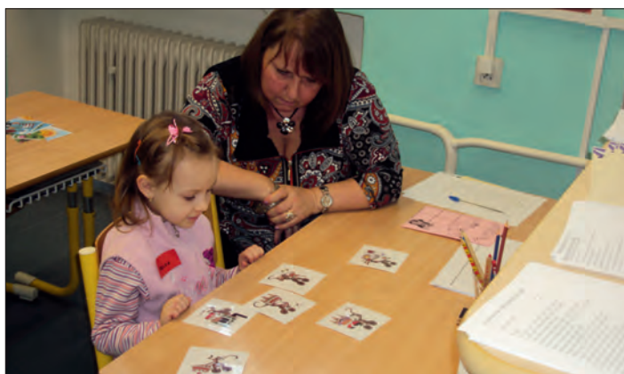
Však já na to přijdu!

Před odchodem měli rodiče s dětmi možnost navštívit i školní družinu, kterou mohou děti po nástupu do školy navštěvovat. Myslím si, že tento den byl příjemný nejen pro předškoláčky, ale i pro pedagogy, kteří se zápisu účastnili.