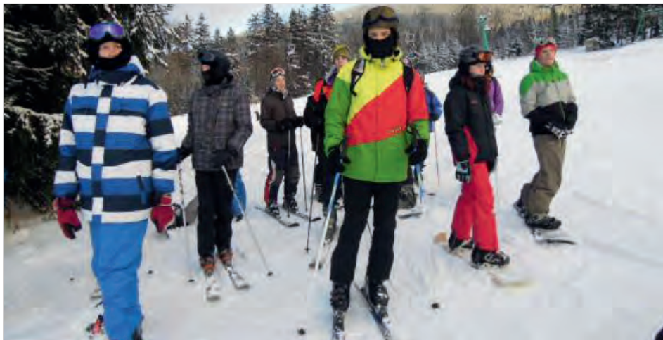
"Prkna" i lyže jsme zvládli.