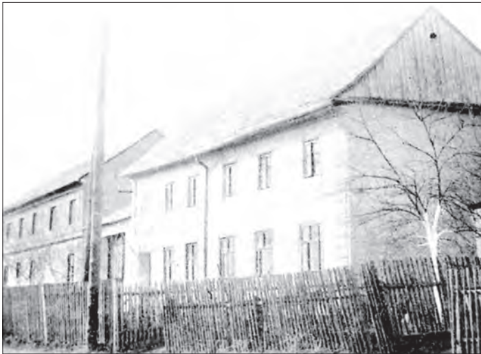
Ulice s domem Veselých dřívě