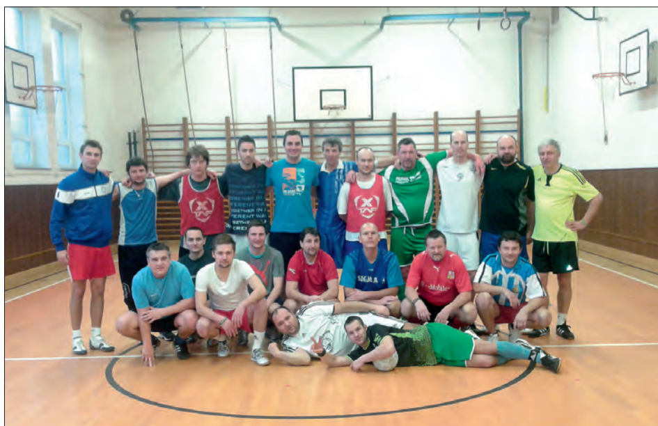
V plném počtu.