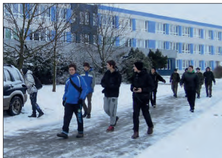
Start od školy.