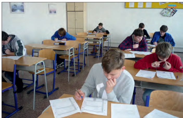
„Přijímačky“ zatím jen nanečisto.