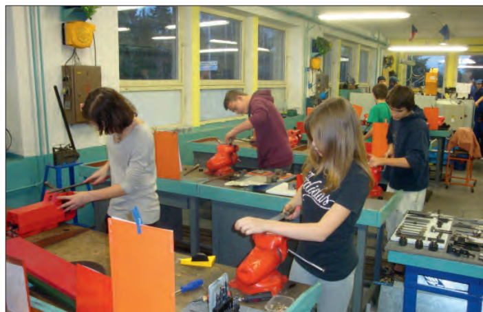
I v dílně si poradíme.