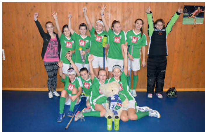
A je to "doma"!