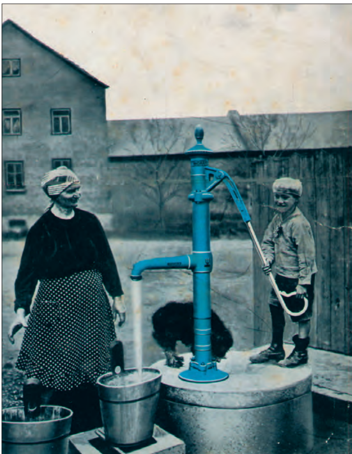
Před 87 lety.