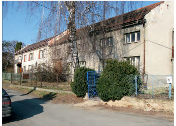
a v současnosti.