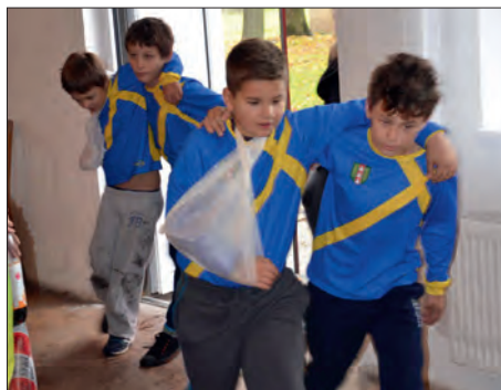
Ošetření a transport zraněných.

Region HANÁ ve spolupráci s místními akčními skupinami Bystřička a Požítavie – Širočina realizuje projekt mezinárodní spolupráce s názvem „Dobrovolní hasiči – historie a budoucnost“. Projekt je zaměřen na podporu mladých dobrovolných hasičů. Společně se navštěvují a pořádají semináře, exkurze a soutěže.