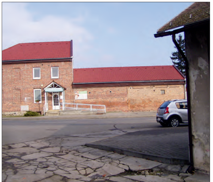
Po loňské výměně střechy.