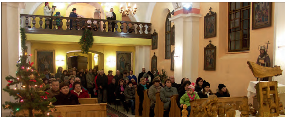
Vánočně vyzdobená kaple.