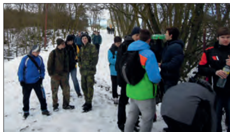
Odpocinek v lese.