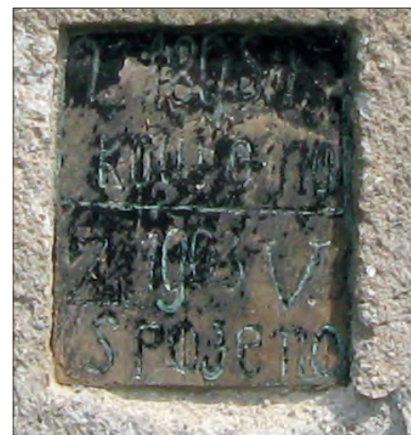
Svěděk doby zblízka.