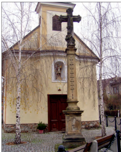
Kříž před kaplí volá po opravě.

Kříž byl postaven v roce 1755, tedy rok před dokončením stavby nové kaple,