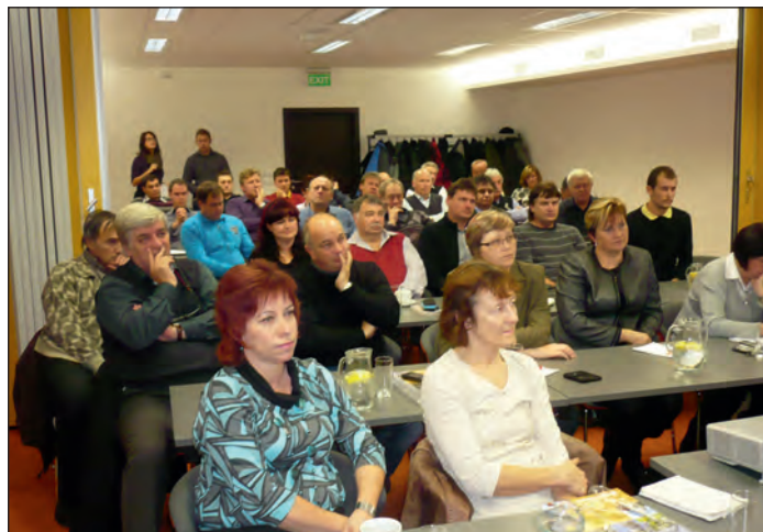
Setkání zástupců MAS.