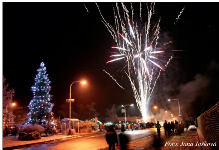
Velký ohňostroj na závěr.