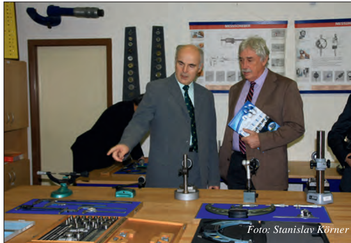
Nová učebna měření a elektrotechniky.