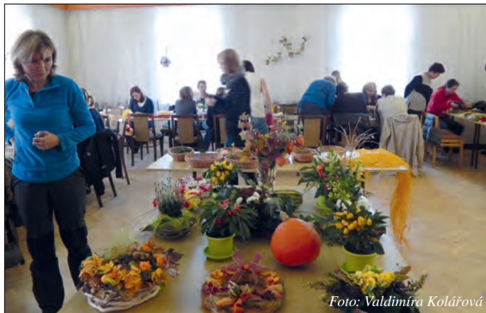
Prodejní výstava výrobků.