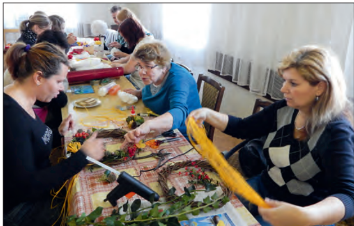
Šikovné ruce v akci.