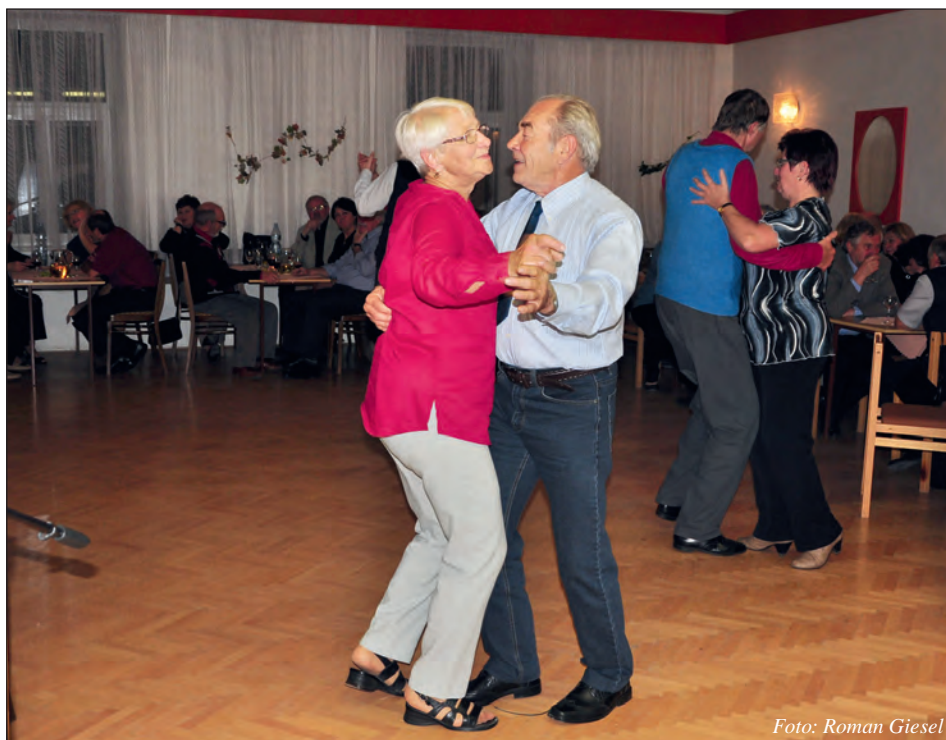
Dobrá nálada vládla po celý večer.