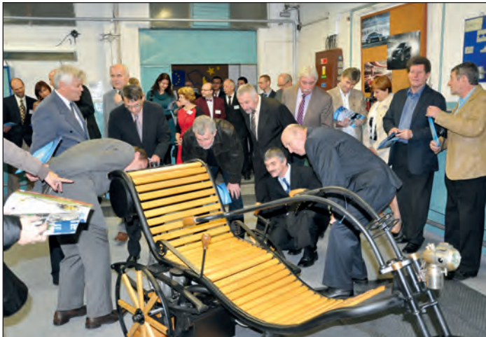
Historická tříkolka sklídila zasloužený obdiv.