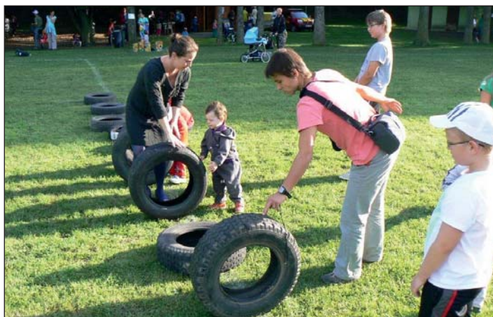
Krásné svatováclavské nedělní odpoledne si užili malí i velcí.