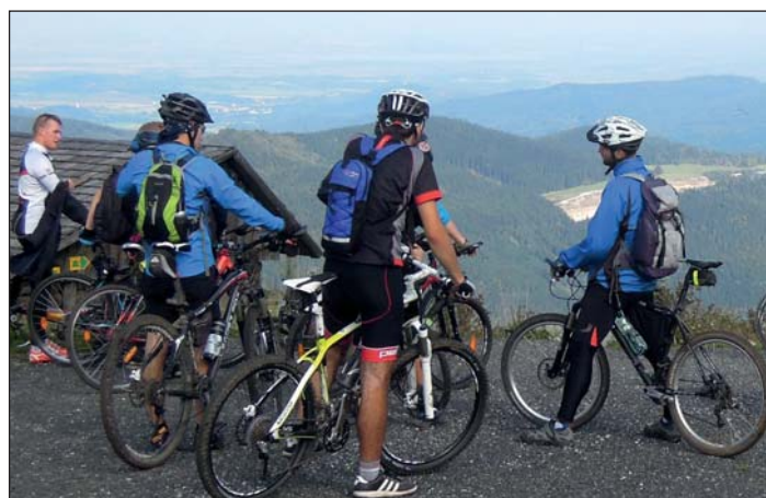
Výhled do krajiny.