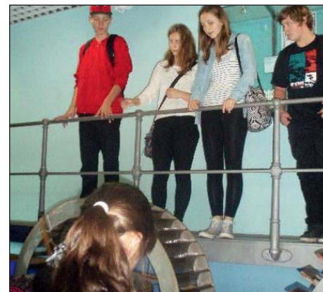
V expozici Vodní motory.