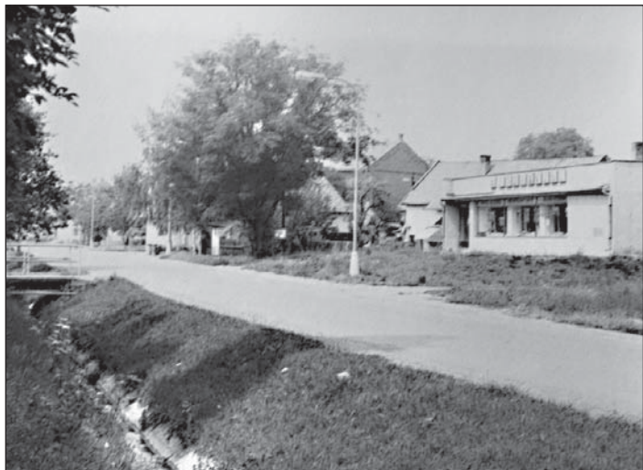
Před pětacícti lety ...

V minulých dvou číslech našeho seriálu dobových fotografií jsme zavzpomínali na proměny křižovatky u pošty. Dnes nabízíme pohled, který se opakuje školákům ze sídliště každý den při cestě