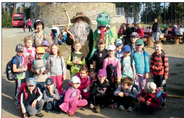
Prvňáčci s Dráčkem a Košířanem.