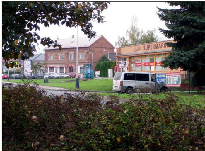
... a dnes.