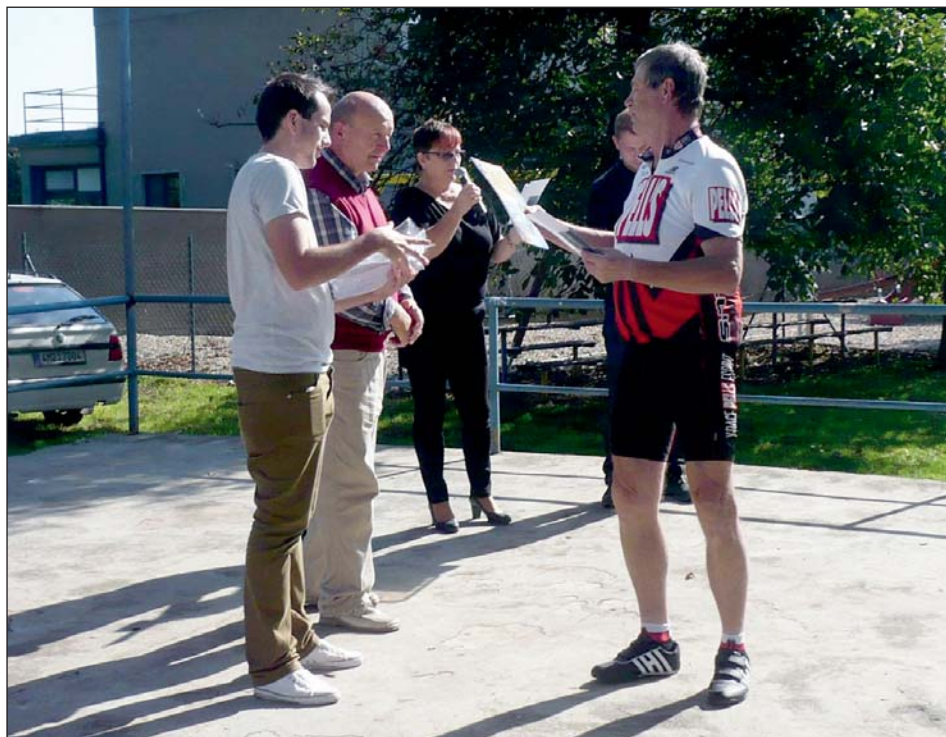
Ukončení XI. ročníku Hanáckého cestovatele v Bílsku.