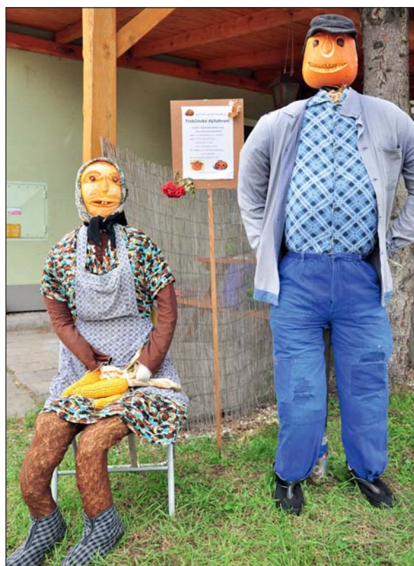
Manželé „Dýňovi“ čekají na autobus.