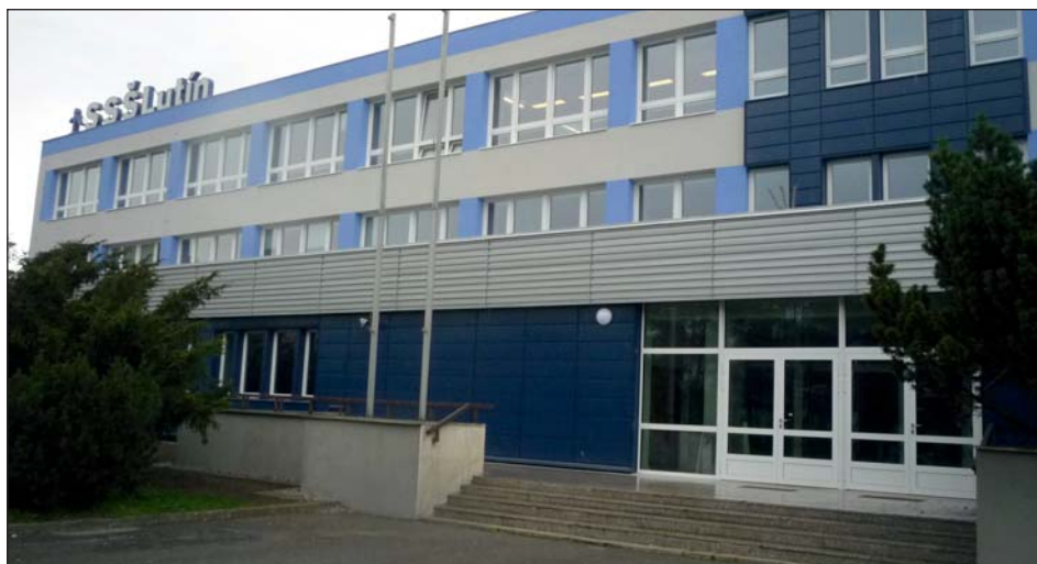
Sigmundova škola je po 27 letech celá v novém.