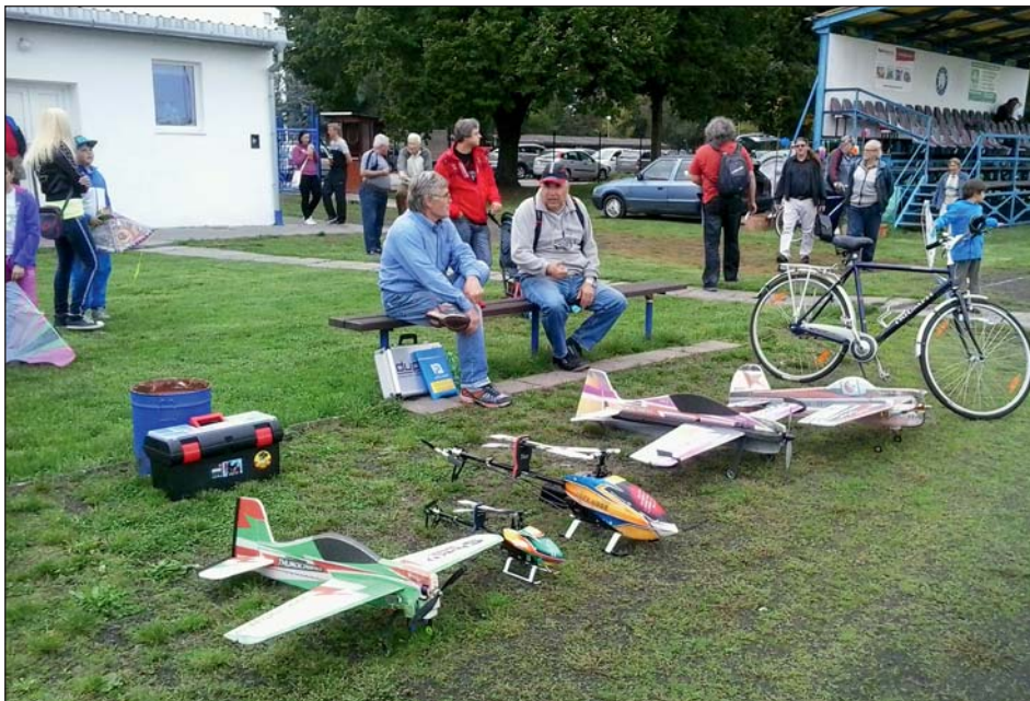
Chvilka soustředění před startem modelů.