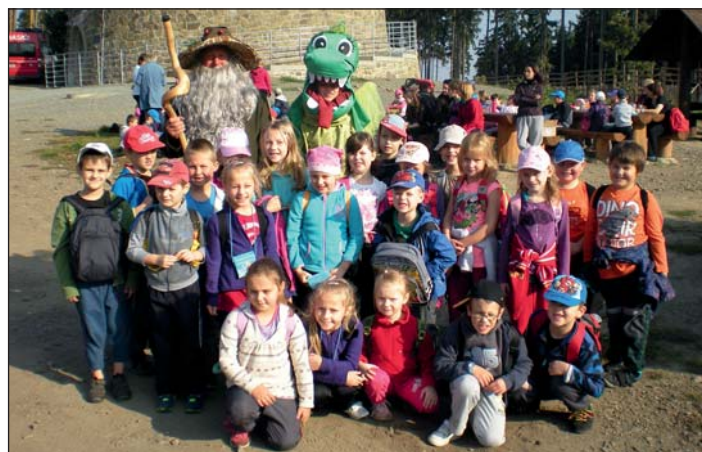
Třída I. B.