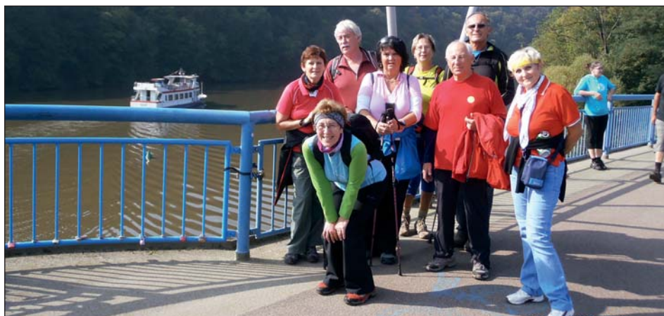
Procházka kolem přehrady.