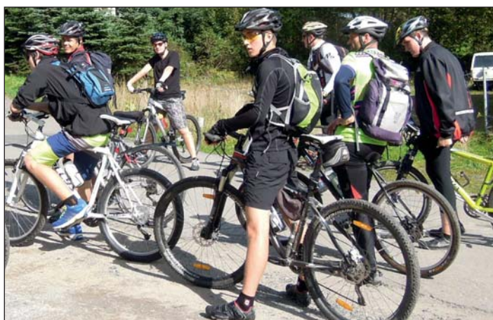
Musíme i do kopce?