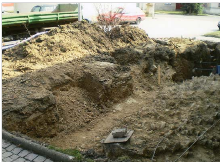
Odhalené pozůstatky základů žudra.