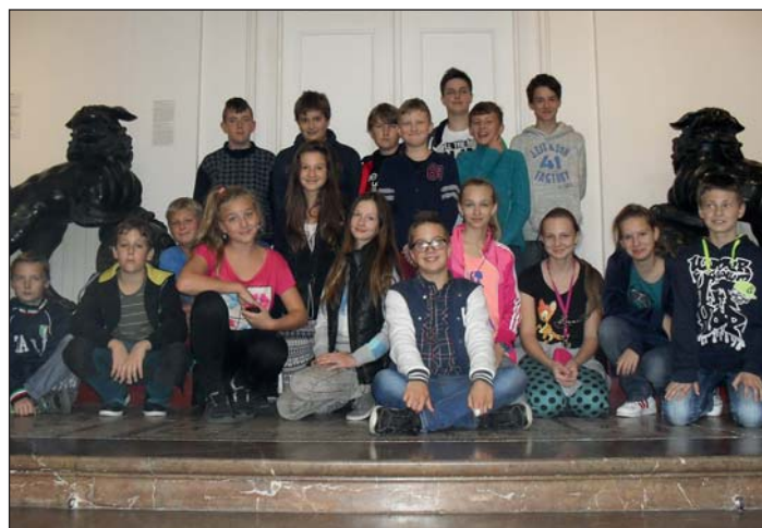
Vzácná chvíle odpočinku.