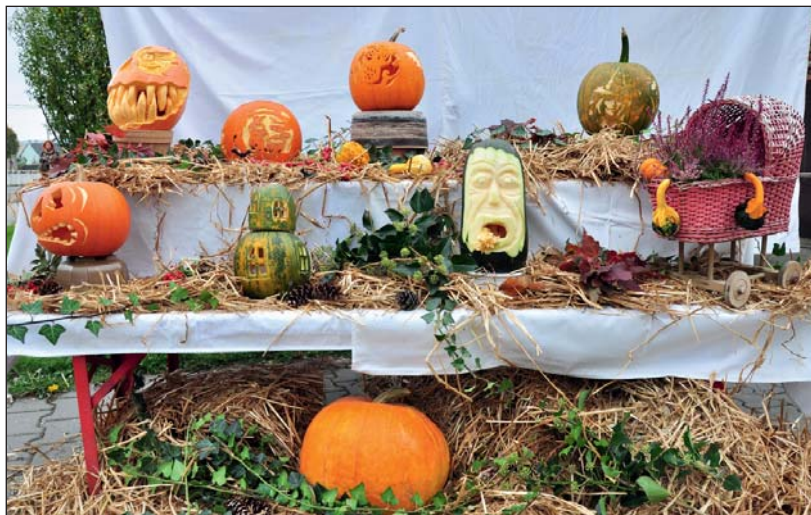
Na výstavce se sešlo přes čtyřicet exponátů.