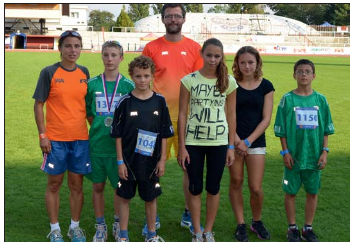
Naše reprezentační pětka s trenérem.