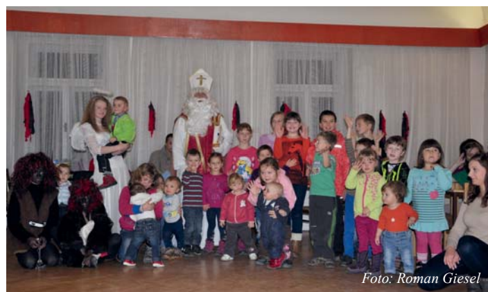
Čerti se těšili marně.