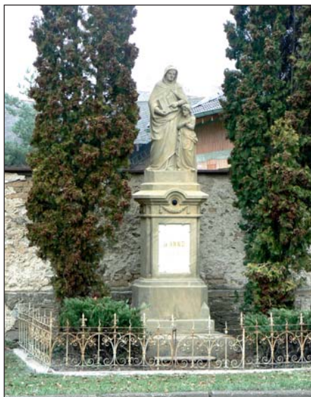
Opravená socha sv. Anny v Lutíně.