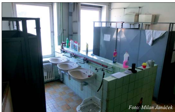
Umyvárna dřívě ...