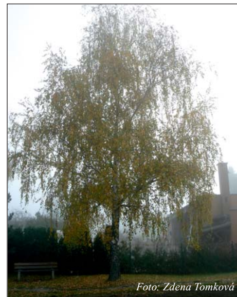
Zima v lednu 2014.