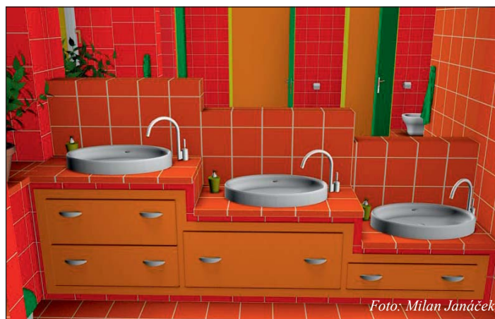
... a dnes.