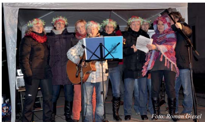
Zpívání u stromu.