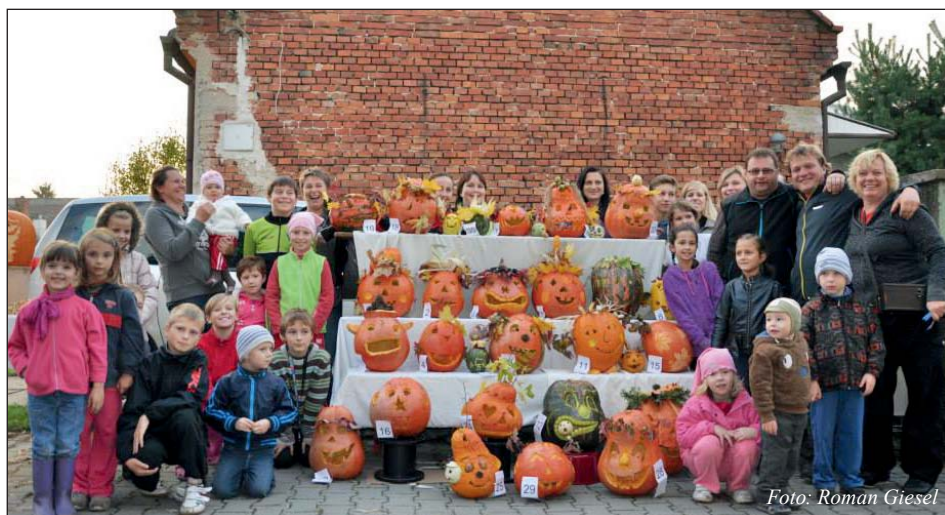
Dýňohraní – největší akce roku 2013.

Na vavřínech jsme určitě neusnuli. V obci se stále něco dělo. Podíleli jsme se na orga-