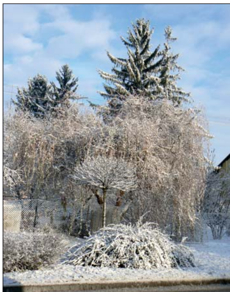
Zima v lednu 2013.

(LEADER = angl. zkratka pro název Propojení akcí pro rozvoj ekonomiky venkova)