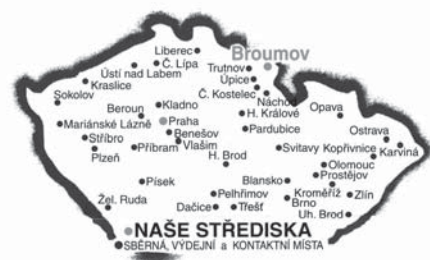
Sběrná, výdejní a kontaktní místa