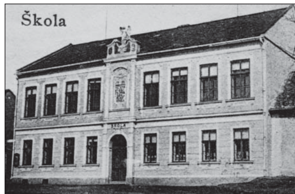
Nová škola krátce po založení