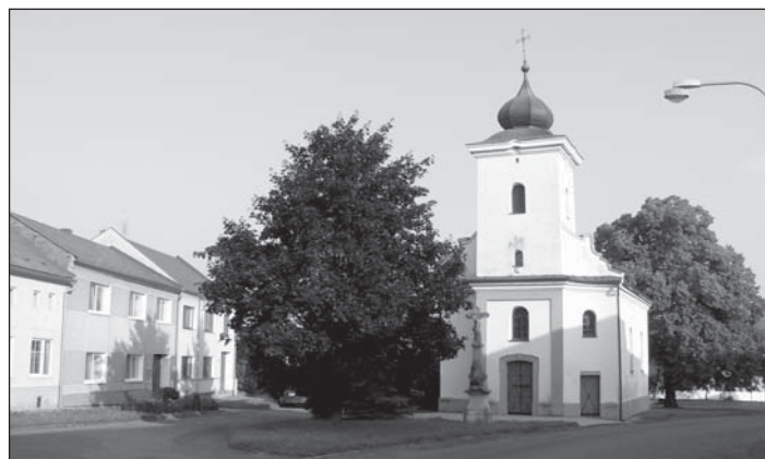
... a nyní