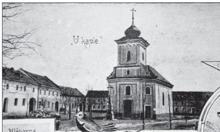
Kaple sv. Floriána dříve