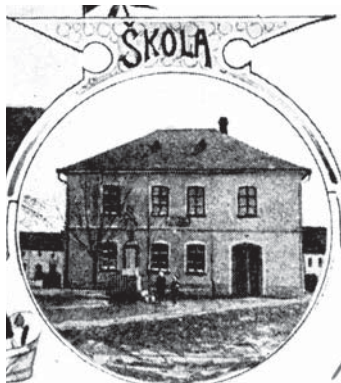
Stará škola - dnešní KSZ