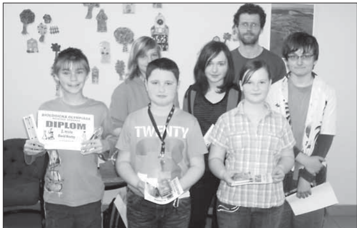
Vítězové školního kola biologické olympiády