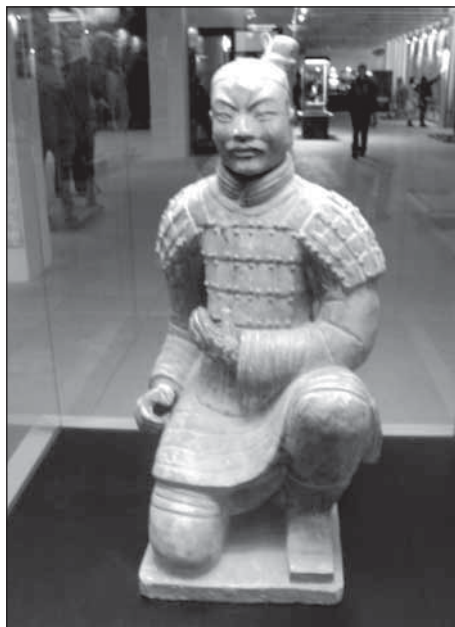
Lukostřelec terakotové armády

Dále už slovy Tomáše Behůně, jednoho z účastníků exkurze: