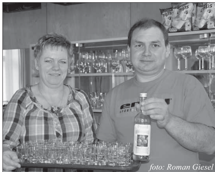
Slavnostní vyhlášení – připitek pro všechny