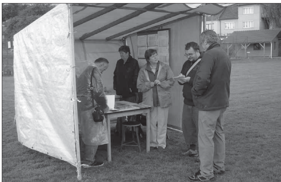
Fotografii se vracíme k loňskému zahájení ve Slatinkách.