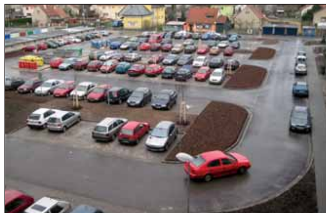
Centrální parkoviště po rekonstrukci