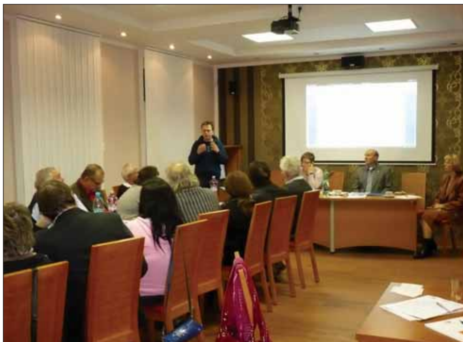
Valná hromada Regionu HANÁ (Drahanovice 3. 12. 2009)

Místní akční skupina, která funguje již od roku 2003, má hlavní strategický cíl zkvalitnit život na našem území. Metodou pro dosažení tohoto cíle je v současné době LEADER, propojení místních aktivit pro rozvoj venkova. Je vypracován a aktualizován strategický plán LEADER a opatření na období do roku 2013. Jsou uzavřeny smlouvy o partnerství a spolupráci. Podnikatelé a nestátní neziskové organizace působící na území Regionu HANÁ jsou členy občanského sdružení nebo mají k dispozici informace a nabídky možností.