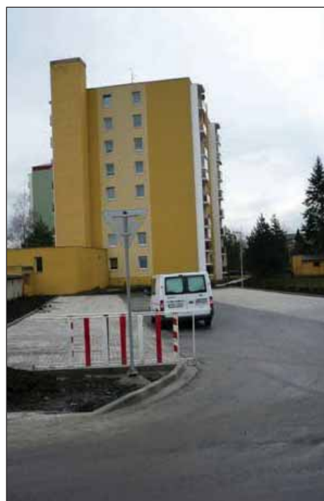
Nová parkovací plocha za garážemi