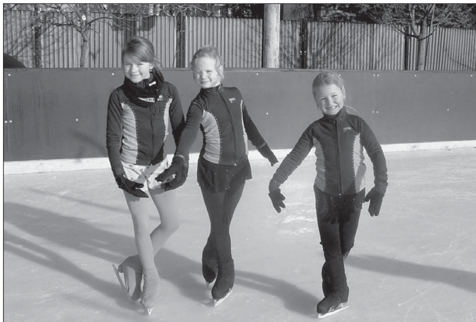
Malé krasobruslařky z Olomouce