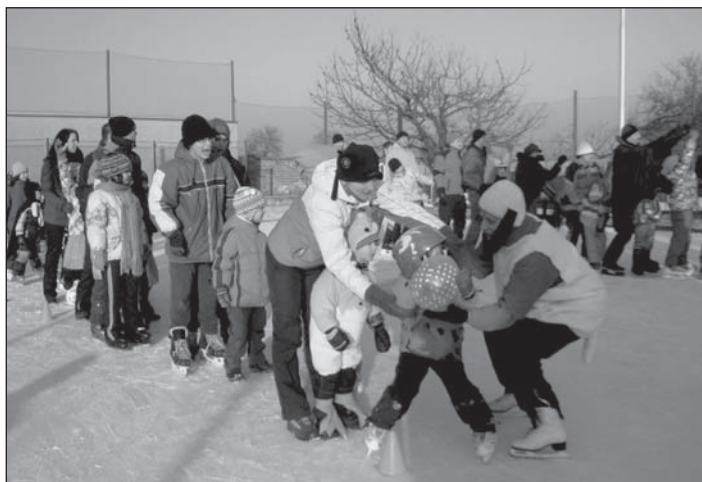
První krůčky nejsou lehké