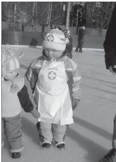
„Sester“ není nikdy dost

V sobotu 11. února uspořádala TJ SIGMA Lutín ve spolupráci s kulturní a školskou komisí dětský maškarní karneval na ledě.